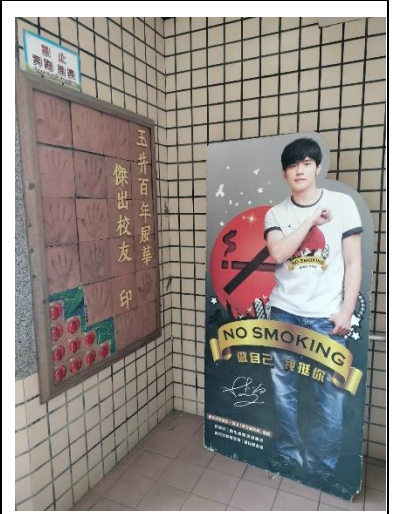
以偶像立牌宣導拒菸活動