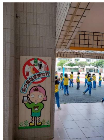
製作 Q 版人偶，鼓勵小朋友減少含糖飲料攝取