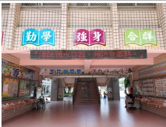
以跑馬燈傳遞相關健康訊息