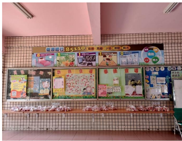
學校 85110 大型輸出海報