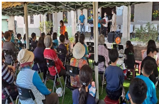
薩克斯風團隊到社區照護中心(照陽小棧)表演