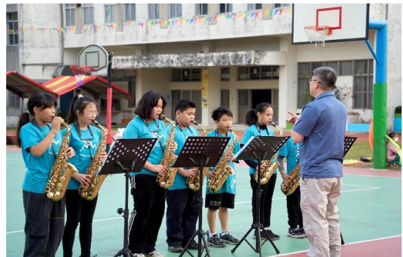
四至六年級組成的薩克斯風團隊