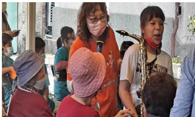
薩克斯風團隊與長者互動