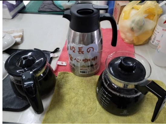
校長每天手沖 5000cc 咖啡已經快四年了

一、咖啡哲學：校長每天親自手沖咖啡(約 5000c. c)給校內有喝咖啡的同仁(約 15 位)。