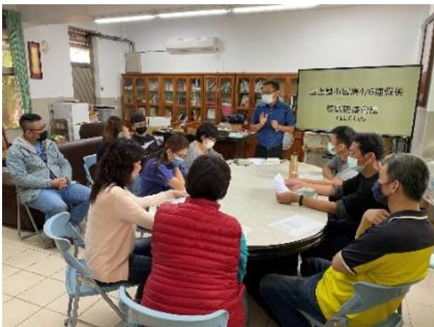
連假後召開防疫會議

對於 Covid-19 或有流行感冒疫情，校內會召集行政人員與老師(含幼兒園)召開會議，討論如何防範疫情擴散、自我保護、線上教學等措施。