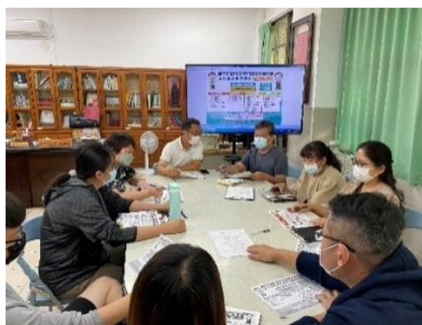
防疫會議討論如何因應疫情及線上教學方式