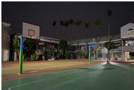
籃球場晚上也增加照明設備