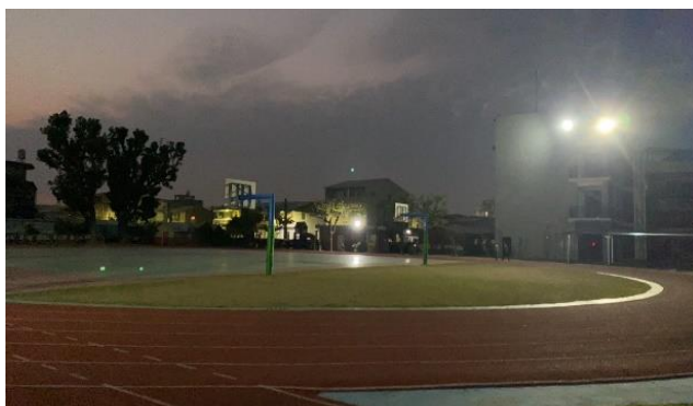
增加夜間照明方便居民晚上運動