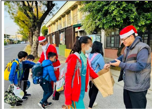
校長和會長耶誕節當天送小朋友健康零食