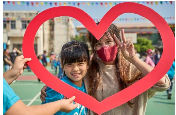
國小部親子運動會