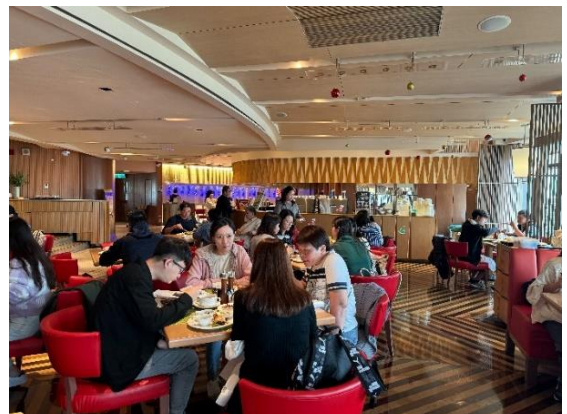
校園氣氛融洽用餐愉快