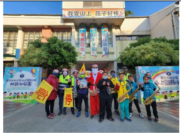
校長與導護志工和表演小朋友合影