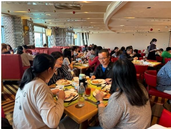
教職員期末聚餐分享工作心情

二、文康活動：每年期末或由文康活動費或由校長自費請全校同仁聚餐，凝聚全校向心力。