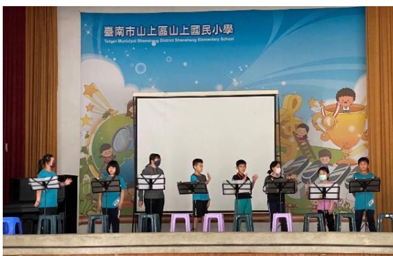
三至六年級組成的英語讀劇團隊