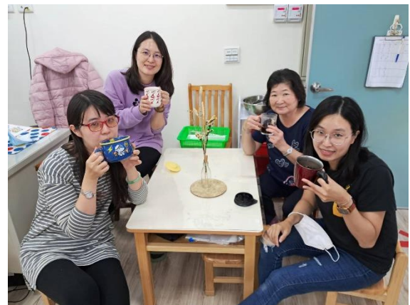
同仁享受每天早上一杯咖啡保持愉悅心情

二、文康活動：每年期末或由文康活動費或由校長自費請全校同仁聚餐，凝聚全校向心力。