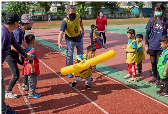
幼兒園親子運動會