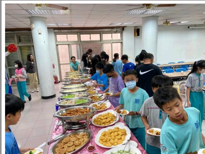
學生有紀律愉快的用餐