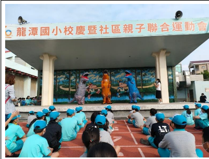
恐龍大使在友善校園周宣導