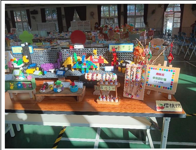
活動中心展出學生的作品