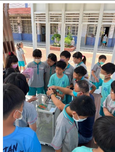
學生學習如何照顧生命