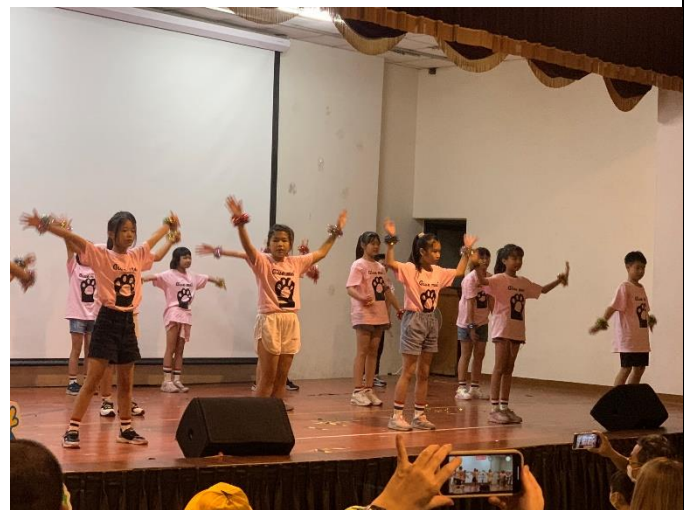
活力四射的熱舞社演出