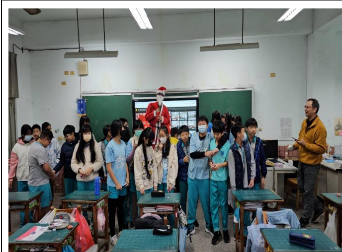
聖誕老公公到各班給聖誕禮物