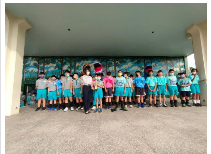
恐龍大使與領獎學生合影