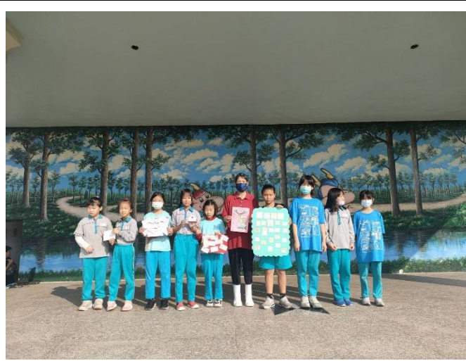
學生自製感謝卡謝謝服務 27 年的廚工媽媽