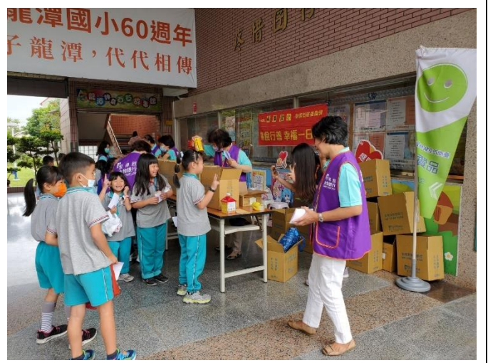
學生熱烈參與捐贈物資