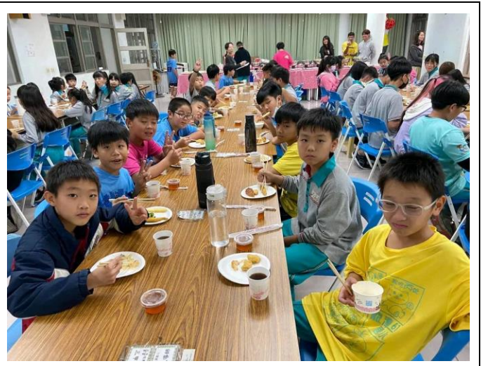
感謝學生的付出與努力為校爭取榮譽