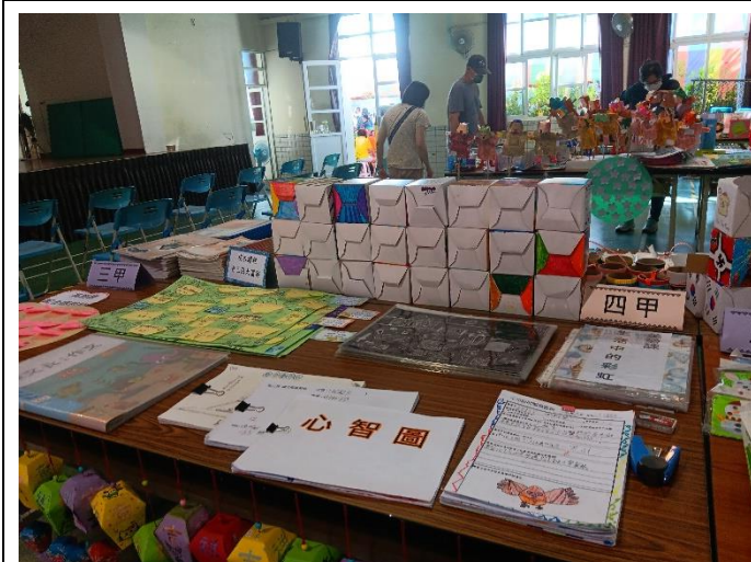
活動中心展出學生的作品