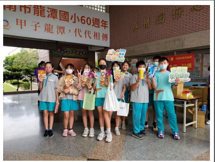
盡一己之力幫助別人