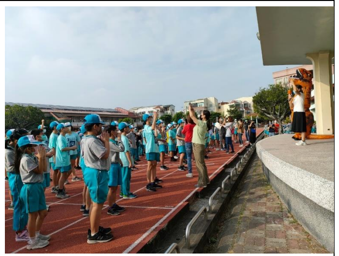
恐龍大使升旗朝會時宣導生活教育