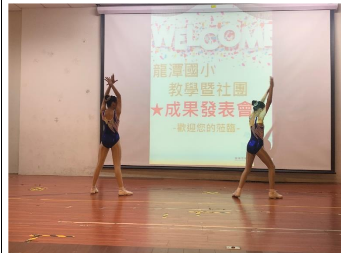
有氧體操隊精彩的動作