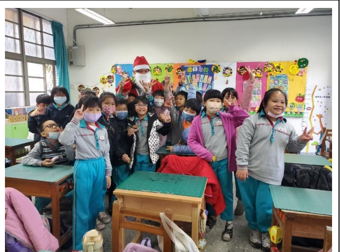
聖誕老公公到各班給聖誕禮物