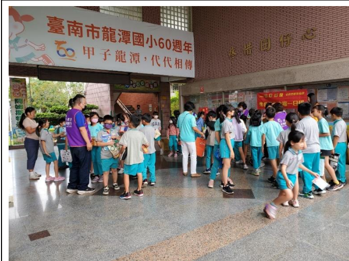
學生熱烈參與捐贈物資