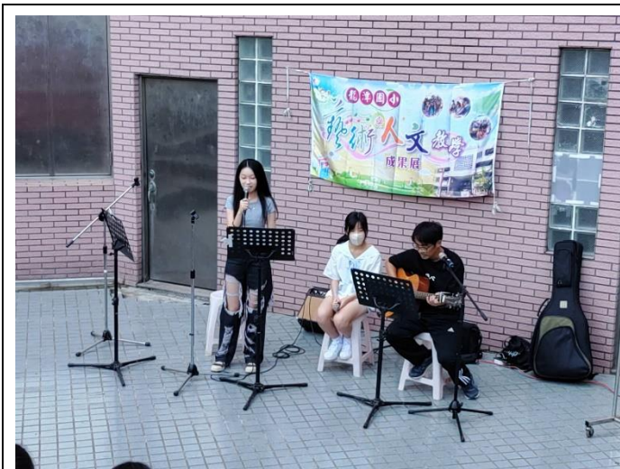
學姊回校與學弟妹同樂