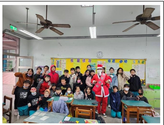
聖誕老公公到各班給聖誕禮物