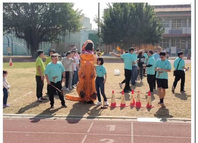
恐龍大使參與親子運動會