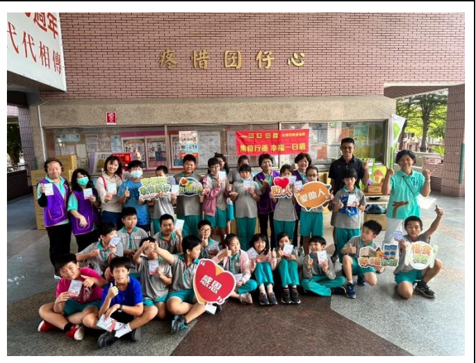
校園充滿感恩溫暖的氛圍