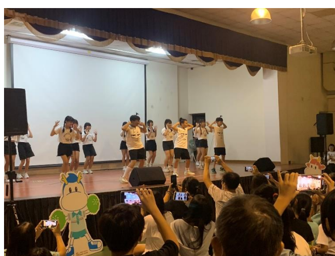
六年級青春洋溢的舞蹈