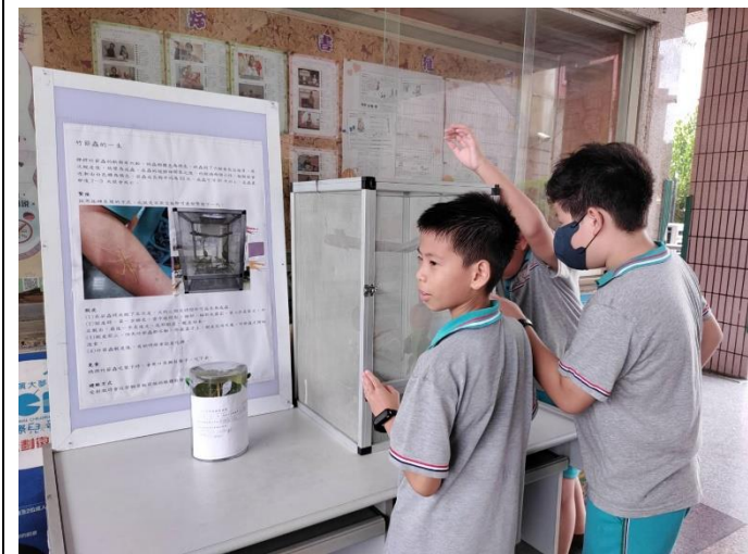
認識竹節蟲的一生