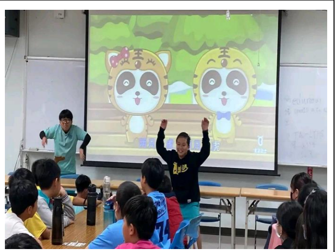
餐後的餘興表演學生盡情展現