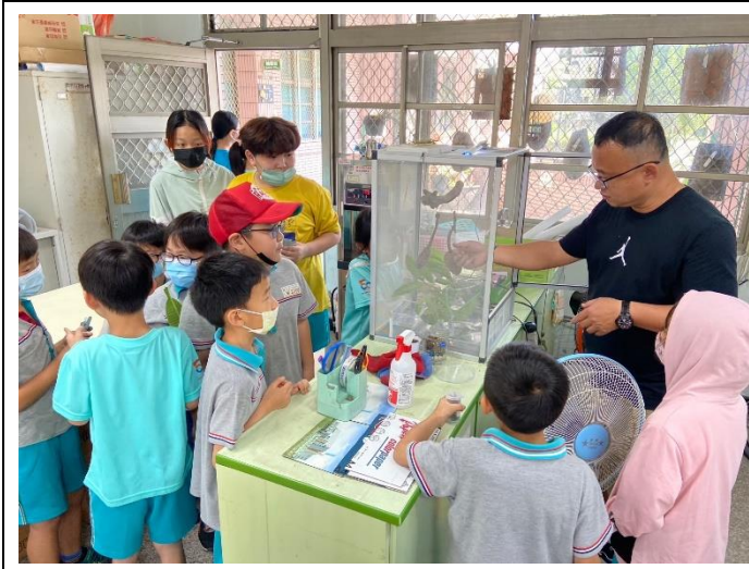
學生爭取好表現照顧竹節蟲