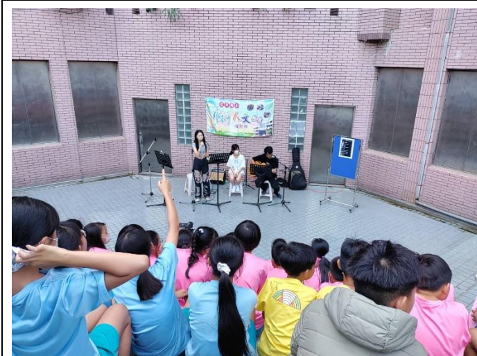
一場小型但熱鬧的音樂會