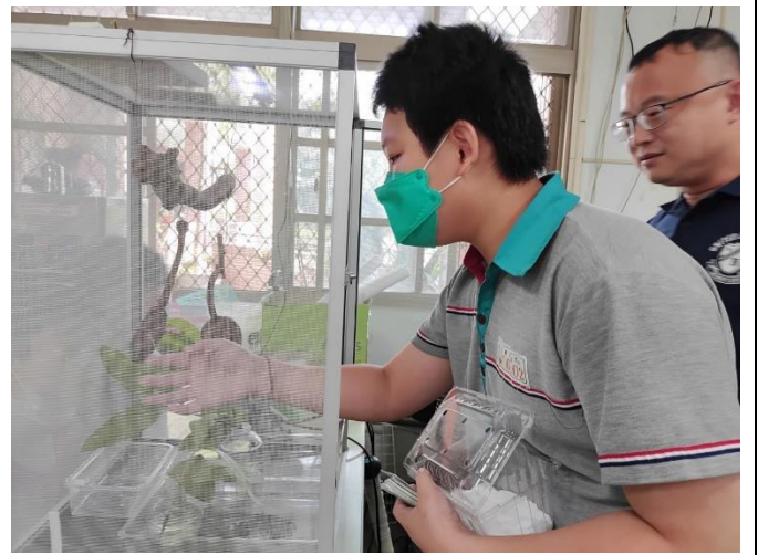
學生爭取好表現照顧竹節蟲