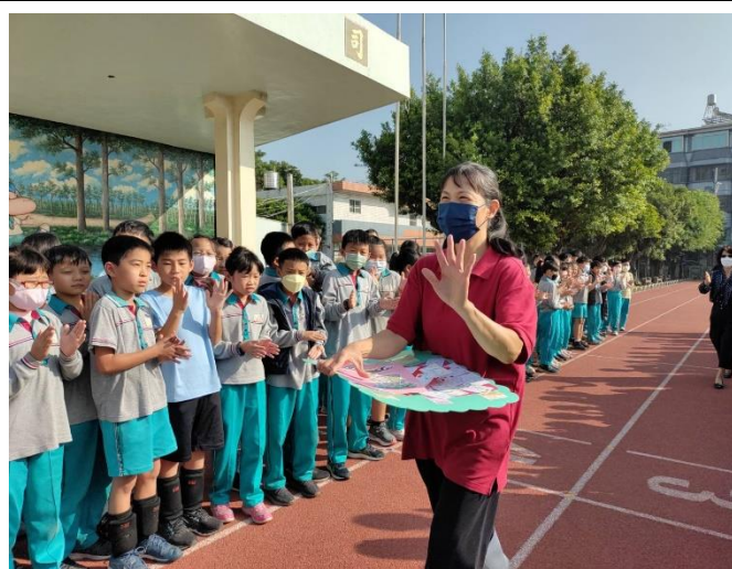
學生列隊歡送謝謝廚工媽媽