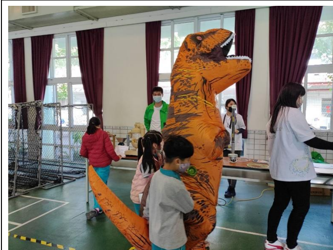
恐龍大使和學生一起參與環境教育