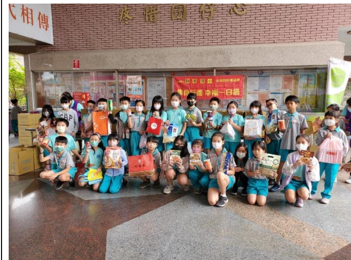
學生熱烈參與捐贈物資