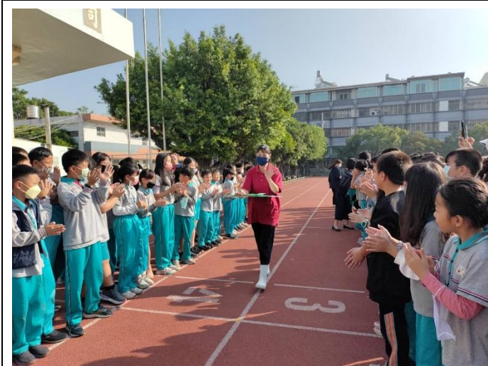
學生列隊歡送謝謝廚工媽媽