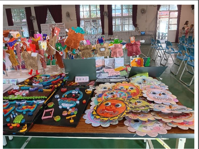
活動中心展出學生的作品