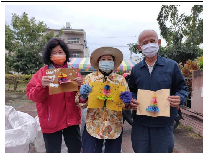
學生送感謝卡給回收志工謝謝他們的辛勞付出