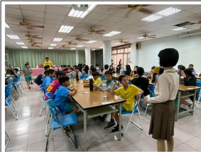
躲避球隊、有氣體操隊、直笛隊慶功宴