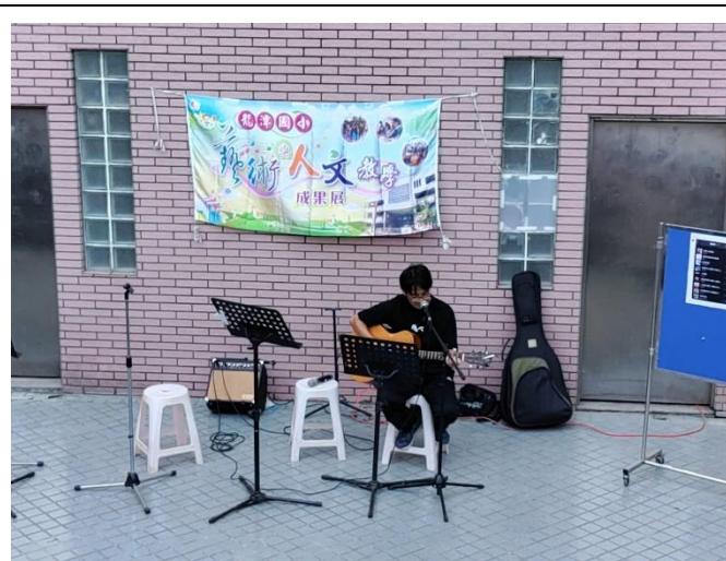
最受歡迎的吉他王子-涂老師吉他演唱