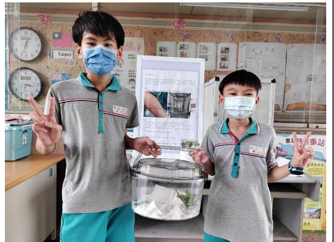
竹節蟲回娘家見面會