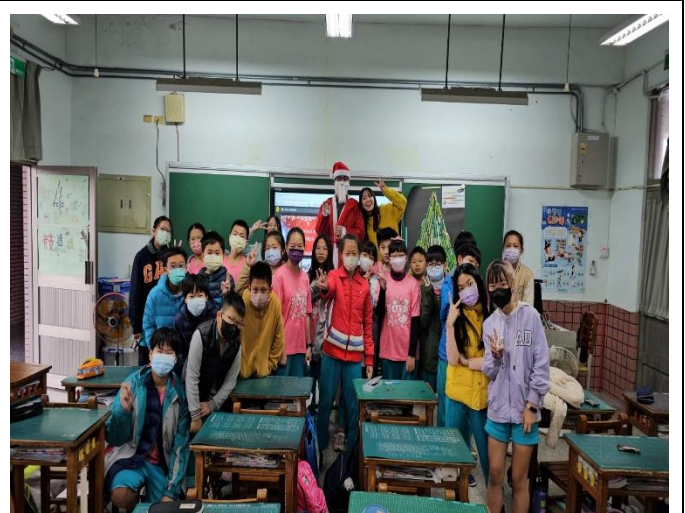
聖誕老公公到各班給聖誕禮物