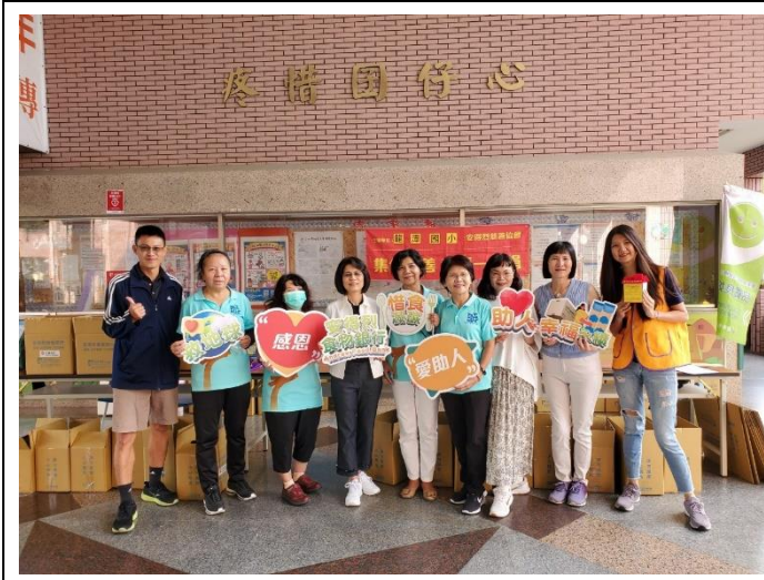
輔導室辦理安德烈一日捐活動