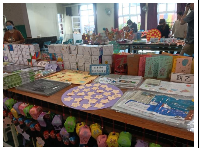
活動中心展出學生的作品