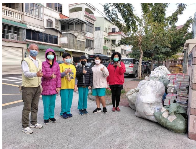
學生和志工一起做回收