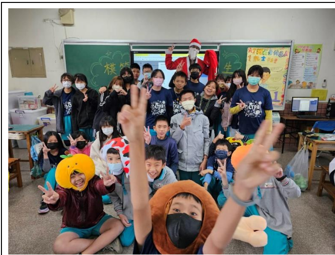
聖誕老公公到各班給聖誕禮物