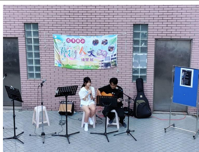
學姊回校與學弟妹同樂