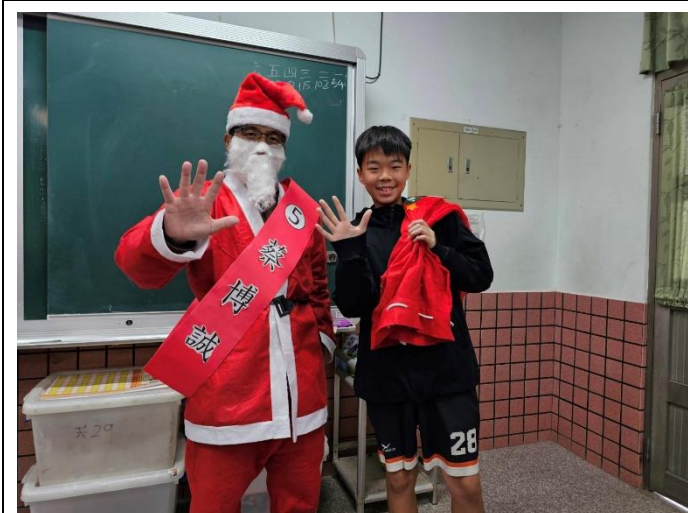
聖誕老公公到各班給聖誕禮物