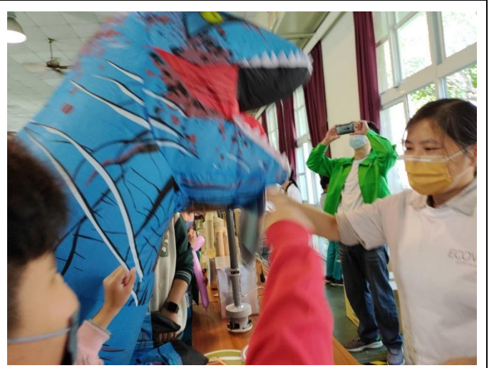
恐龍大使和學生一起參與環境教育