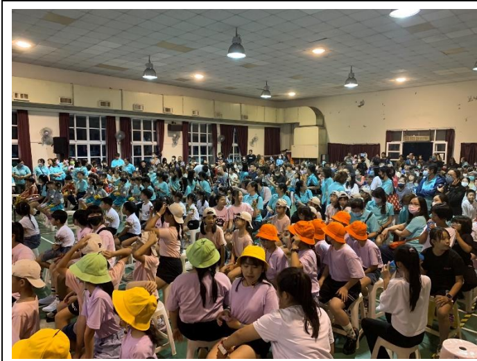
因雨天備案而改在活動中心的動態成果展