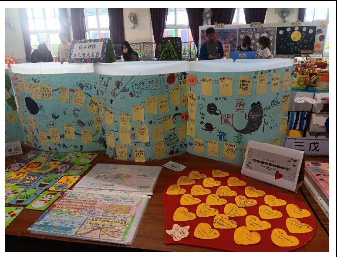
活動中心展出學生的作品