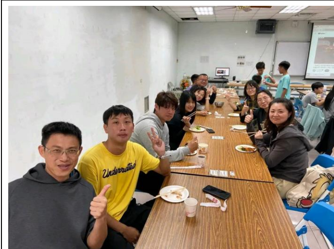
感謝辛苦的老師們