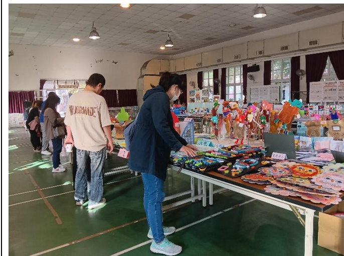
活動中心展出學生的作品