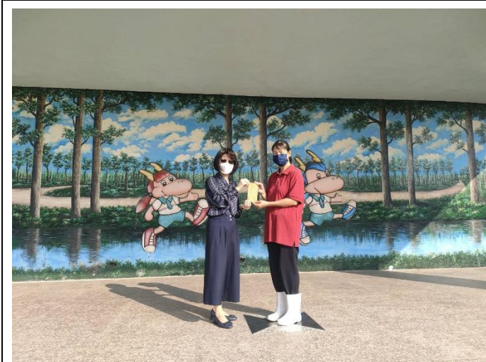
恭喜廚工媽媽榮退