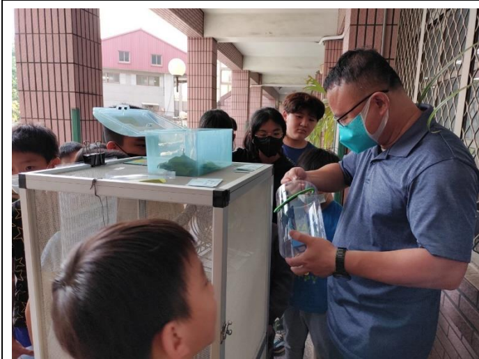
學生爭取好表現照顧竹節蟲