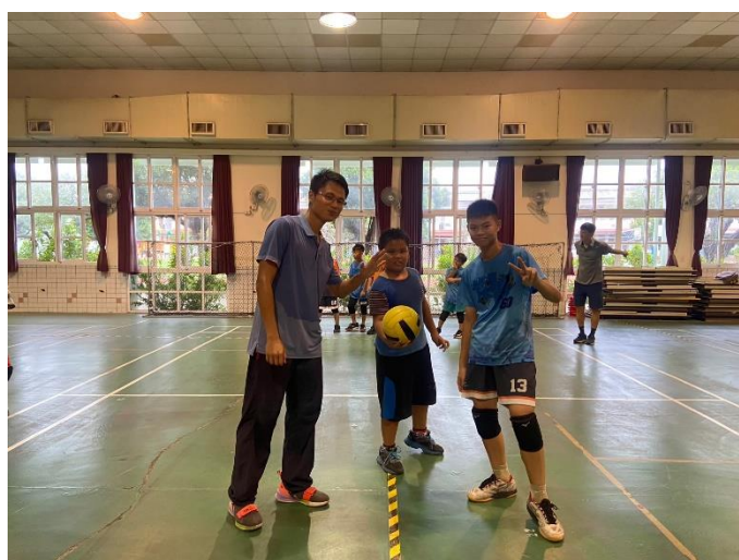
老師與學生進行躲避球 PK 賽