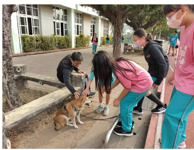
老師和學生友善對待動物