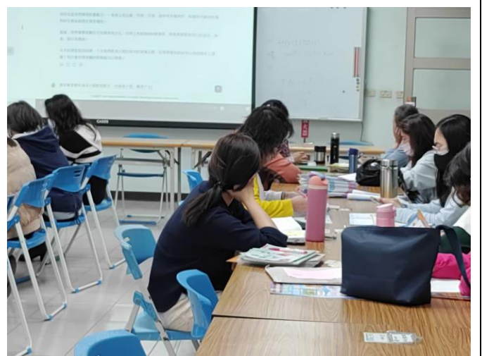
教師在校飲用白開水