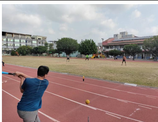
老師與學生進行樂樂棒運動