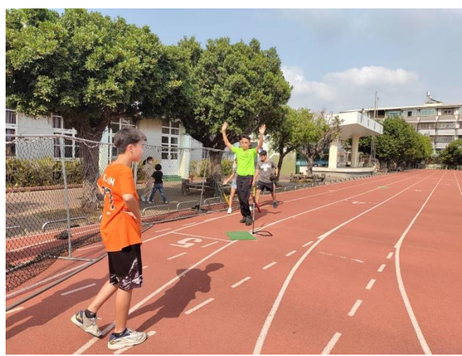
老師與學生進行樂樂棒運動