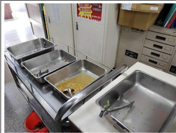
辦公室用餐無廚餘