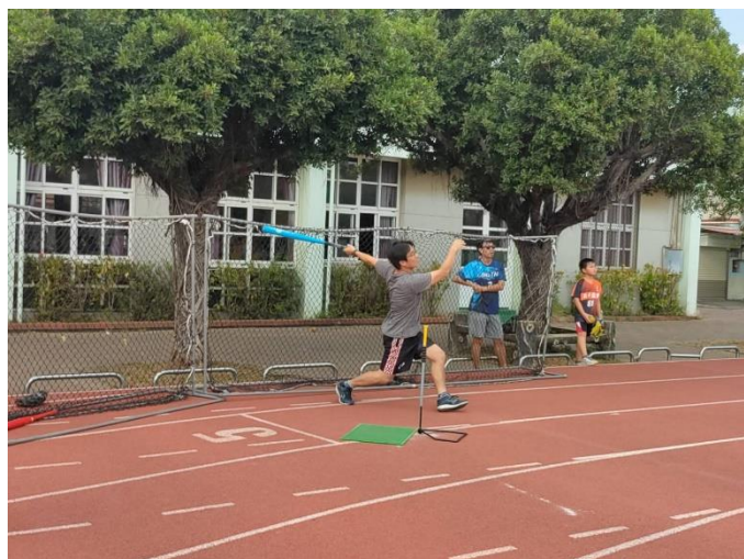
老師與學生進行樂樂棒運動