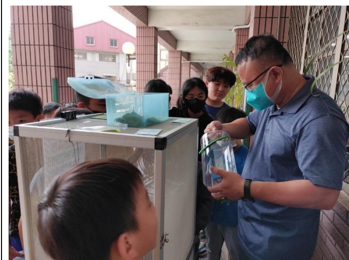
三張龍龍榮譽卡認養竹節蟲活動