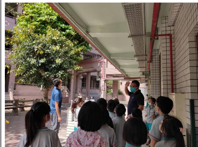
主任帶學生觀察校園鳥類