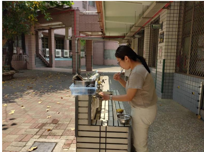
導師午餐後潔牙,是學生最好的學習楷模