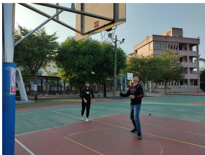
教師放學後進行體育活動