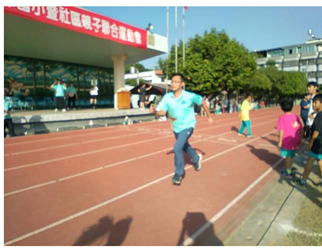
教師參加運動會大隊接力