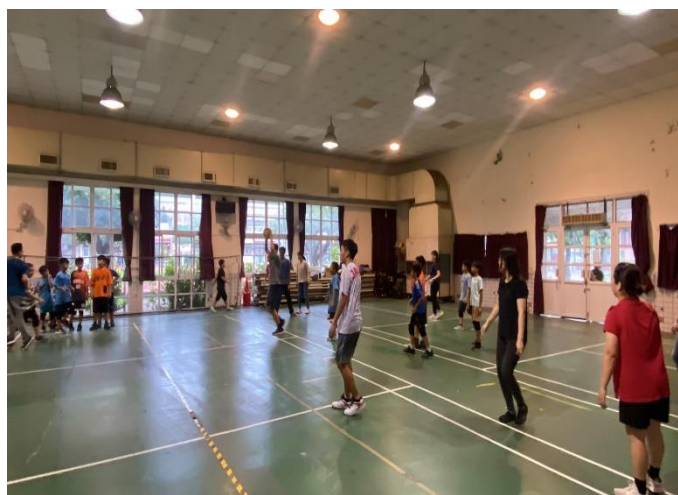
老師與學生進行躲避球 PK 賽