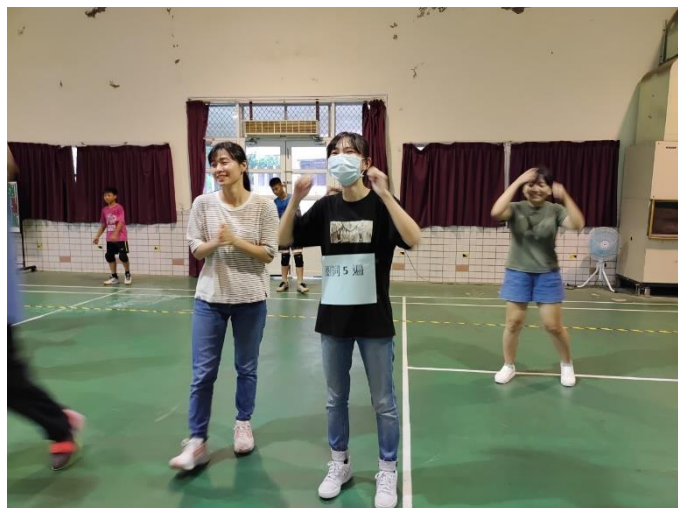
老師與學生進行躲避球 PK 賽