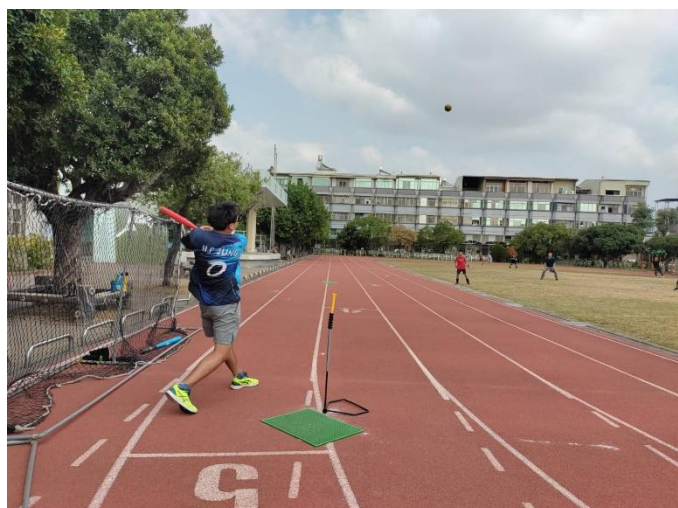
老師與學生進行樂樂棒運動