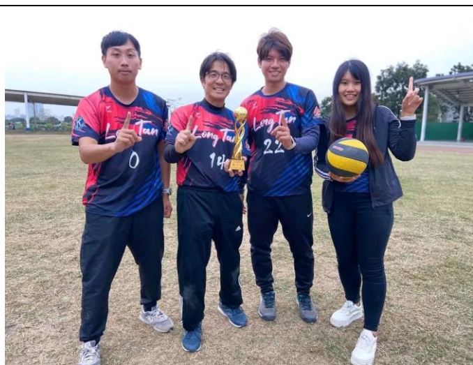
愛運動的老師是學生最好的楷模