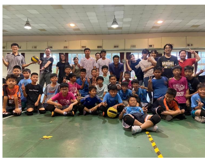
老師與學生進行躲避球 PK 賽