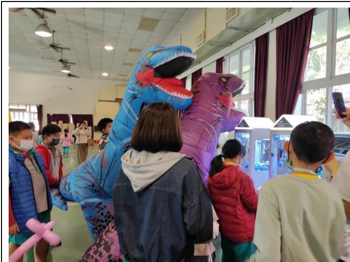
教師扮裝恐龍大使參與環境教育