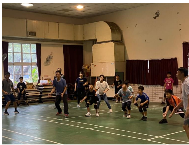
老師與學生進行躲避球 PK 賽