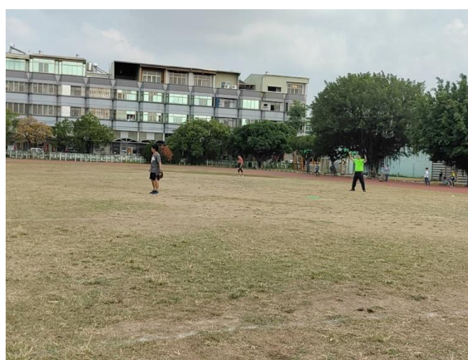
老師與學生進行樂樂棒運動