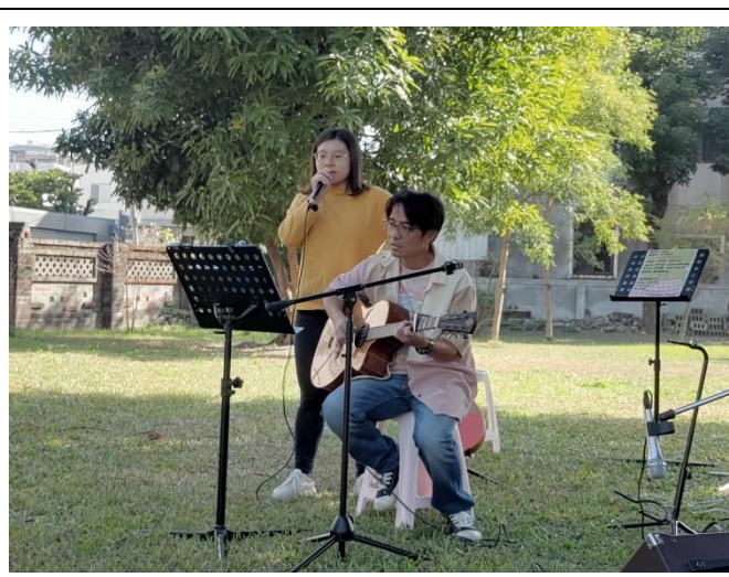
教師參與草地野餐音樂會演出