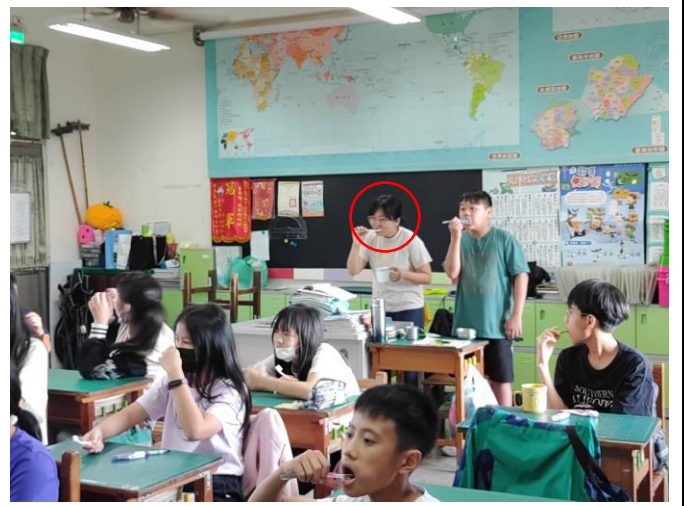
導師與學生一起學習潔牙,以身示範是最好的學習榜樣