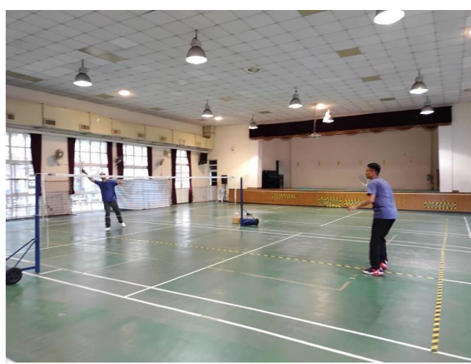
教師放學後進行體育活動