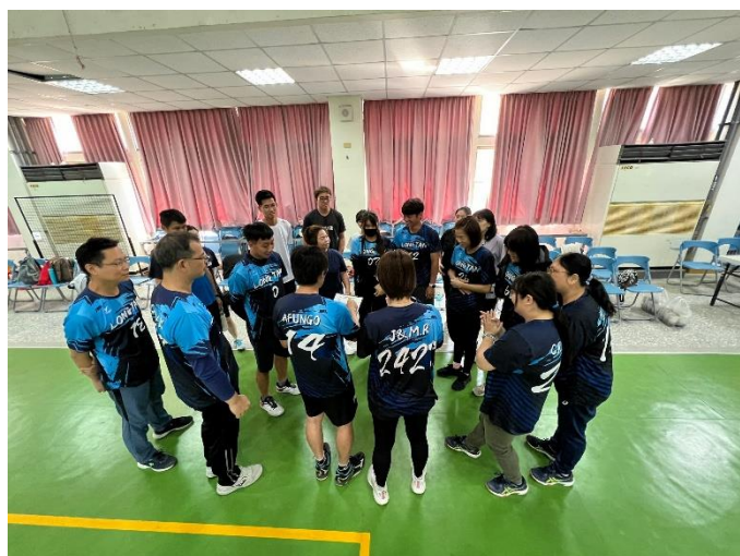
教師成立躲避球隊