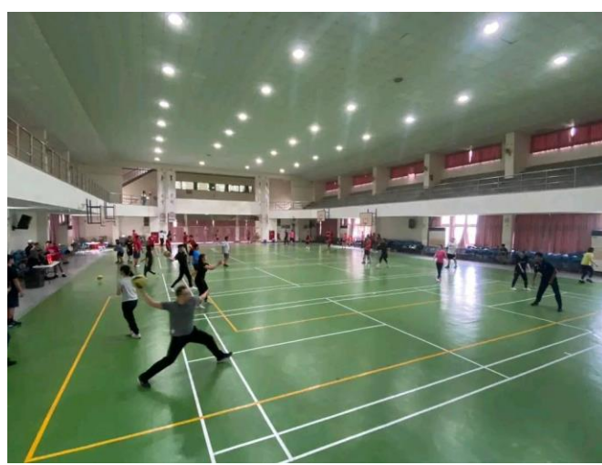
教師參與躲避球賽