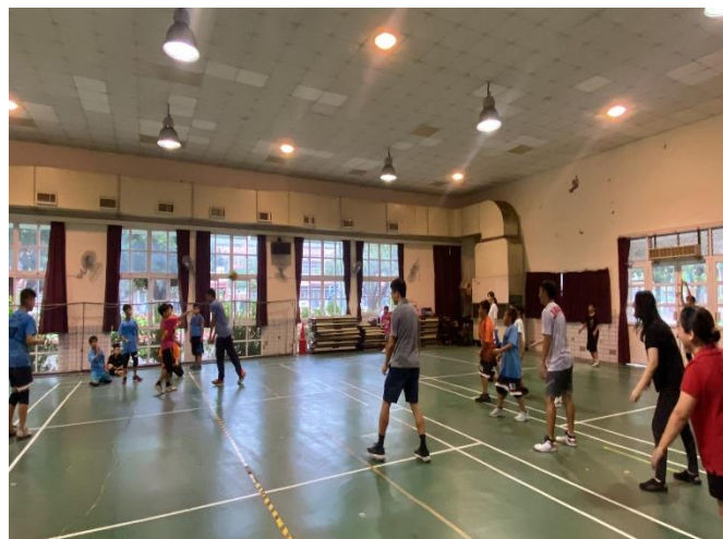
老師與學生進行躲避球 PK 賽