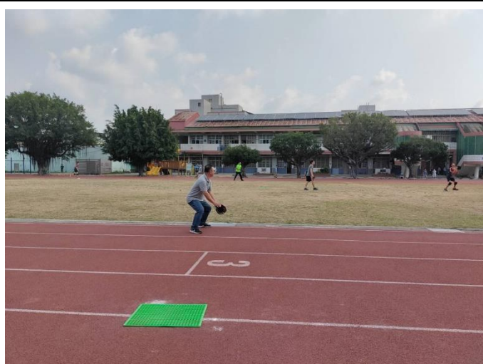
老師與學生進行樂樂棒運動