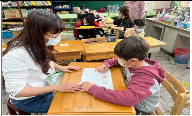
讓孩子練習撕貼，訓練精細動作及複習課業。