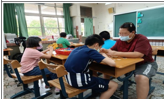
生活課積木實作，作統合訓練。