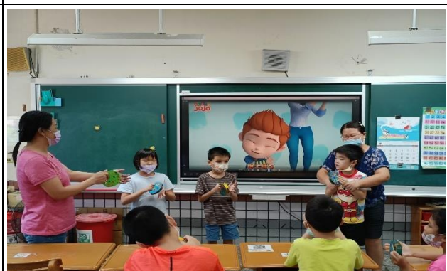
唱唱跳跳，讓孩子跟著音樂影片一起活動筋骨。