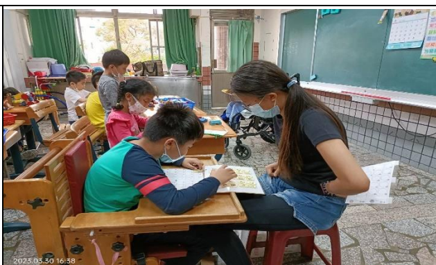
複習學期課堂所學，加深孩子學習印象。