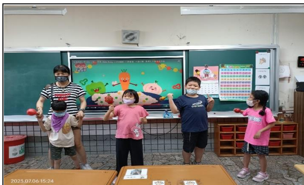
節奏律動，透過音樂律動訓練孩音感，伸展肢體。