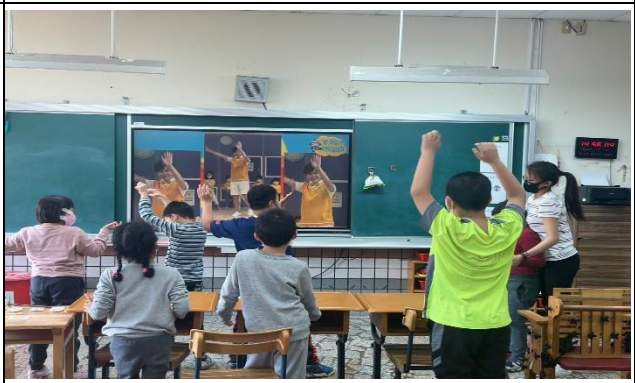
唱歌帶動跳，讓孩子跟著歌曲影片一起唱跳活動。