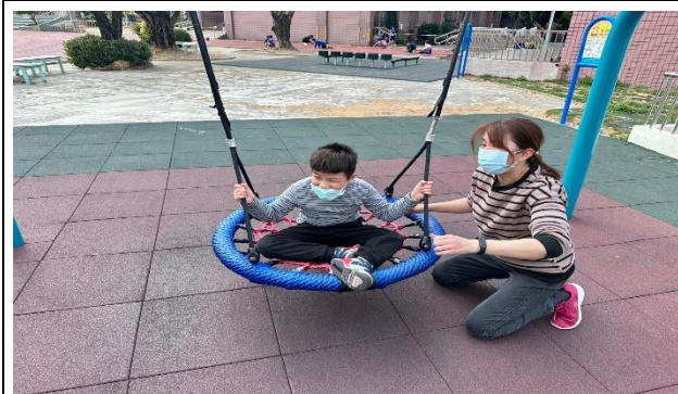
帶孩子到戶外遊戲場運動，訓練體能及安全教育指導。