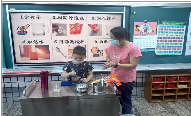
生活課程學習沖泡飲品，訓練生活技能。