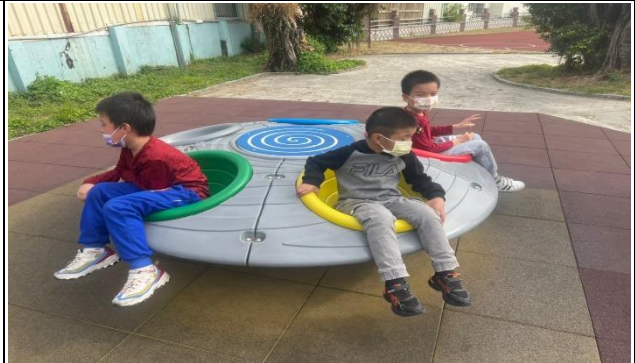
透過戶外運動讓孩子訓練大肌肉，放鬆身心。