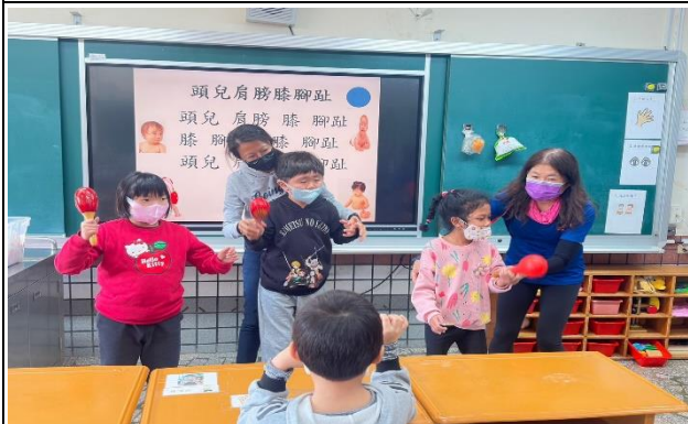
音樂欣賞，學習基本音樂節奏。