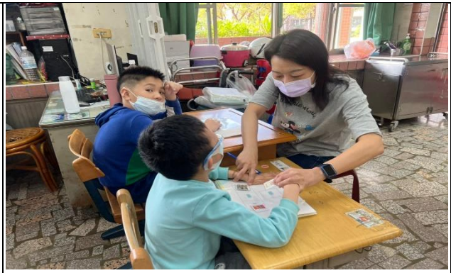
複習學期課堂所學，加深學生學習印象。