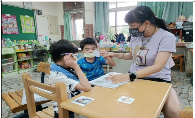
讓孩子學習圖片配對，訓練表達能力及精細動作。