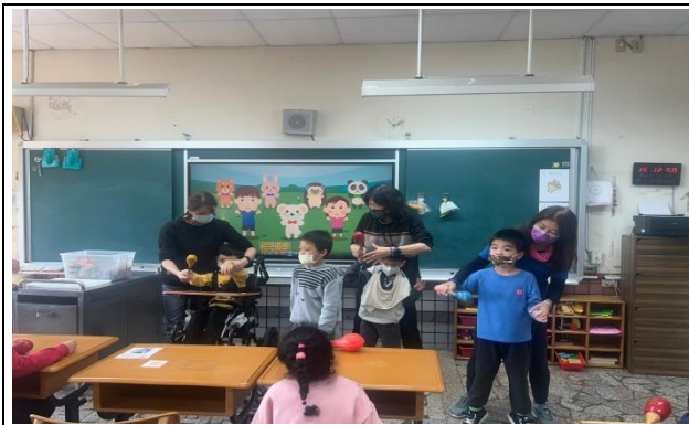
歌唱律動～透過歌唱律動，伸展肢體運動一下。