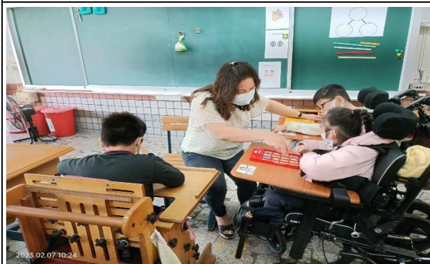
透過拼貼作業，激發學生創意及訓練小肌肉