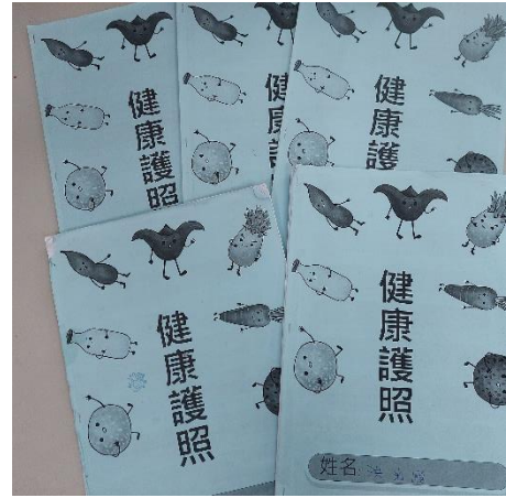
說明：健康護照能有效管理學生個人健康狀況