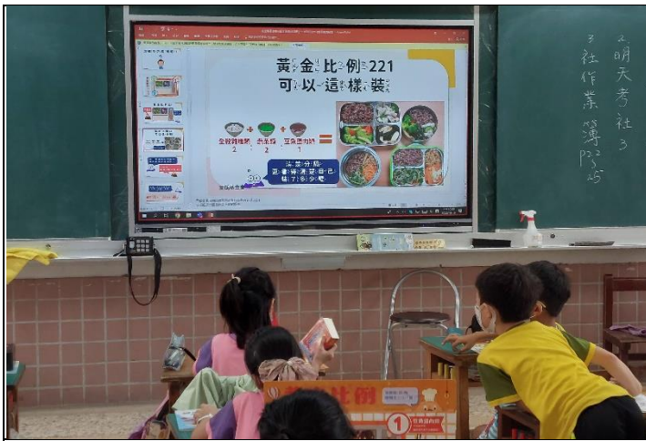
說明：健康飲食教學，讓學生了解如何健康飲食