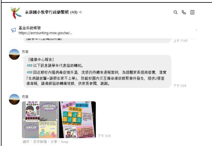
說明：利用 LINE 請導師宣導健康促進訊息