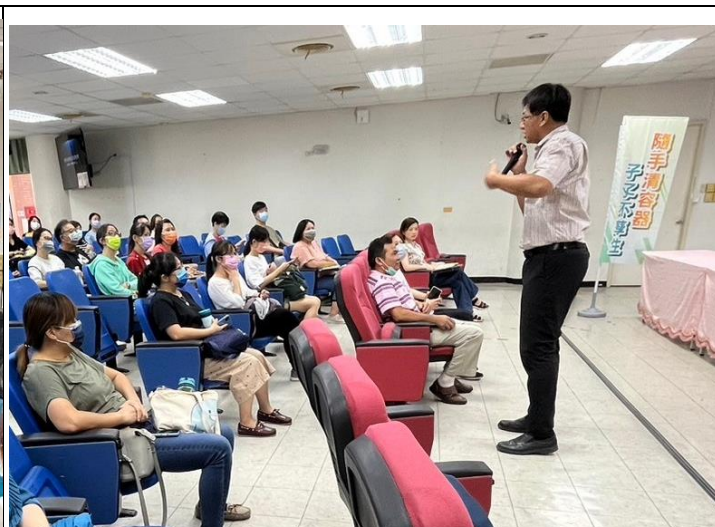
說明：校長利用家長座談機會，加強宣導健康概念