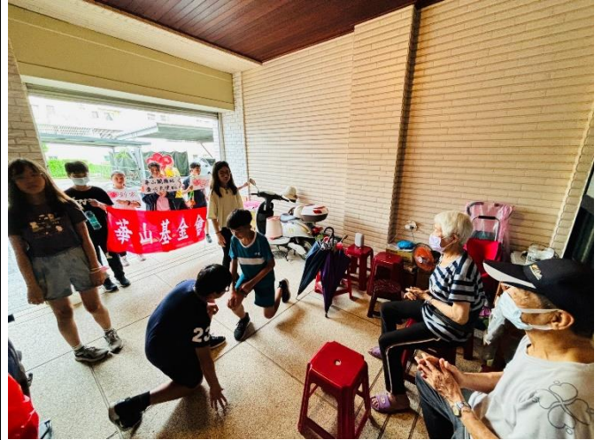
表演才藝獻給社區獨居長輩