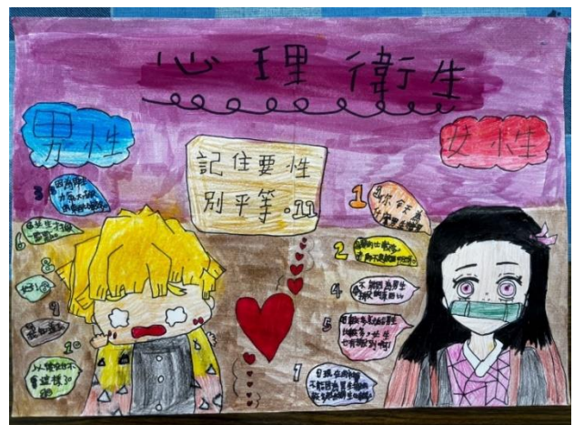
性別平等議題繪畫比賽