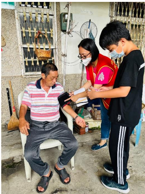
關懷社區獨居長輩