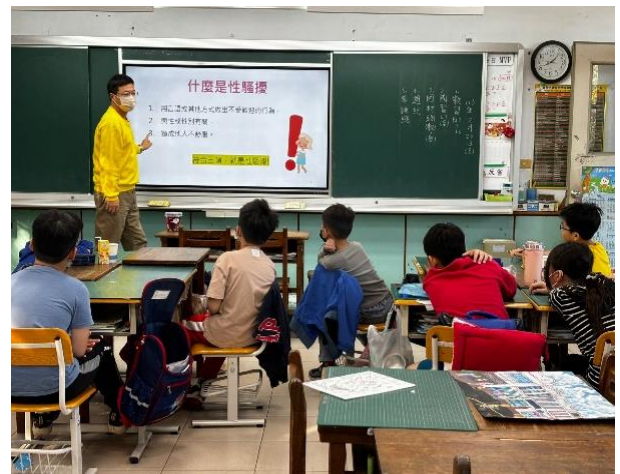
性別平等入班宣導