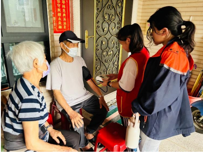
幫忙社區獨居長輩量血壓