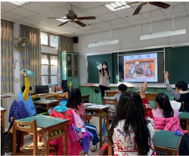
性別平等繪本教學