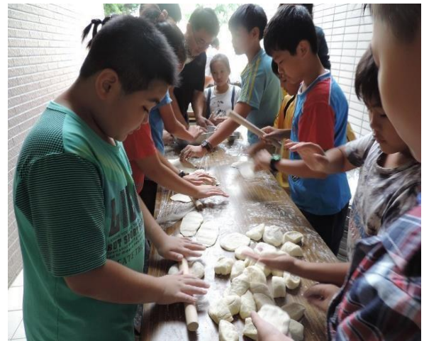
學生親手揉製麵糰