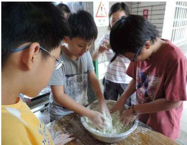
學生親手揉製麵粉