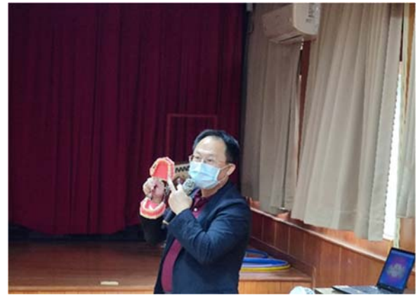
示範正確刷牙方式