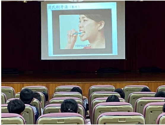
學習正確刷牙的方法