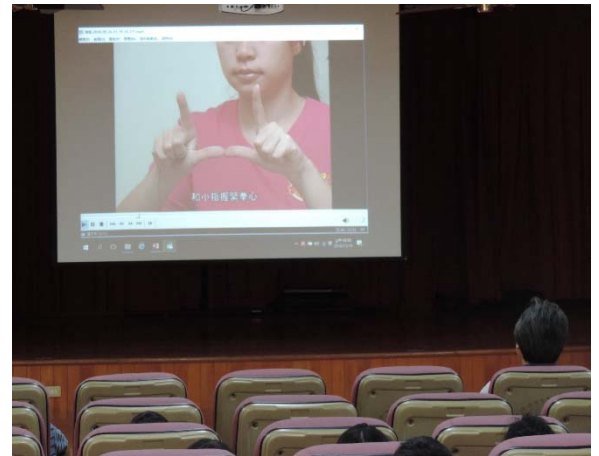
示範正確使用牙線