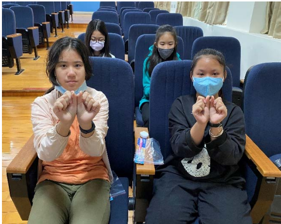
學習正確牙線的方法