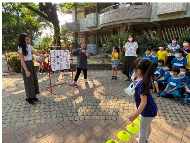
辦理健促議題視力保健趣味活動