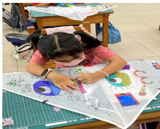
視力保健議題融入美術課程