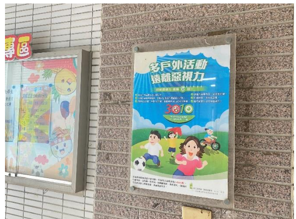
校園張貼視力保健海報宣導