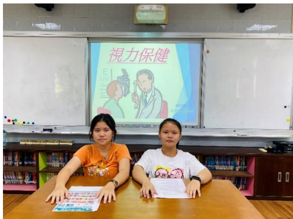
深坑報馬仔宣導視力保健之重要