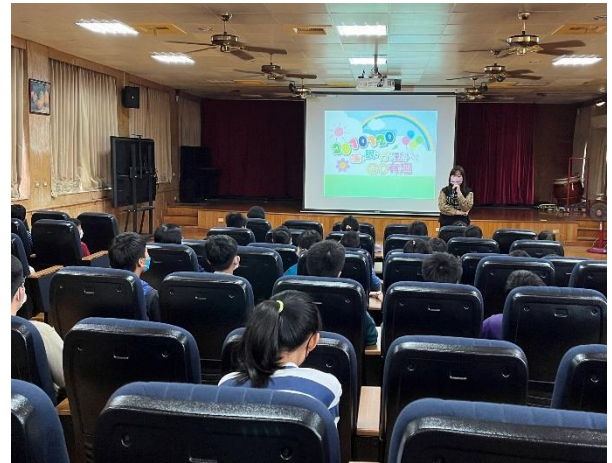
護理師教導視力保健課程