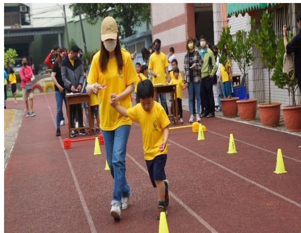
辦理健促議題親子闖關活動/視在必得