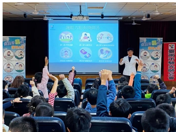
視力保健護眼六招宣導有獎徵答