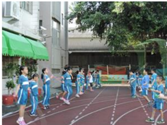
全校課間跳繩運動