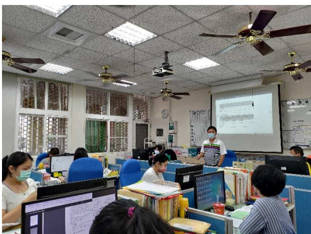
校長報告健促年度計畫主推視力保健議題