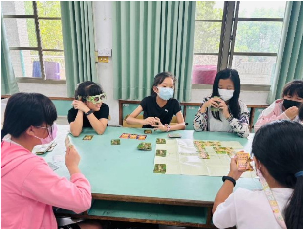
搶救迷糊眼鏡猴護眼桌遊活動