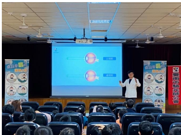
邀請臺南市驗光師公會宣講視力保健