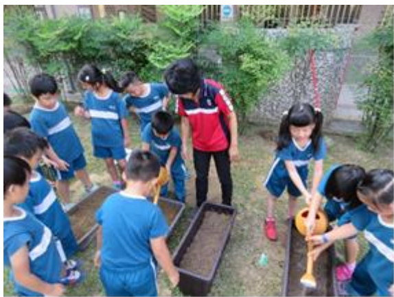
學生參與植栽校園綠美化