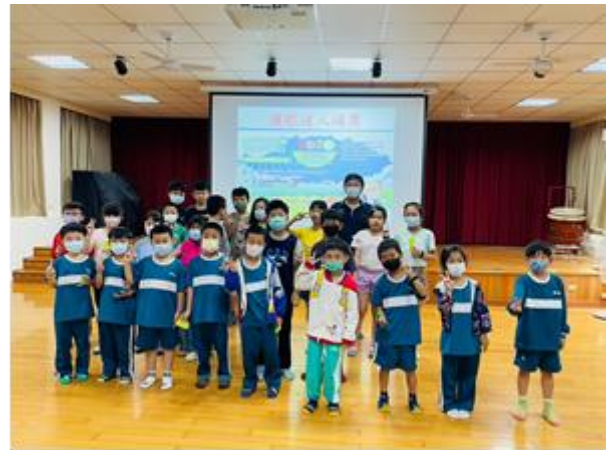
護眼日誌完成連線/護眼達人頒獎