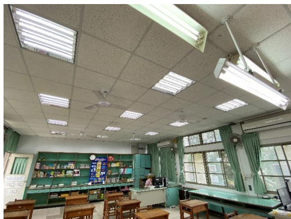
教室全面改用 LED 燈光照明