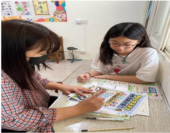
護理師個別教導高度近視學生視力保健