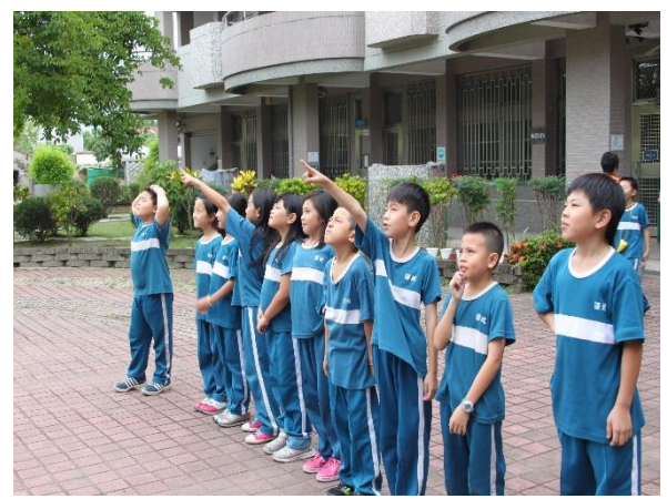
班級下課時間望遠凝視