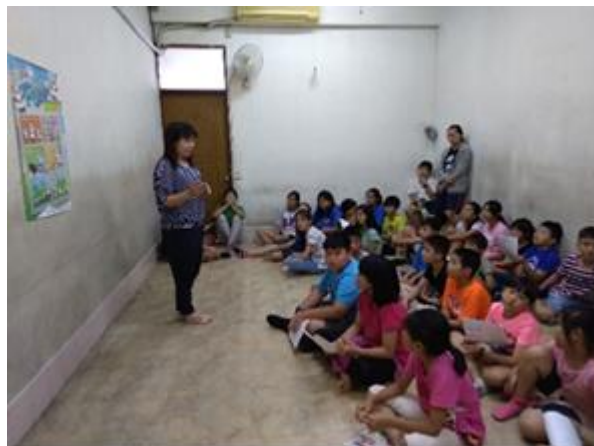
護理師到安親課輔補習班視力保健宣導