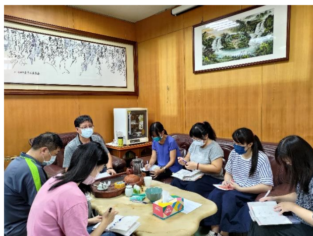
健促行政團隊定期召開會議討論