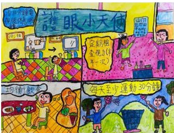
辦理健促議題視力保健繪畫比賽