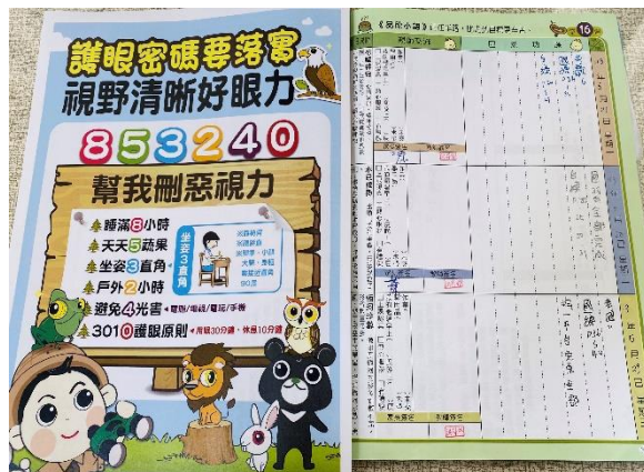
連絡簿張貼視力保健知識宣導