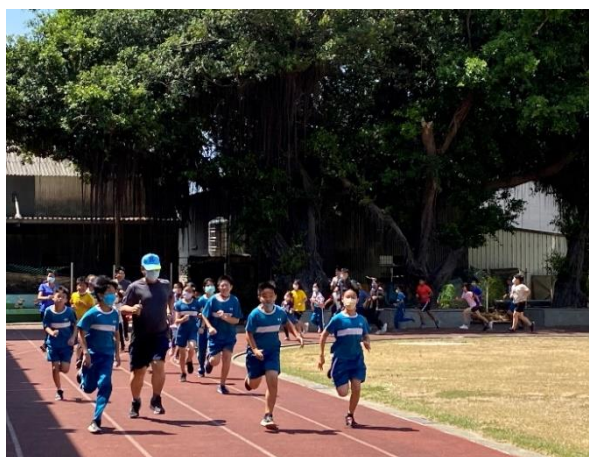
全校晨間師生跑步運動