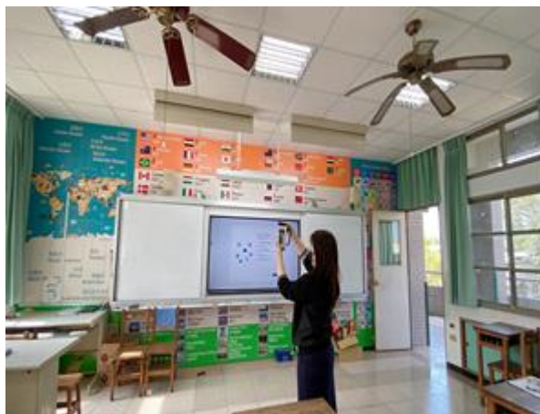
每學期教室定期測光檢測