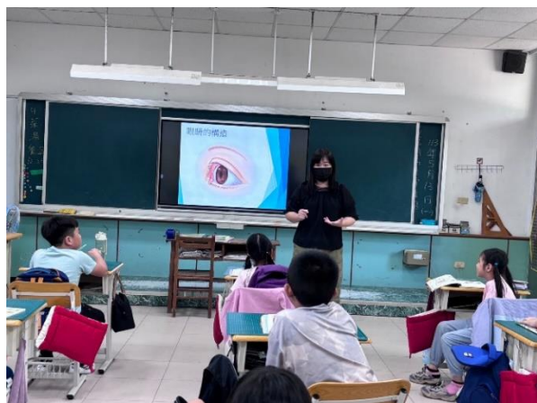
視力保健議題融入教學課程