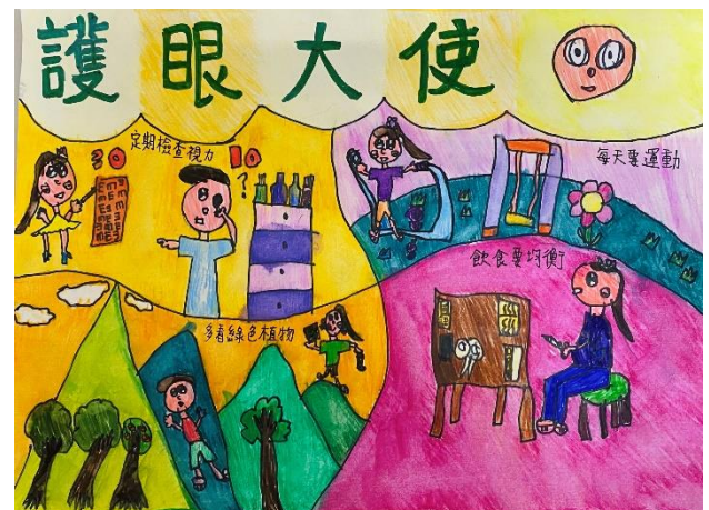
辦理健促議題視力保健繪畫比賽