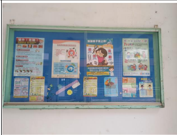
說明：公佈欄提供民眾健康資訊