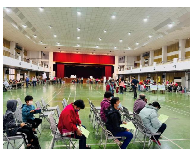
說明：活動中心提供社區健檢場地