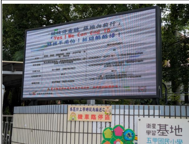
說明：健康知識推廣服務