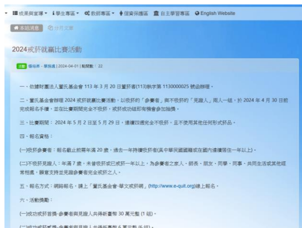
說明：戒菸活動推廣