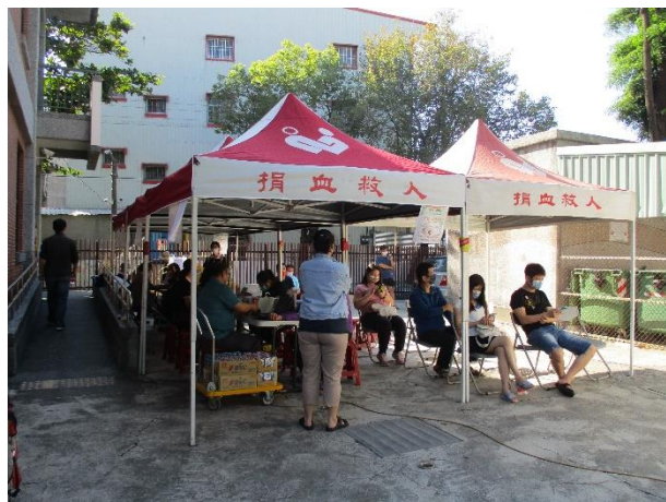
說明：配合活動舉辦捐血服務