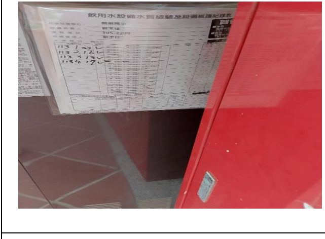
說明：飲用水定期檢查