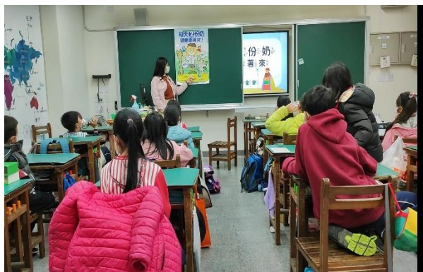
說明：老師利用課程飲食紅綠燈推廣