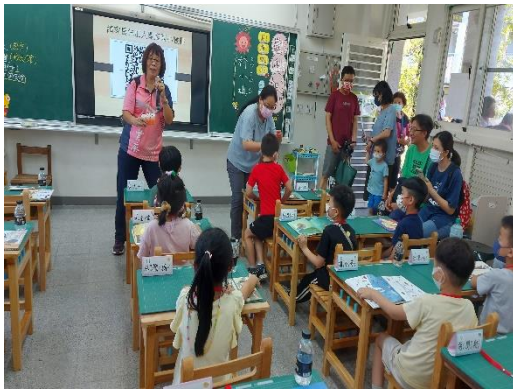
說明：新生及家長口腔保健宣導