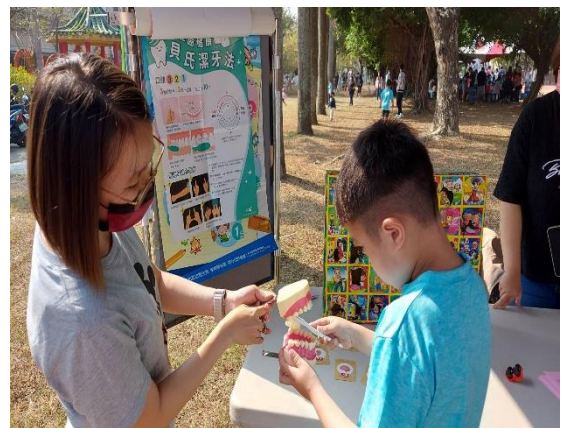
說明：運動會親子貝氏刷牙闖關