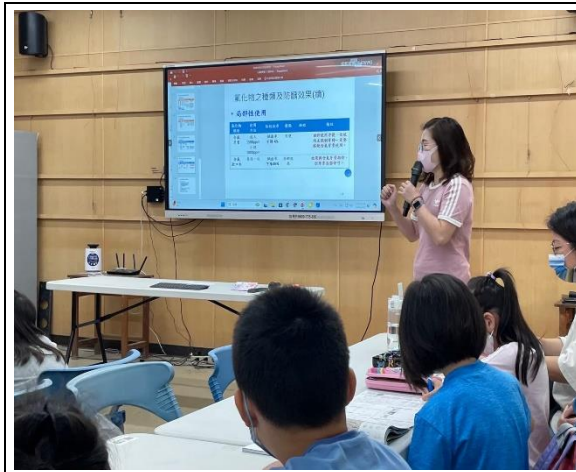
說明：口腔含氟牙膏親職講座