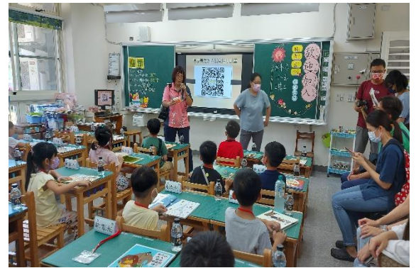
說明：新生及家長口腔保健宣導