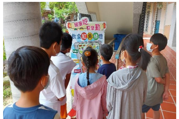
說明：飲食紅綠燈推廣