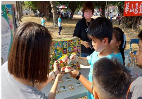
說明：運動會親子貝氏刷牙闖關