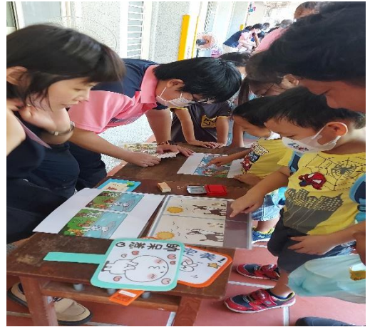
說明：視力保健新生及家長闖關