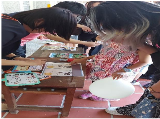
說明：視力保健新生及家長闖關