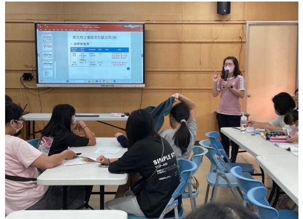
說明：口腔保親職講座