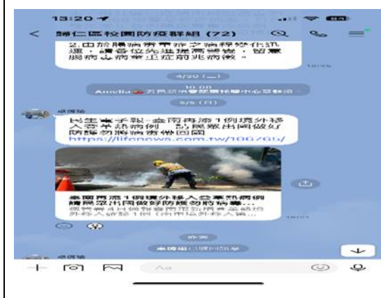
說明：登革熱防治資訊。