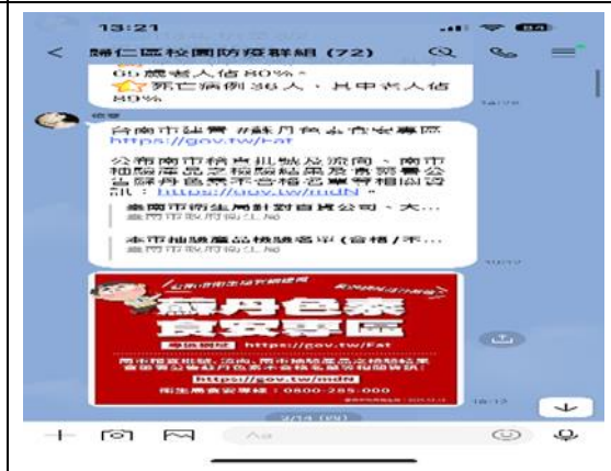
說明：蘇丹色素資訊。