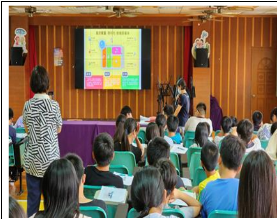
說明：營養教育宣導。