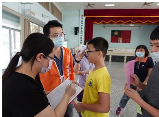
說明：班級落實 5 分鐘餐前教育。