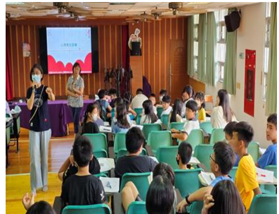
說明：心理衛生宣導。