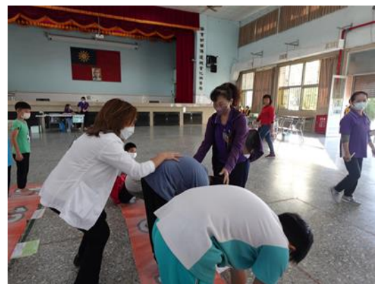
說明：脊柱側彎檢查。