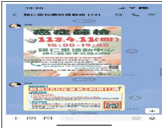
說明：學生聚精會神參與比賽。