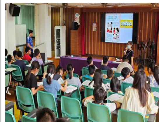
說明：正確洗手宣導。