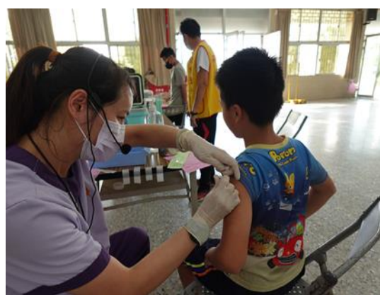
說明：體適能與飲食教育活動成果填報。