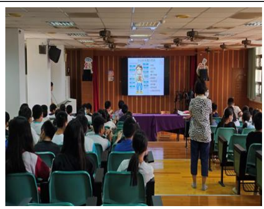
說明：菸害問題宣導。