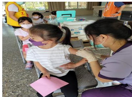
說明：推動游泳教學課程。