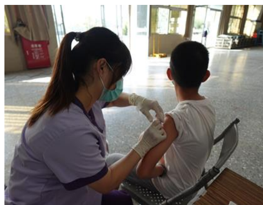
說明：健康學習護照。