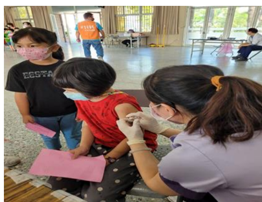
說明：落實低碳教育。