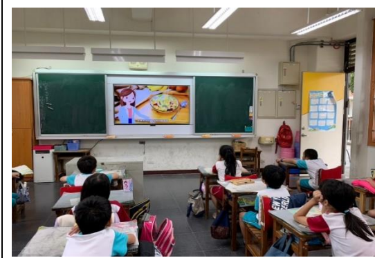
說明：一年級餐前五分鐘營養教育。