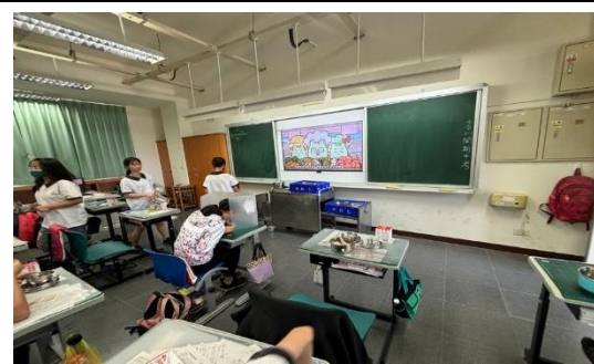
說明：六年級餐前五分鐘營養教育。