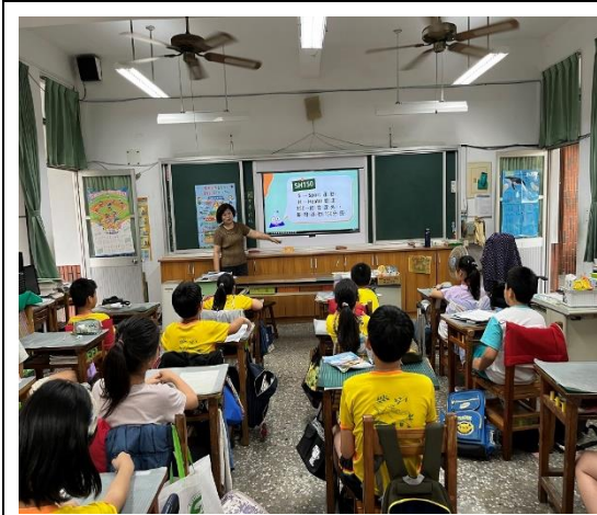
說明：四甲老師協助宣導吃運動的重要性。