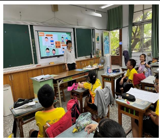
說明：四乙老師協助宣導運動的好處。