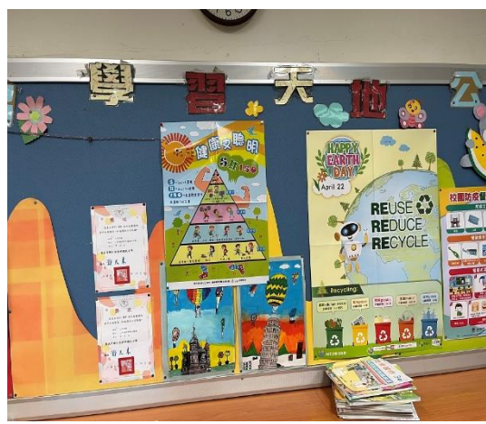
說明：三甲老師協助宣導均衡飲食的重要性。