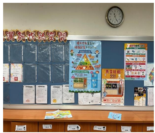
說明：三乙老師協助宣導健康飲食的好處。