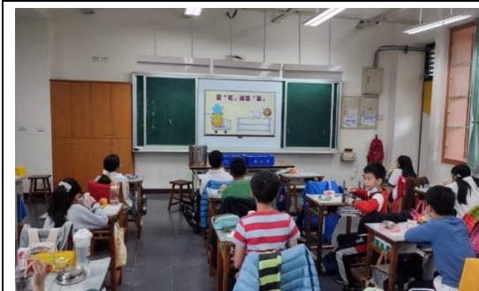
說明：五年級餐前五分鐘營養教育。