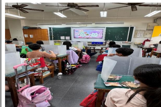
說明：三年級餐前五分鐘營養教育。