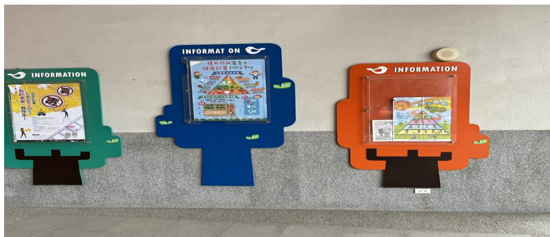
說明：宣導海報置放於學校中央走廊，讓各年級都能吸收到相關知識。