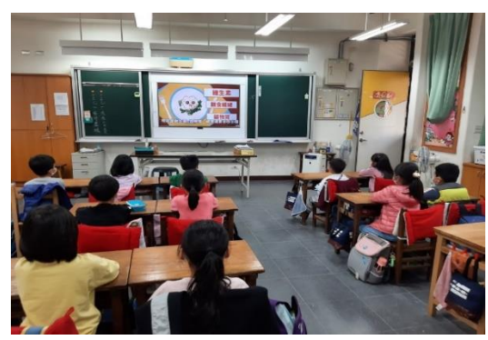
說明：二年級餐前五分鐘營養教育。