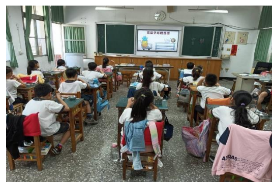
說明：四年級餐前五分鐘營養教育。