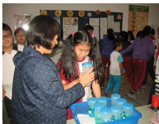
說明：潔牙小天使領取班級漱口水。