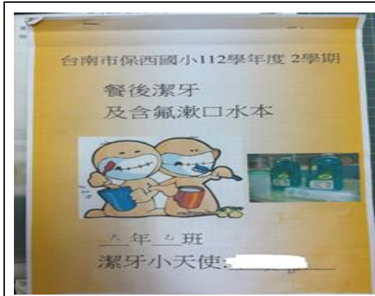
說明：班級潔牙紀錄本。