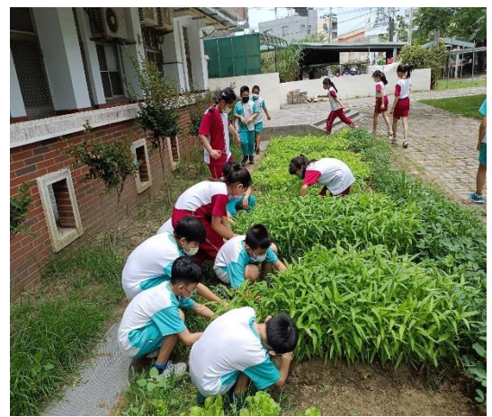
說明：學生協助拔除害蟲。