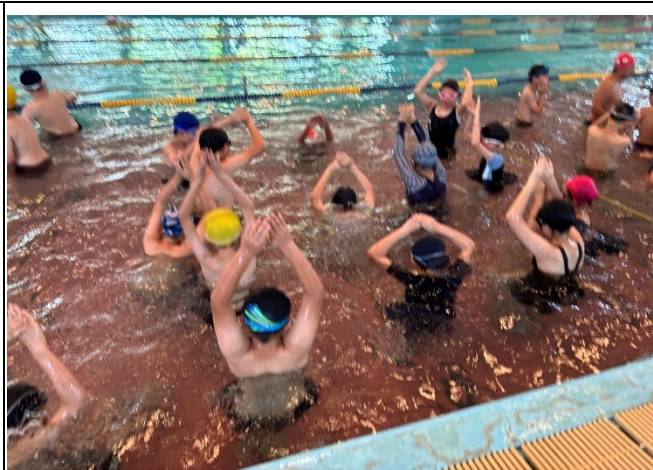
說明：有氣呼吸練習。