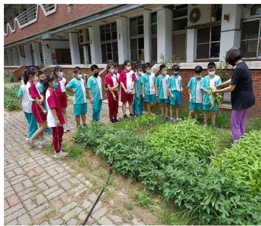
說明：班級輪流照護菜苗。