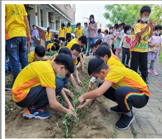
說明：學生親手栽種菜苗。