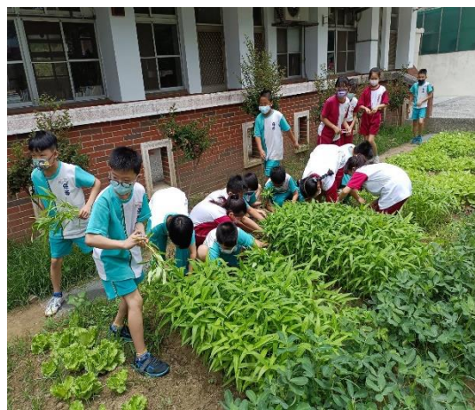
說明：學生親自參與採收過程。