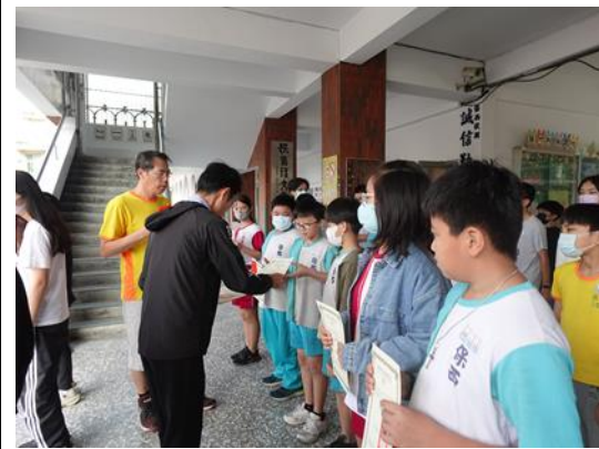
說明：潔牙小天使頒獎。