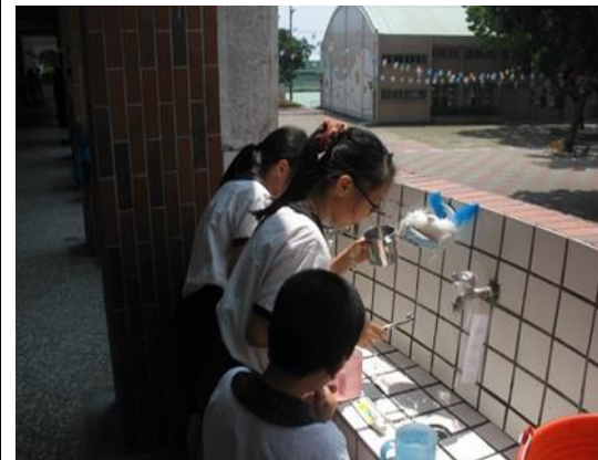
說明：潔牙小天使督促班級學生落實潔牙。