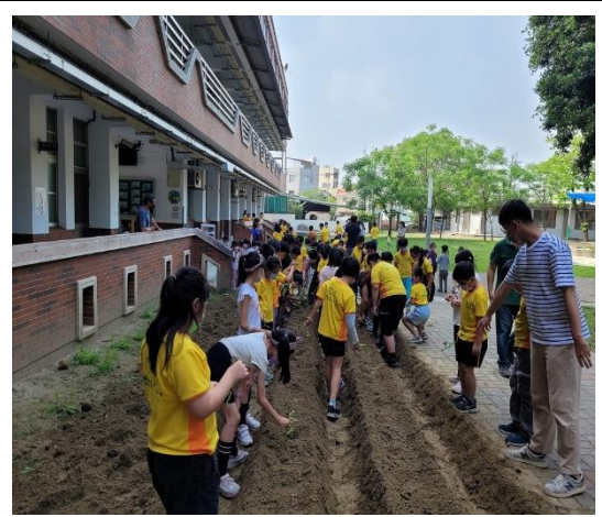
說明：學生親手栽種菜苗。