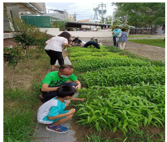
說明：老師適時給予機會教育。