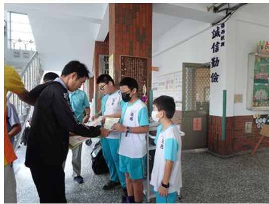
說明：潔牙小天使頒獎。