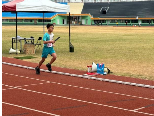
說明：第一棒學生蓄勢待發。