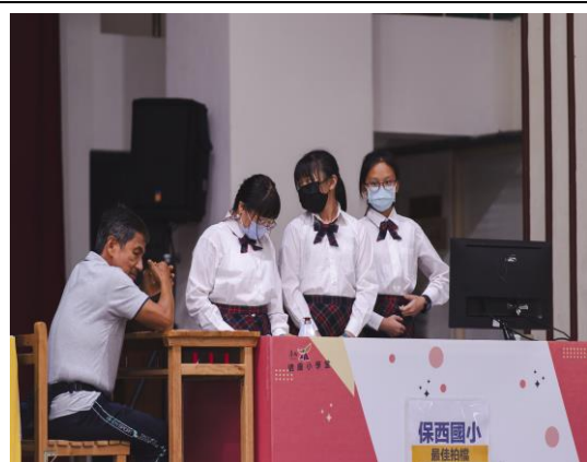
說明：學生聚精會神參與比賽。