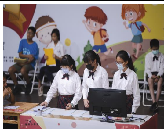
說明：學生聚精會神參與比賽。