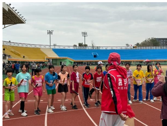
說明：學生們比賽前充滿信心。