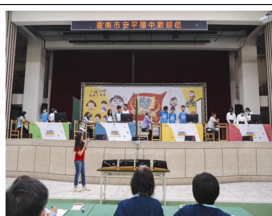
說明：學生聚精會神參與比賽。