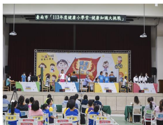
說明：學生聚精會神參與比賽。