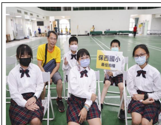
說明：最佳默契團隊。