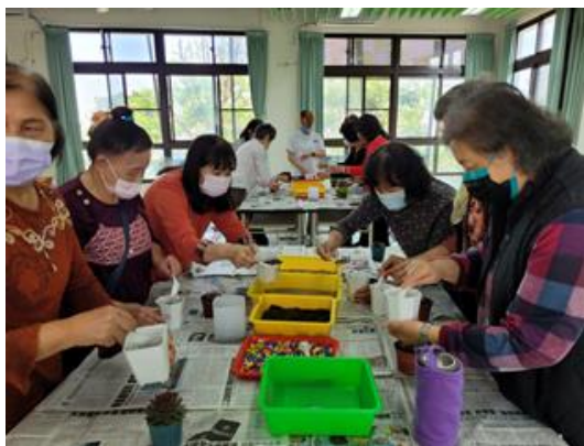
說明：結合樂齡中心活動宣導正向心理健康。