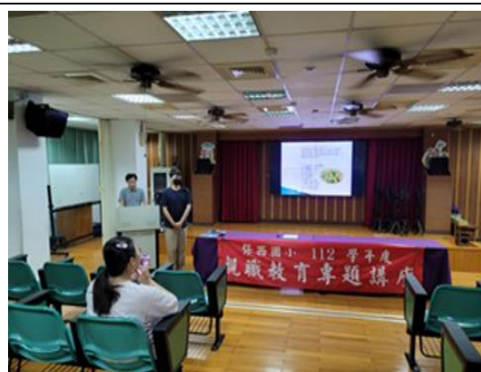
說明：營養教育宣導。