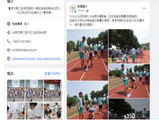
說明：利用 FB 提供健促相關訊息。