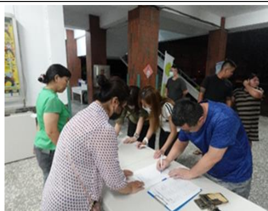
說明：家長和老師們踴躍出席。