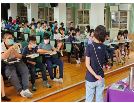
說明：結合歸仁區衛生所宣導衛教宣導。