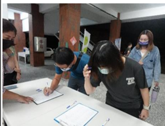
說明：家長和老師們踴躍出席。