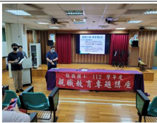
說明：視力保健宣導。