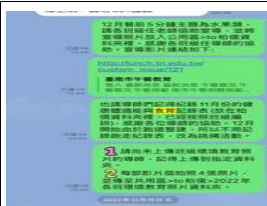
說明：利用 Line 提供健促相關訊息。