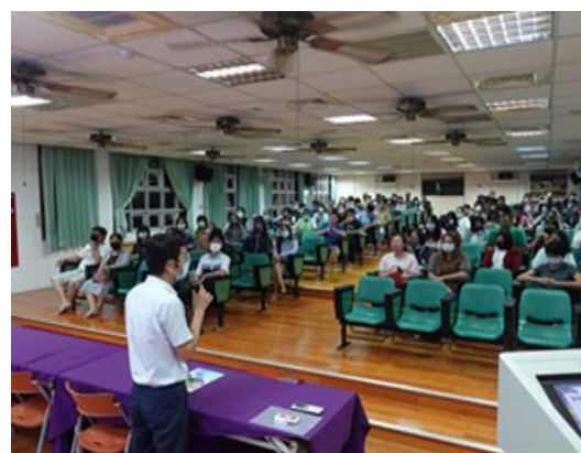
說明：校長說明健促相關知識的重要性。