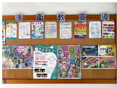
不定期更新各項議題、活動宣導