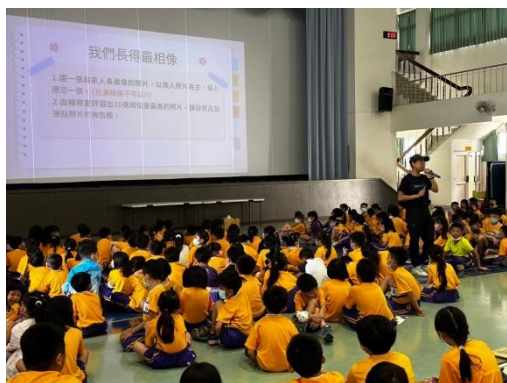
活動二 我們長得最相像