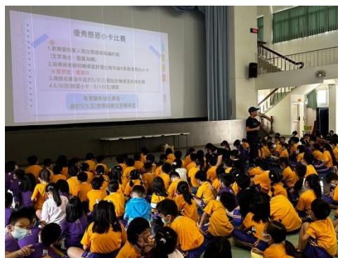
活動一 優秀感恩小卡徵選