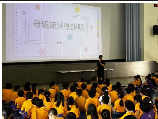
輔導室舉辦母親節感恩活動