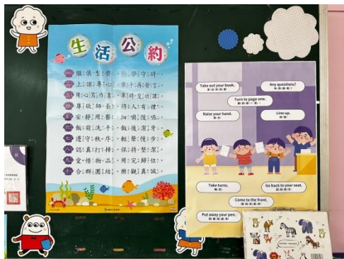
班級張貼生活公約與課室英語海報