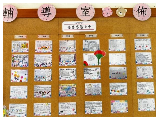
透過感恩小卡表達感謝與陶冶品格