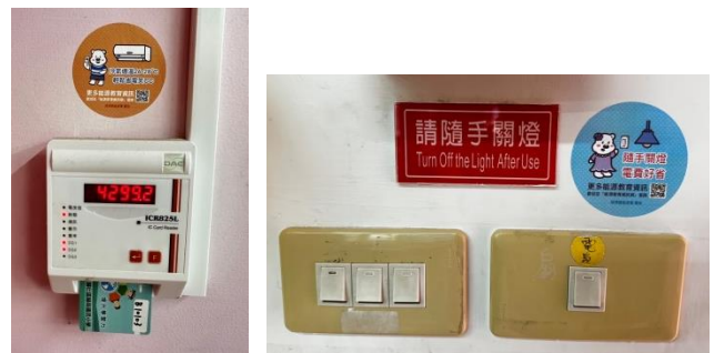
節能標章貼於開關附近之能源情境佈置