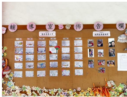
各項佳作展示於輔導室佈告欄