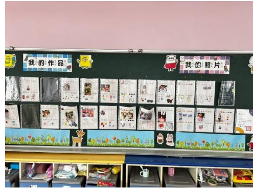
以學習單佈置教室，也讓學生觀摩欣賞