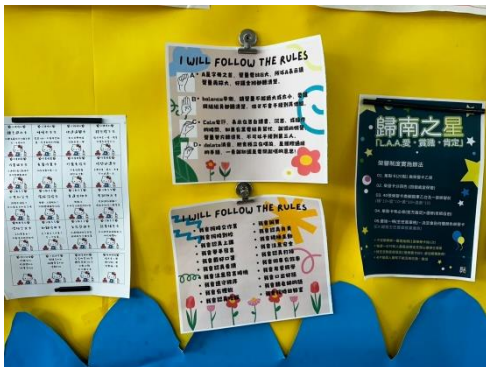
班級獎勵制度之班級經營佈置