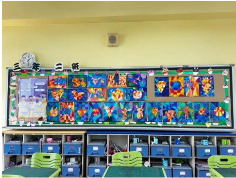
學生美術作品美化教室