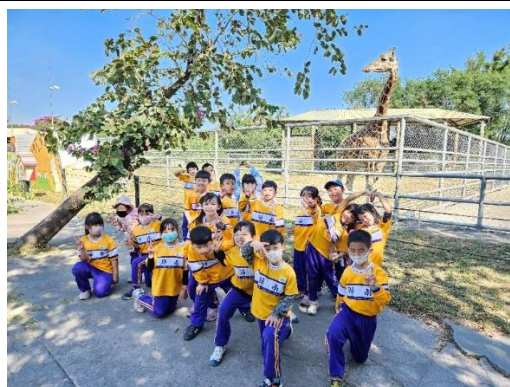
認識與觀察非洲動物