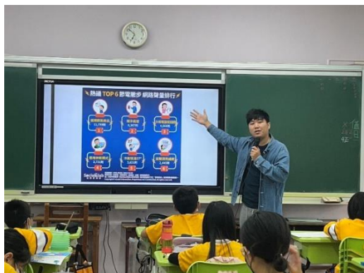
教師於課堂中宣導節能之重要與妙招