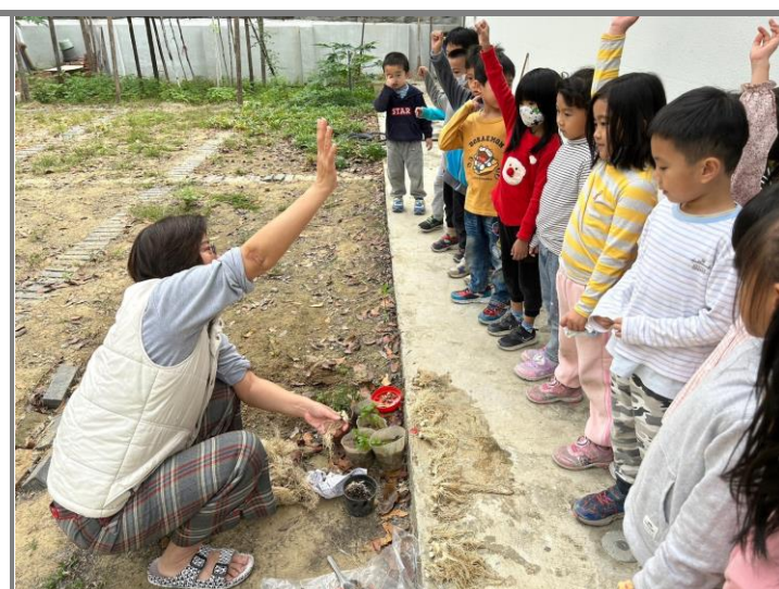
願意回家嘗試種植，小朋友踴躍舉手