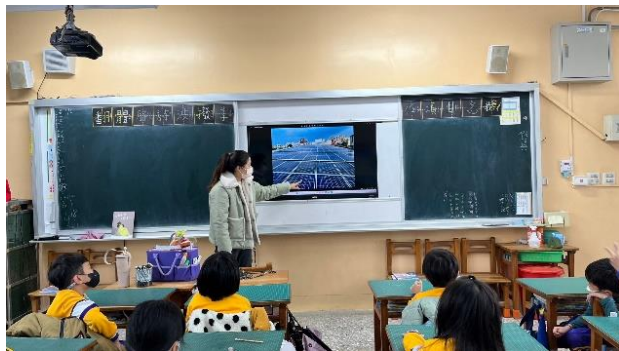
老師介紹校內的再生能源設施