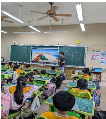
說明：教師講解海洋教育經驗分享