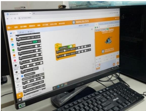
由學生實際操作軟體設計程式