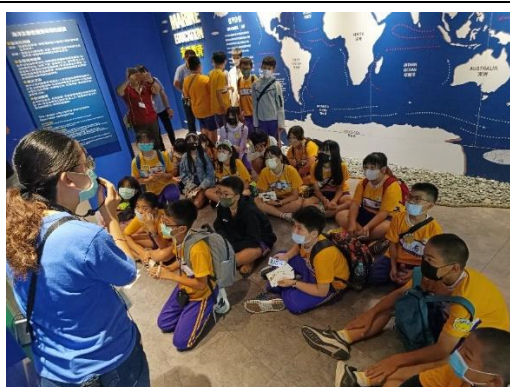
漁樂碼頭導覽員為學生進行海洋教育