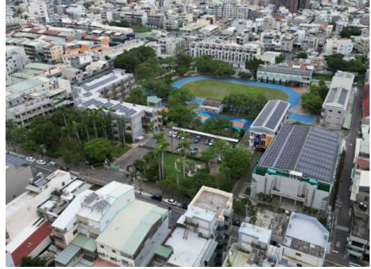
太陽能屋頂—全景圖