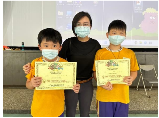
課程回饋後學生獲得博物館證書