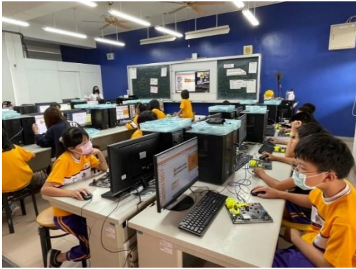
教師指導學生程式設計基礎概念