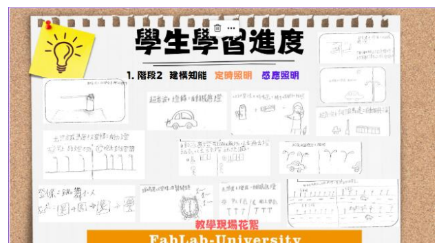
思考將定時/感應照明設計 應用於生活中各項節能設施