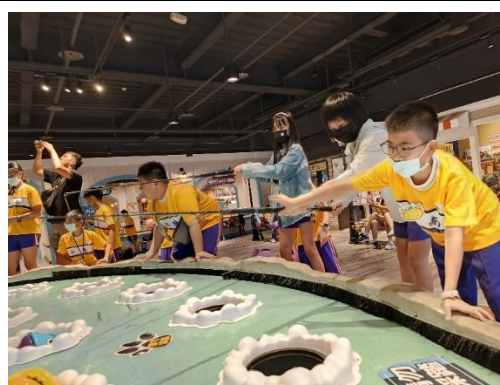
認識海洋產業活動