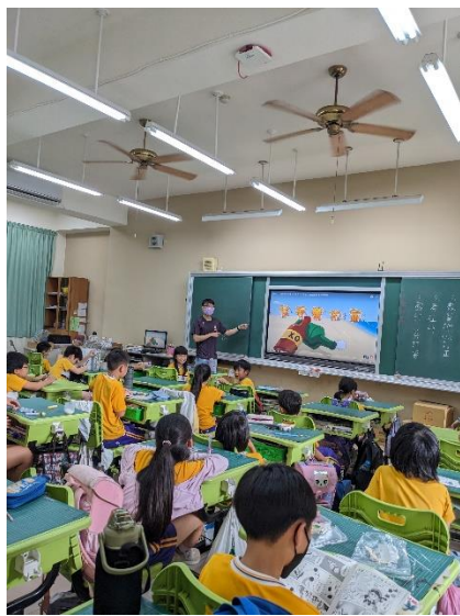
說明：教師講解海洋與環境