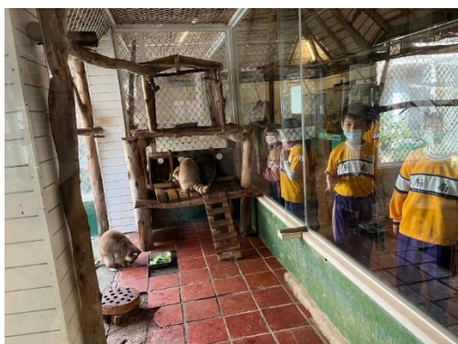
學生實地到動物園觀察動物