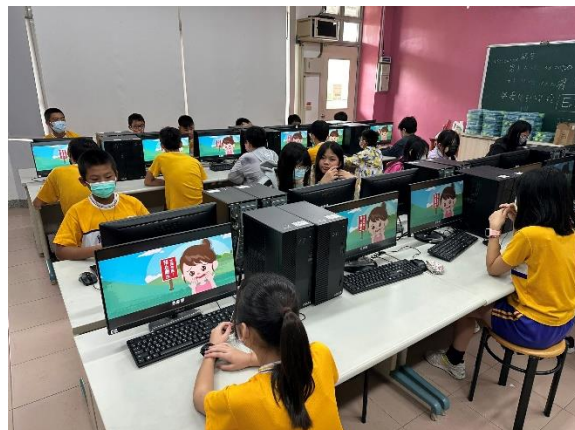
說明:救溺安全宣導 2