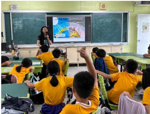
邀請荒野協會講師入班倡導氣候行動