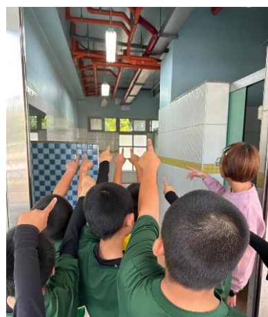
學生實地看察感應照明之設置與用途