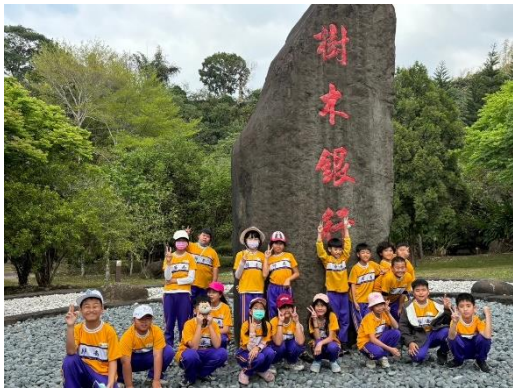
學生到樹木銀行認識植物生態