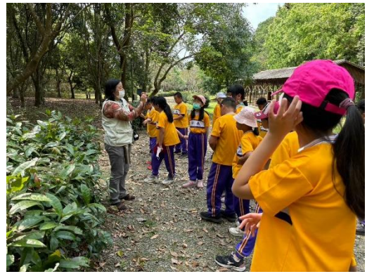
導覽員帶學生撿拾與洗無患子