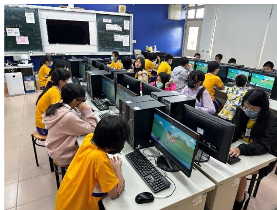
說明: 救溺安全宣導 4