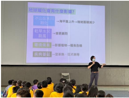
邀請樹谷生活館講師探討氣候變遷