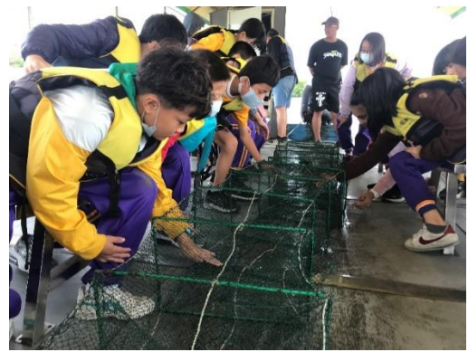
學生體驗捕魚方式