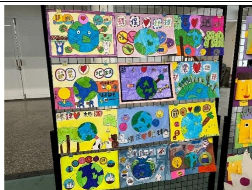
作品於校慶運動會靜態展中展示