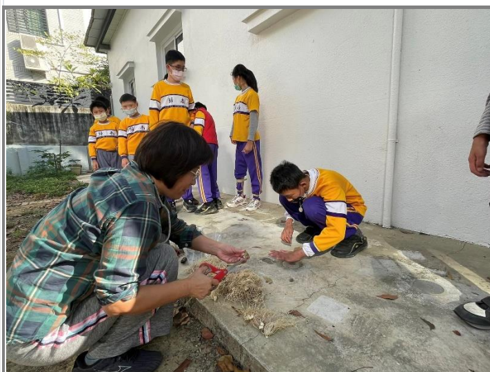
天使班小朋友觀看營養師如何種植青蔥