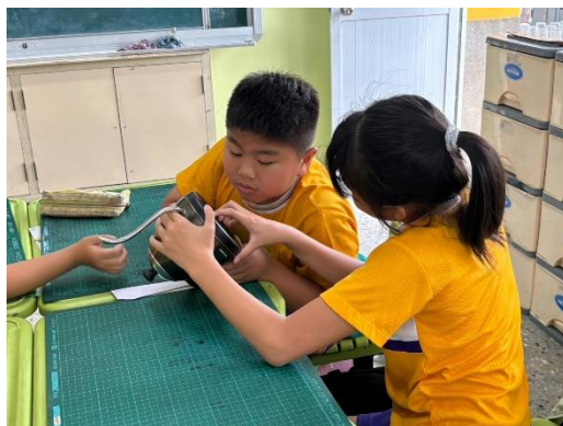
學生實際觀察電器耗電功率