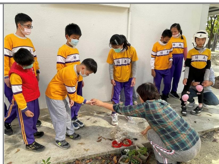
大家開心帶著青蔥回家種看看