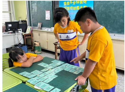
以桌遊讓學生更具節能概念與行為