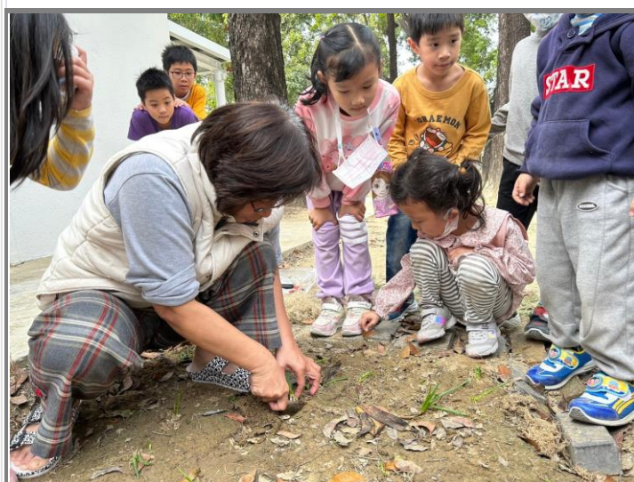
示範新鮮蔥頭將根部修剪、種植