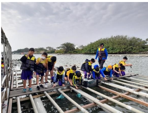
學生實際走訪養蠶文化