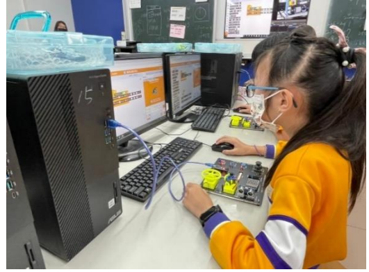
以節能-定時/感應照明為主題