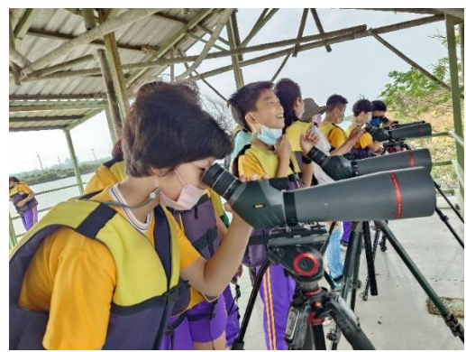
學生實地觀察黑面琵鷺