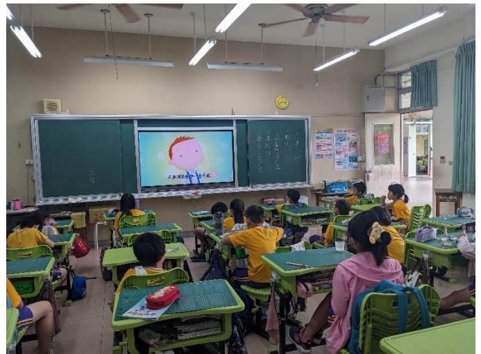
說明：學生觀賞海洋教育影片