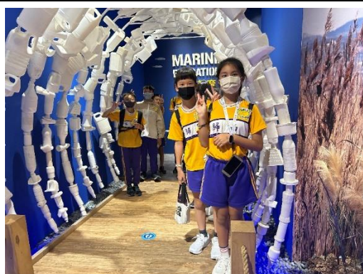
了解海廢對生態的影響，響應減廢低碳