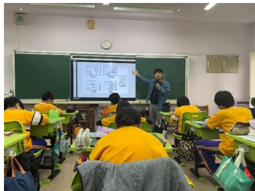
以四格漫畫引導學生創作宣導海報