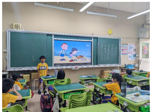
說明：學生分享海洋與環境影響影片心得