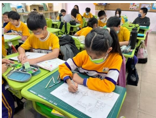
學生結合環保議題繪製漫畫