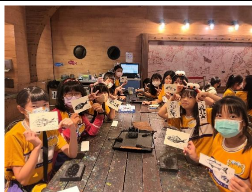
認識海洋生物與魚拓體驗活動