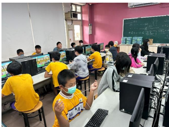
說明:救溺安全宣導 1