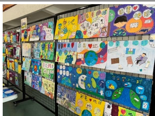
達到向全校師生與家長倡導節能之效