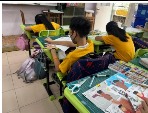
藉由創作將節能意識潛移默化於日常