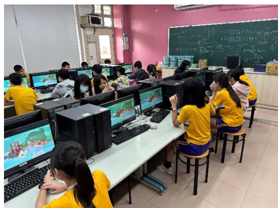
說明:救溺安全宣導 3