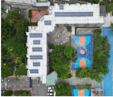
太陽能屋頂—育賢樓