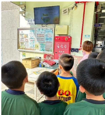
說明節能減碳電視牆之宣導內容