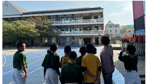
學生實地了解太陽能設置位置與用途