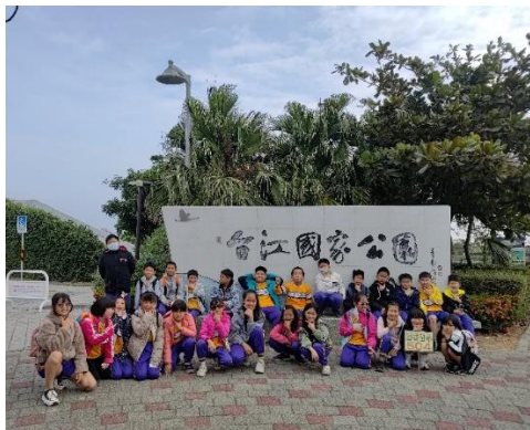
學生至台江國家公園體驗濕地生態