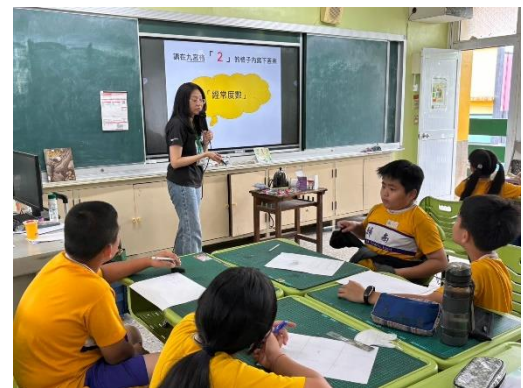
學生反思生活中的節能行動