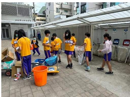
每週二為全校資源回收日