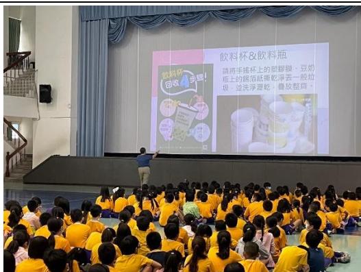
全校資源回收宣導