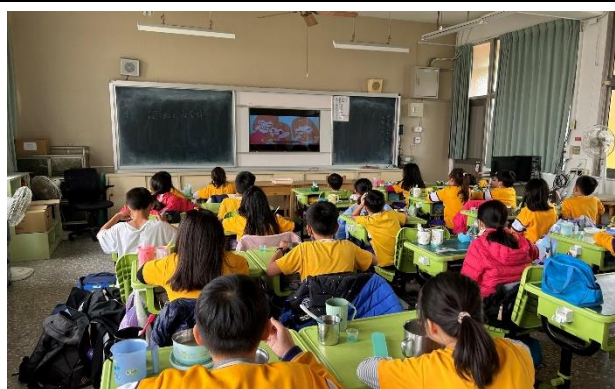
班級餐前五分鐘宣導