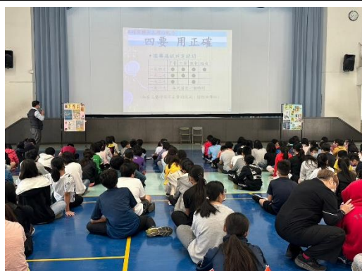
邀請社區藥師入校宣導用藥安全