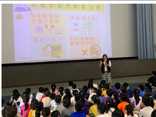
下學期健康吃快樂動宣導-營養早餐