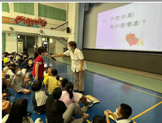
上學期健康吃快樂動宣導-均衡飲食