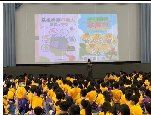
清明連假前用火安全宣導