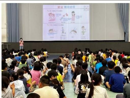
邀請衛生所入校宣導愛滋防治