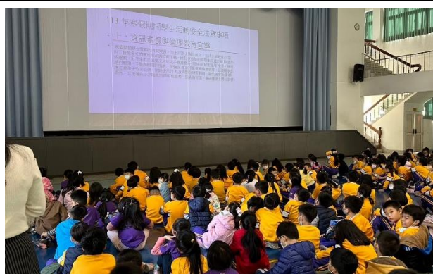
網路使用安全宣導