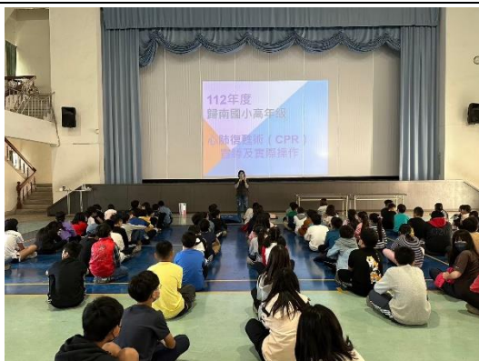
每學期進行 CPR 急救宣導