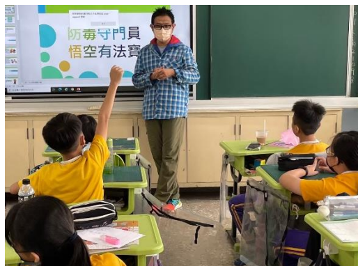
防毒守門員入班宣導