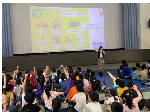
下學期健康吃快樂動宣導-營養早餐