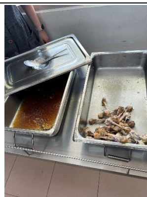
全校推行午餐零剩食