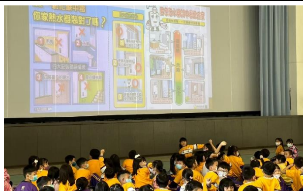
秋冬一氧化碳中毒防治宣導