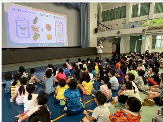
上學期健康吃快樂動宣導-均衡飲食