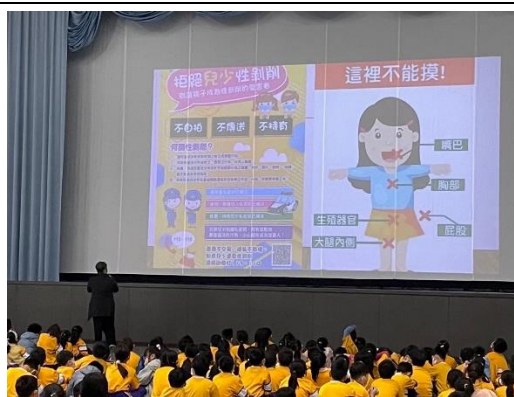
兒少人身安全宣導