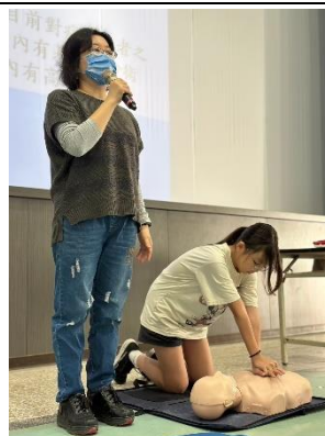
學生實際操作演練 CPR