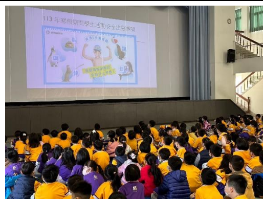
水域防溺水安全宣導