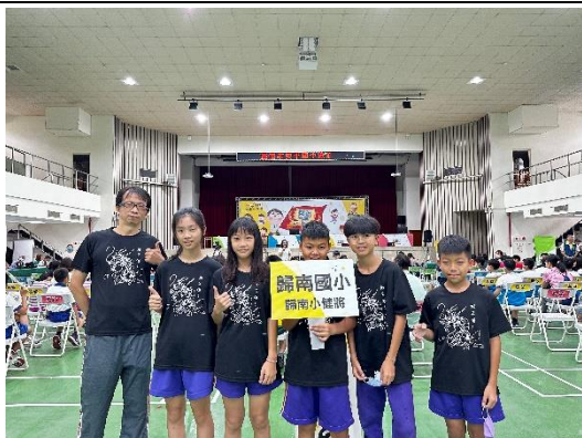
歸南小健將勇闖健康知識大挑戰