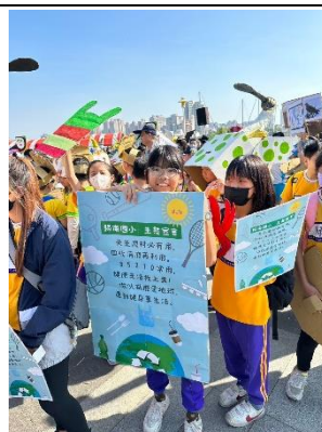
學生透過動物嘉年華遊行進入社區推廣