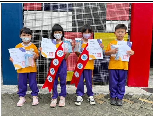
潔牙小天使回各班與家中推廣潔牙