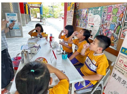
牙菌斑滴劑檢驗潔牙成果