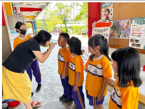
護理師進行潔牙成果與蛀牙檢視