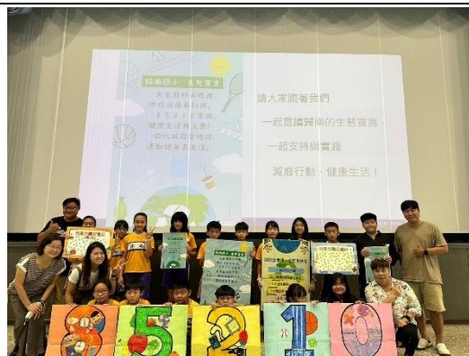
健康生活-通過臺美生態學校銀牌認證