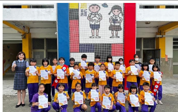
潔牙小天使接受校長表揚