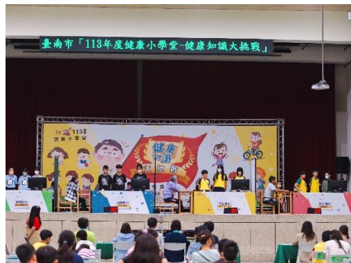
養健康知識千日就用於臺上一時