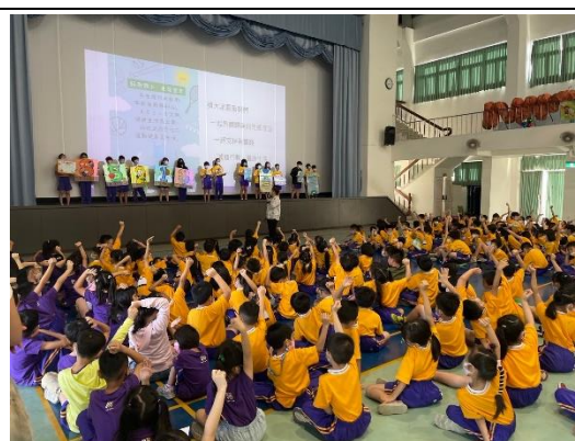
學生帶領全校宣讀與實踐本校生態宣言