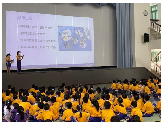
學生向全校倡導健康生活計畫