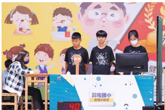
使用救援牌請智囊團神救援