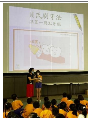
護齒達人和護理師向全校倡導貝式刷牙