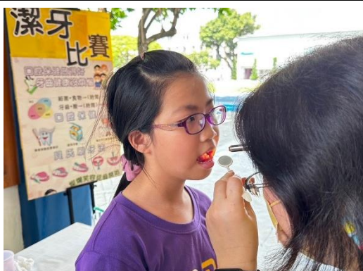
個別進行口腔衛教指導