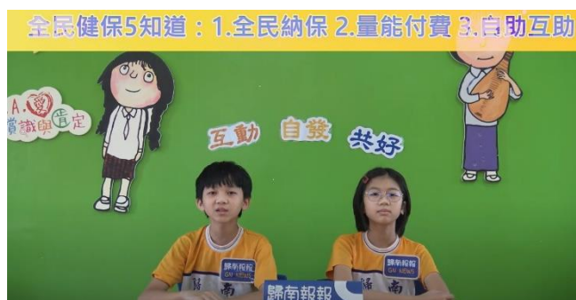
參加南市 112 學年度校園健康主播評選