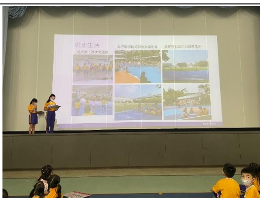
學生向全校發表推行健康生活成果