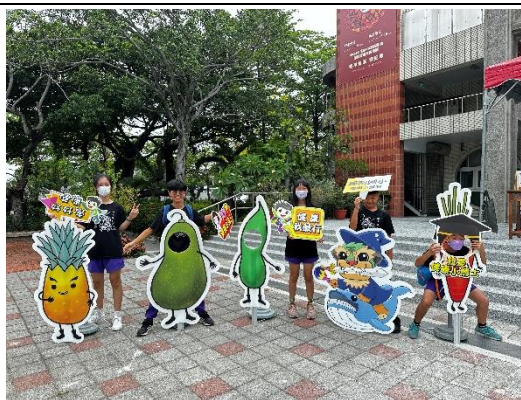
小健將雖敗猶榮，將健康知識帶回家