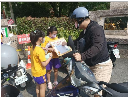
邀請家長一起支持健康生活