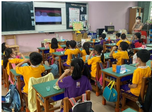
教師於課堂讓學生實際演練操作