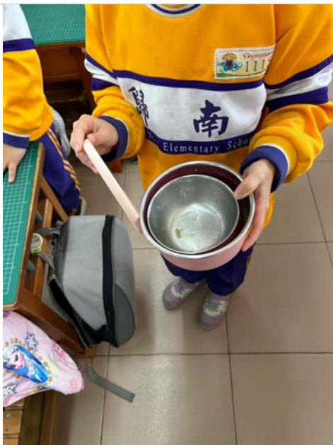
健康就是把菜吃光光