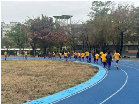
班級於早自修進行跑步