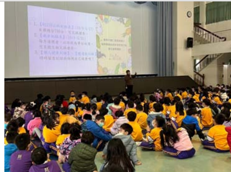
學生朝會時進行健康護照使用說明