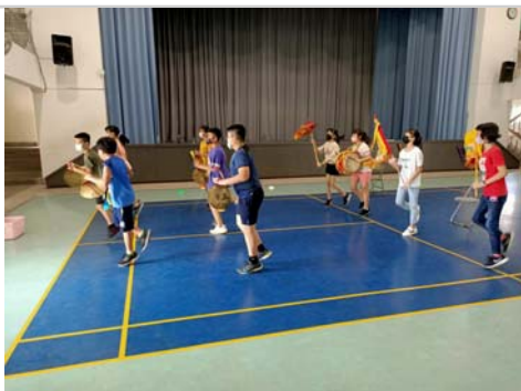
班級於課間活動時間練跳鼓