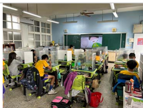
高年級班級餐前五分鐘