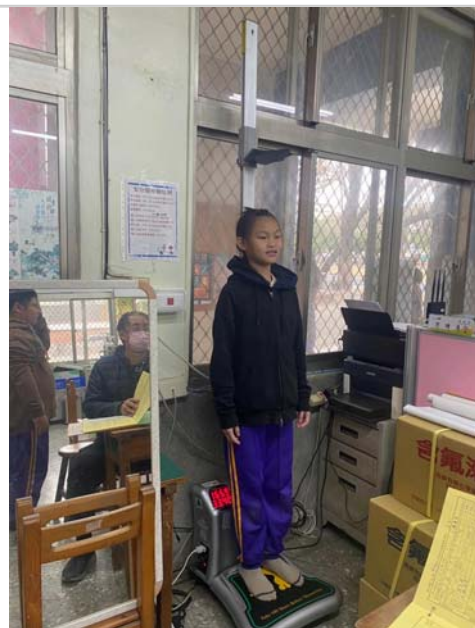
每學期初進行身高體重視力量測