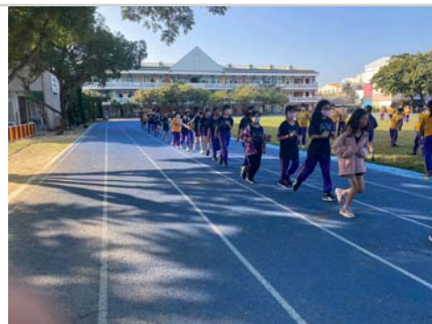
班級自主於晨間進行跑步活動，養成運動習慣。