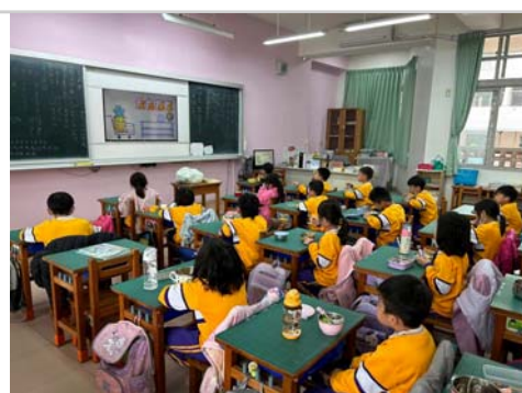
低年級班級餐前五分鐘