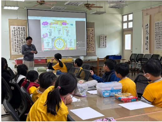
教師課堂中宣導五正四樂概念