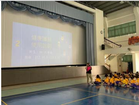
學生朝會時進行健康護照使用說明