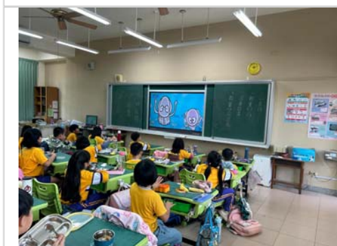
中年級班級餐前五分鐘