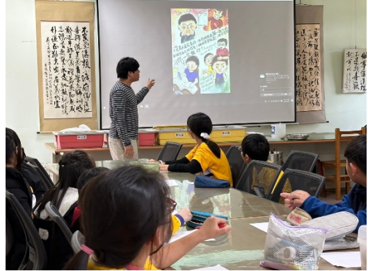
將正向心理議題融入藝術與人文領域