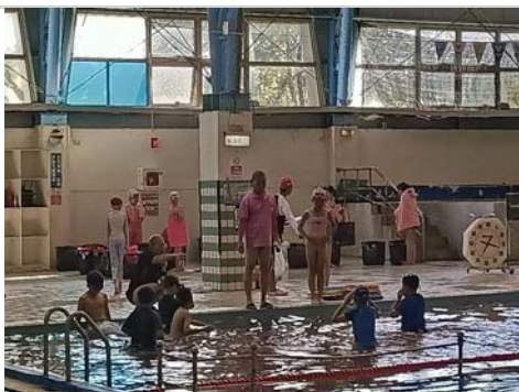
教練講解游泳的動作要領