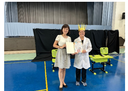
空品故事媽媽劇團申請