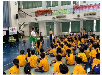
視力保健偶戲團申請