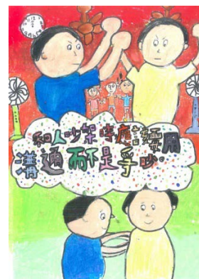
學生作品：和平相處