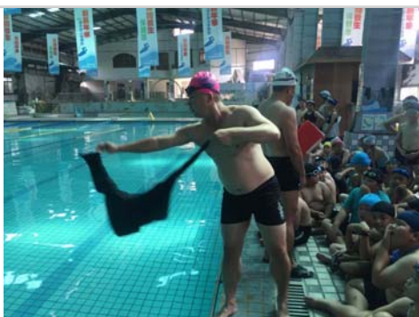
教練示範如何利用物品救人