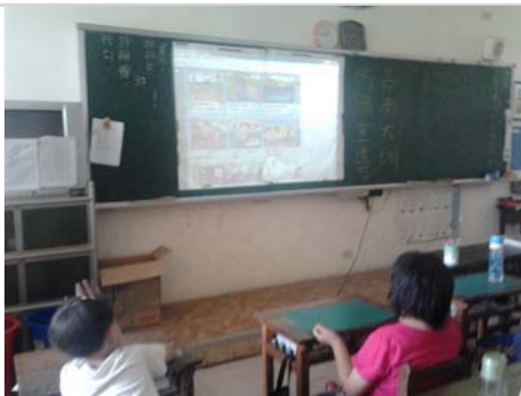
在班級上播放水域安全相關動畫宣 導