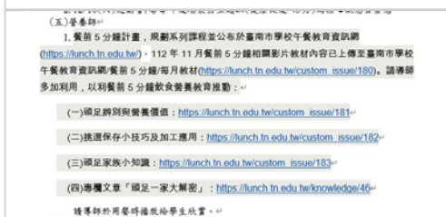
營養師於教師會議宣達每月餐前五分鐘飲食教育課程。