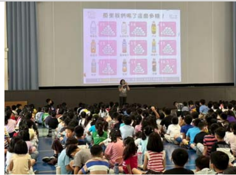
護理師宣導校園零含糖，促進健康體位養成。