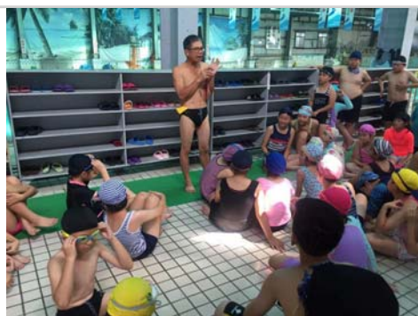
教練講解遇到溺水時的自救方法