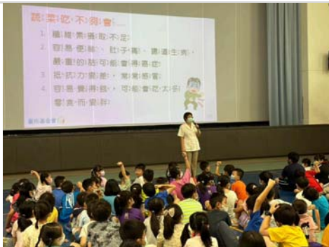
營養師晨間時間宣導多吃蔬果的重要。