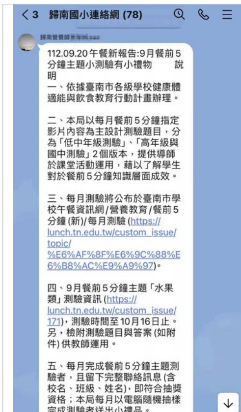
營養師於學校群組推廣餐前五分鐘飲食教育活動。