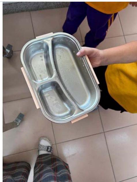
清空餐盤健康上身