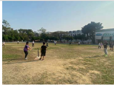
舉辦班際體育競賽