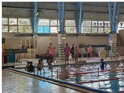
教練講解游泳的動作要領