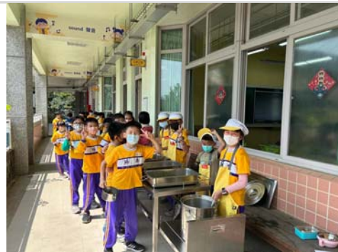
營養午餐安心吃健康長大