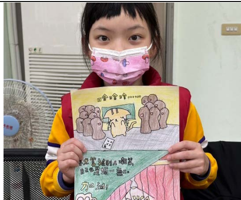
將周遭生活經驗以漫畫表述