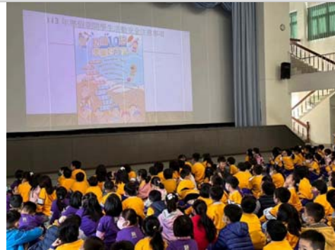
於結業式跟學生宣導水域安全