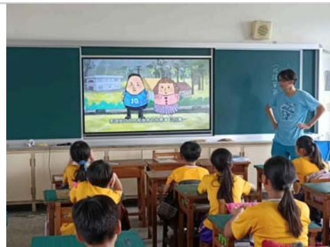
在班級上播放水域安全相關動畫宣 導