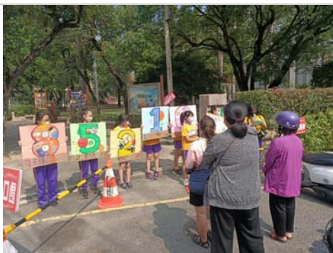
學校健康生活團隊於校門口向家長倡導落實健康密碼85210