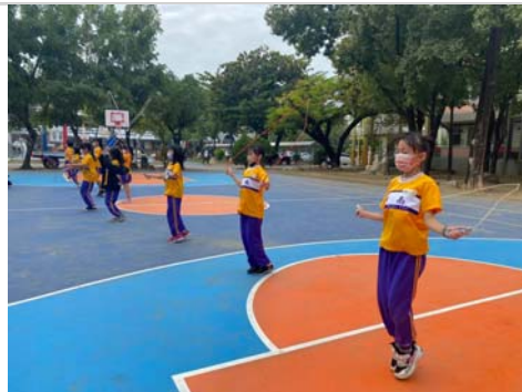
班級於早自修進行跳繩