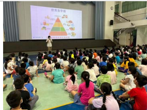
營養師晨間時間宣導均衡飲食、不挑食。