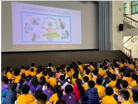
於結業式跟學生宣導水域安全