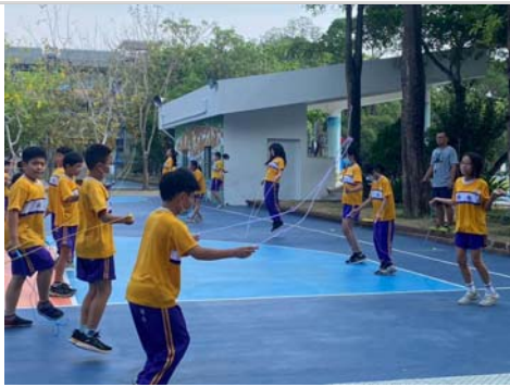
舉辦班際體育競賽