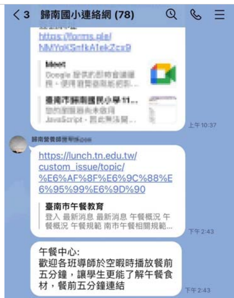
營養師於學校群組宣導餐前五分鐘飲食教育。