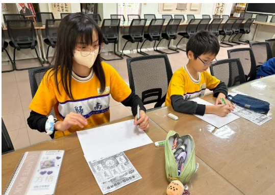
學生設計正向心理心情小語