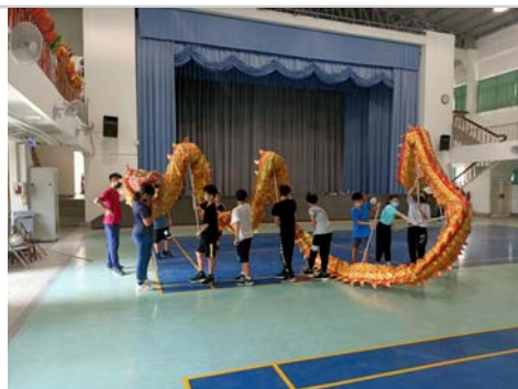
班級於課間活動時間練舞龍