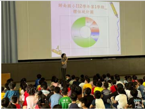
利用晨間時間，進行全校健康體位宣導。