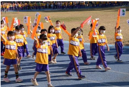
運動會進場-潔牙小天使