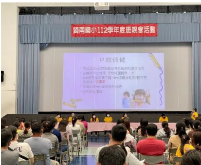
班親會-口腔保健宣導