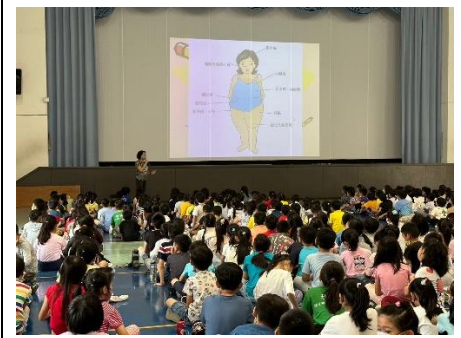
辦理健康體位宣導