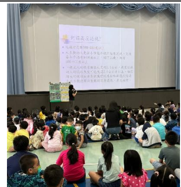
排定視力保健宣導