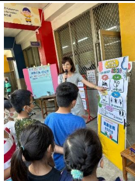
兒童節闖關結合健康體位