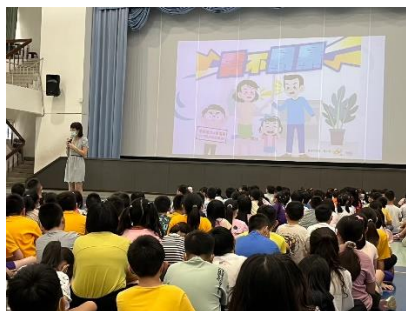
校長於始業式帶領宣導