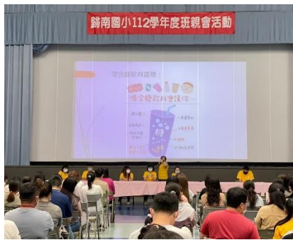
班親會-零含糖飲料宣導