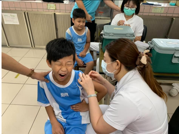
辦理校園流感疫苗接種宣導