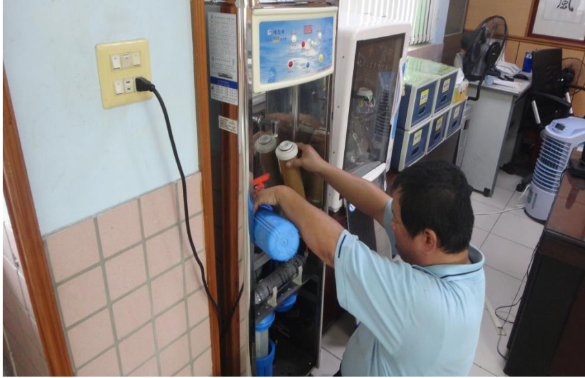
飲水機濾心定期檢測與更換