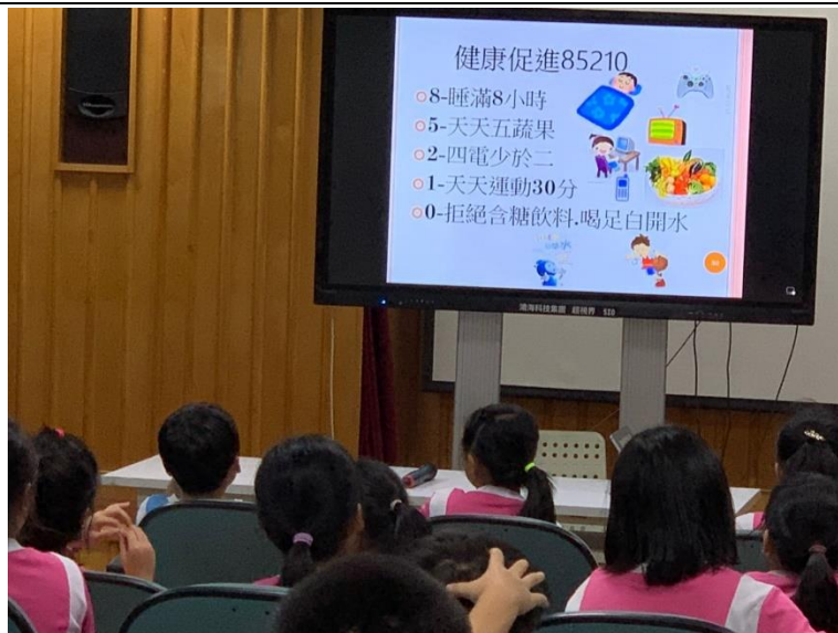
辦理健康體位均衡飲食宣導