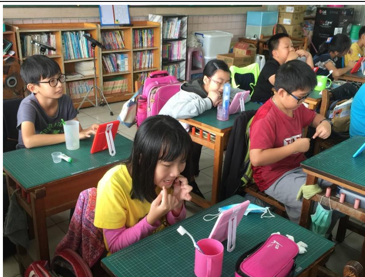
辦理牙線示範教學辦理性教育及愛滋病防治宣導