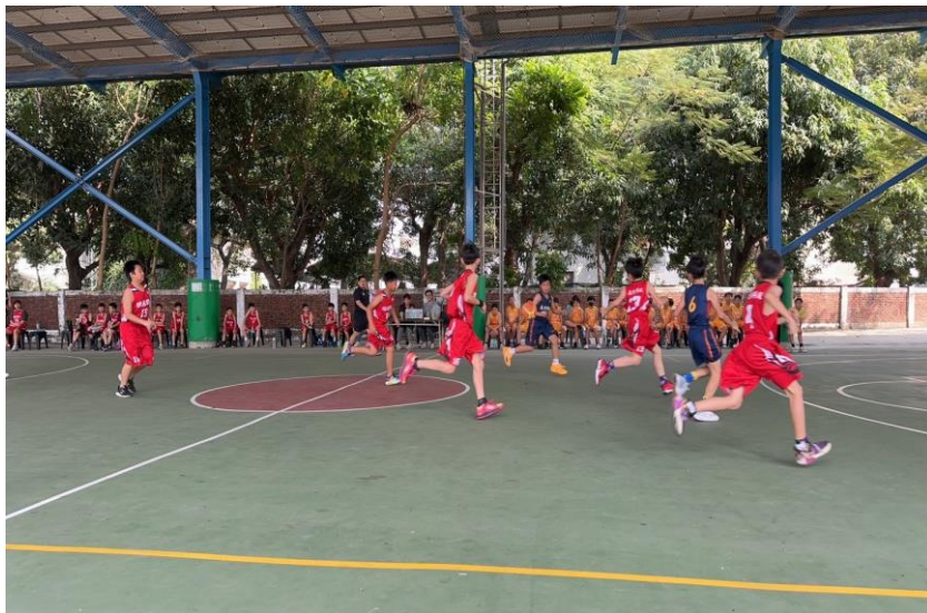
辦理友校聯合友誼運動比賽