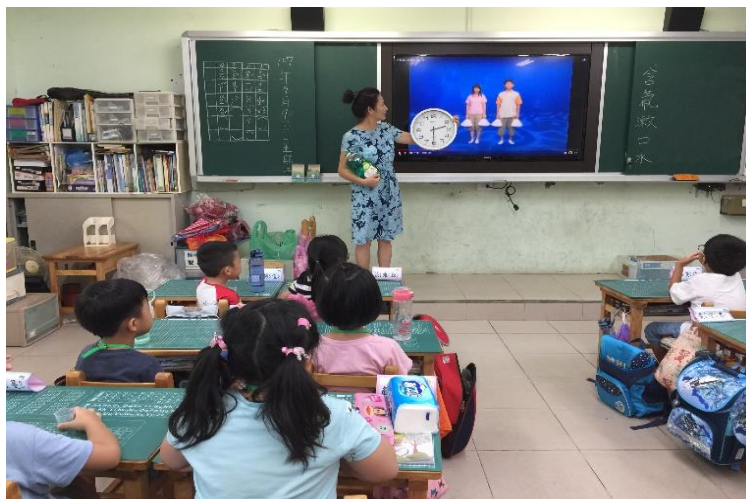
辦理含氟漱口水宣導