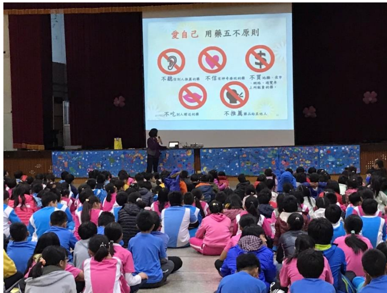
辦理正確用藥宣導