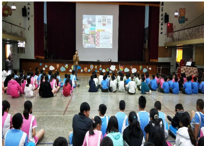
辦理防治藥物濫用