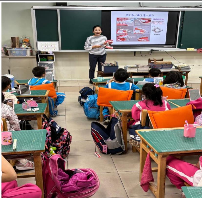
辦理貝氏刷牙法示範教學