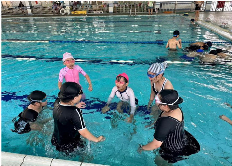
辦理五年級游泳教學