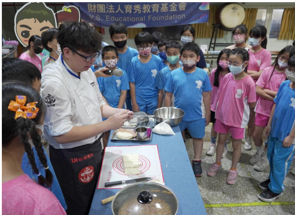
五年級參加育秀基金會辦理食育教育課程