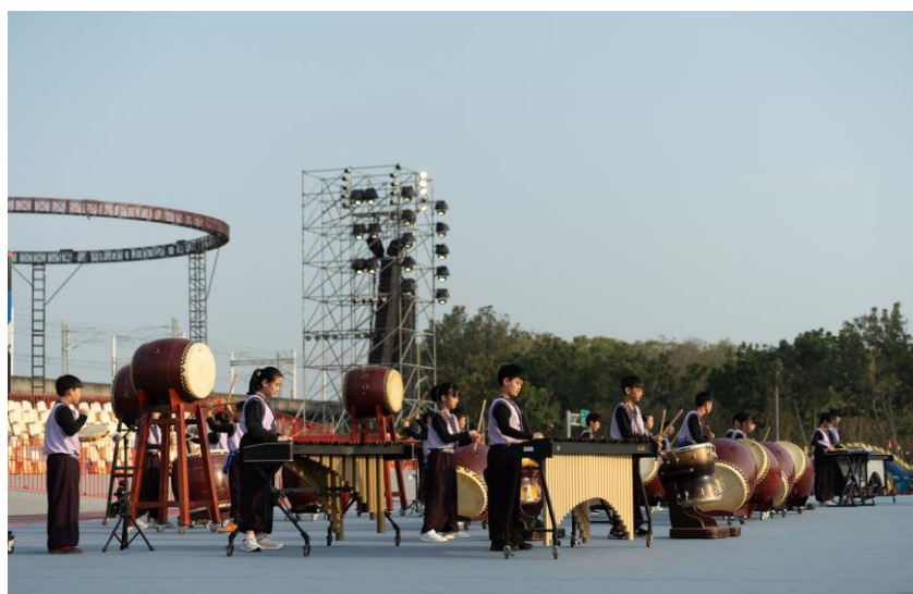
參加臺南市燈會開幕表演嘉賓