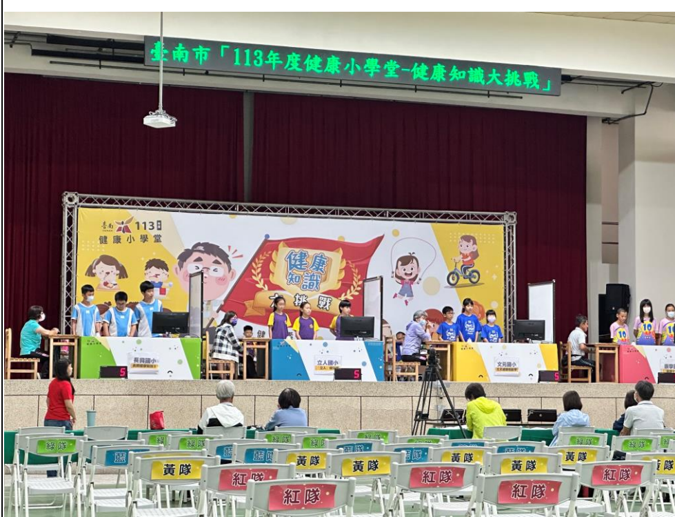
五年級參加 113 年度健康小學堂-健康知識大挑戰