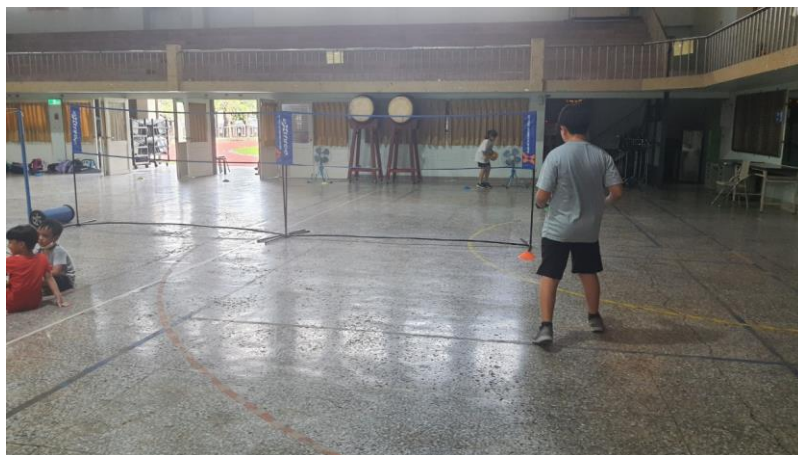
辦理多元體能課後才藝班