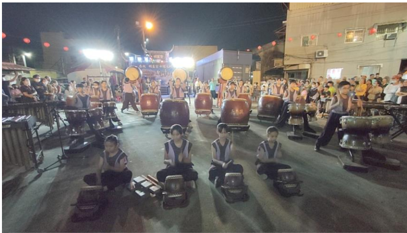
辦理明直宮鼓隊表演活動