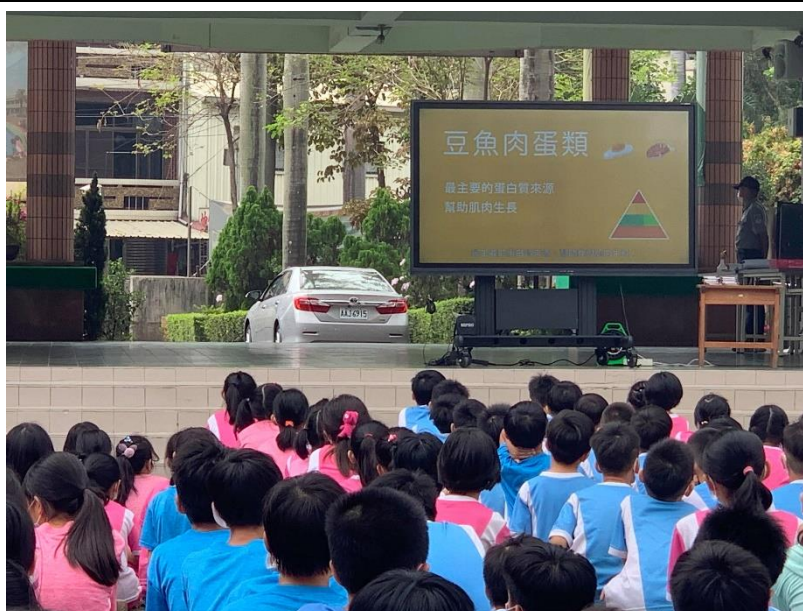
辦理營養教育宣導