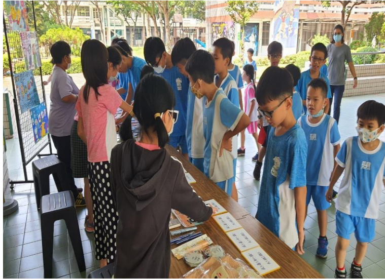
辦理校園反毒遊戲式闖關活動