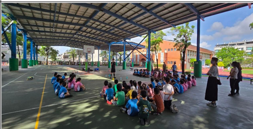
二年級扯鈴體驗課程