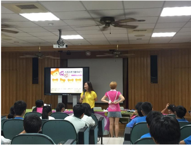
辦理 EASY SHOP 生理講座