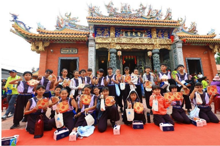
辦理聖天宮擔水餅文化節鼓隊表演活動