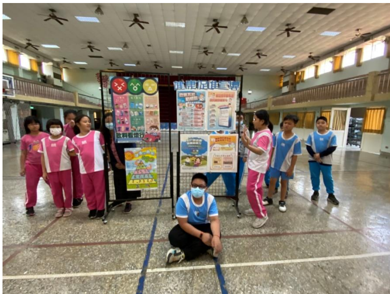
辦理正確用藥宣導