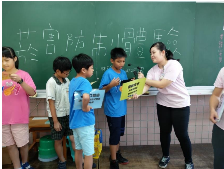
辦理菸害防制宣導