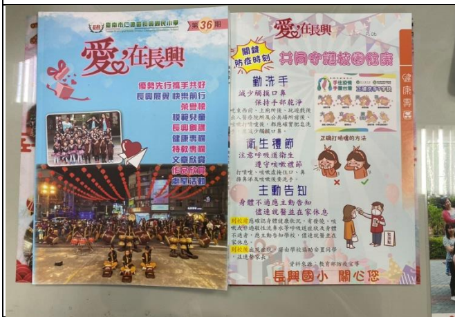
說明：利用學校校刊宣導健康促進資訊1