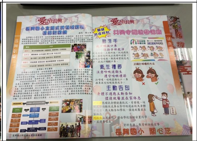
說明：利用學校校刊宣導健康促進資訊2