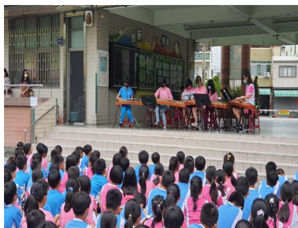
說明:古箏社團校園快閃表演