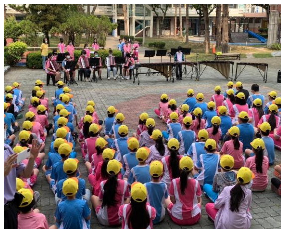
說明:樂隊校園快閃表演