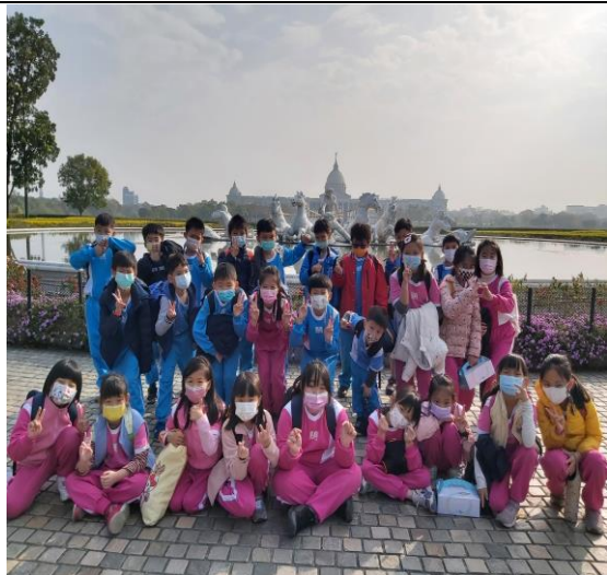
說明:參訪奇美博物館