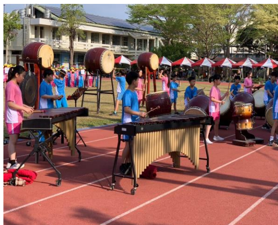
說明:鼓隊校園快閃表演