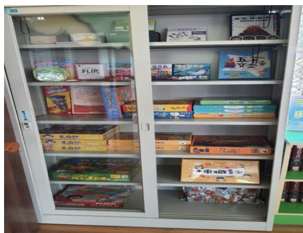
說明:圖書室設置桌遊專用櫃，師生皆可借用