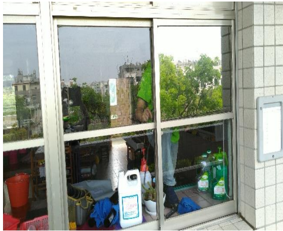
說明：教室西曬節能膜遮陽