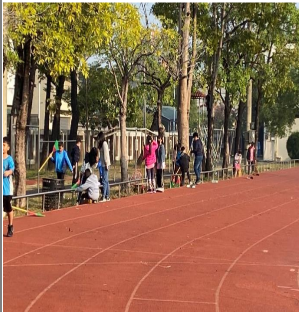
說明:學生參與校園美化綠化工作