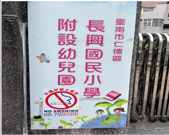
說明：無菸無毒環境營造