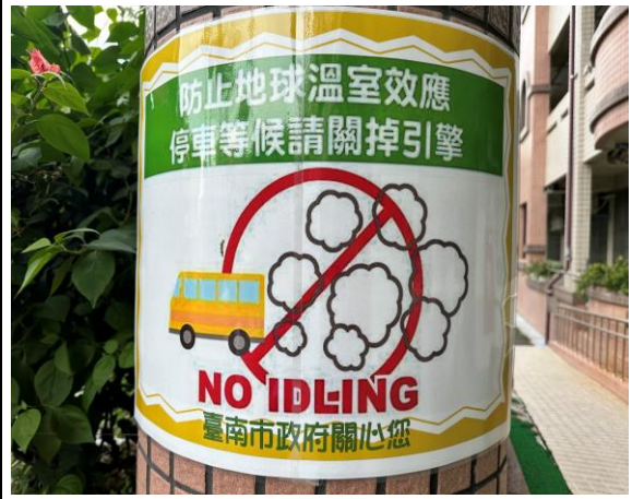
說明：無菸無毒環境營造