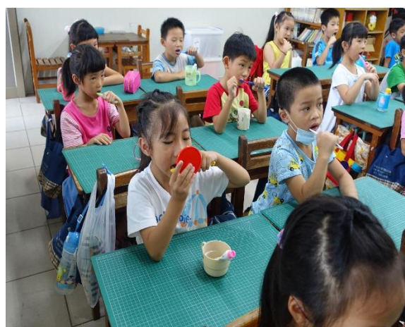
潔牙小尖兵陪伴低年級同學刷牙