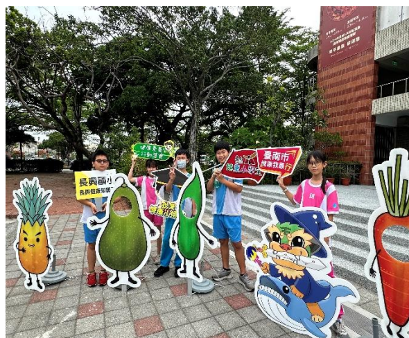
參加健康知識大挑戰