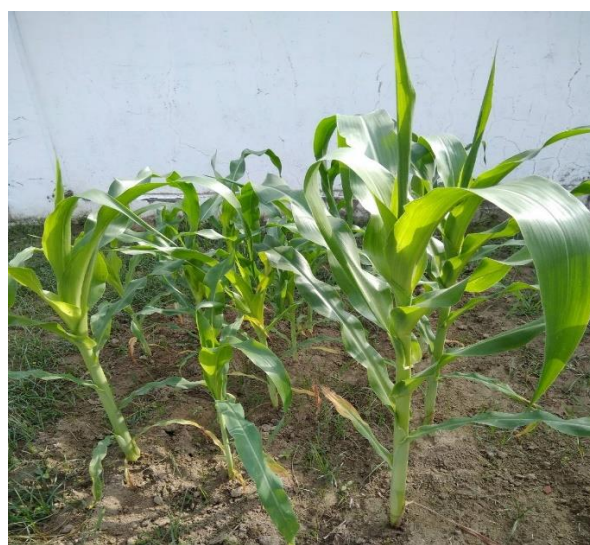
班級認養校園健康農地