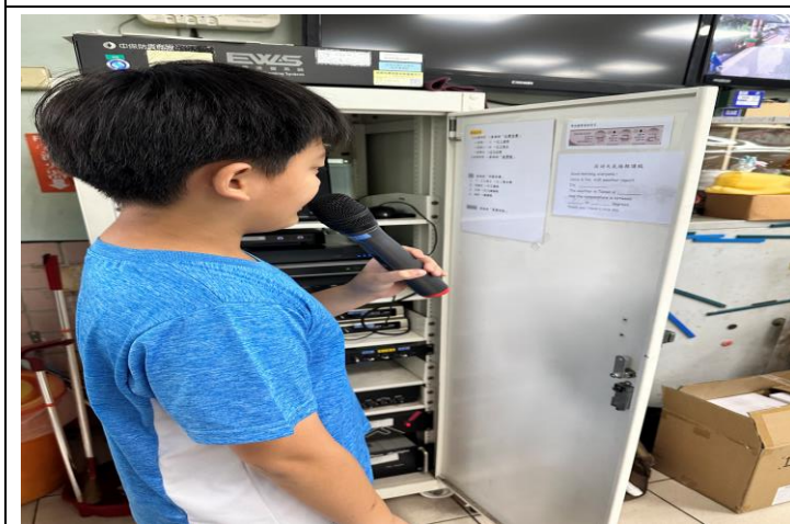
晨間時間校園健康雙語主播