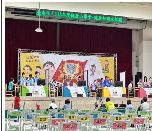
參加健康知識大挑戰