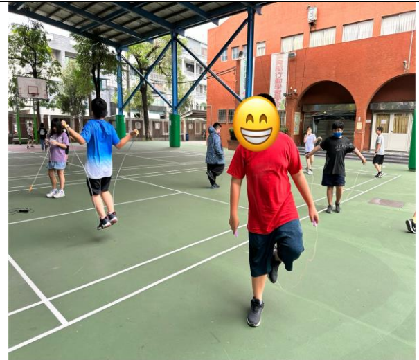
成立健康活力體控班