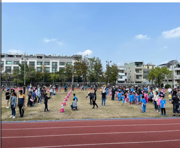
每學年舉辦「校慶運動會」