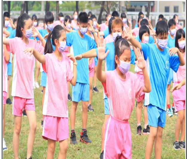
健康促進概念落實於教學與課程 結合雙語課程_雙語健身操