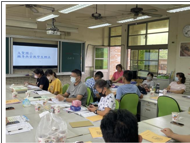
教師會議宣導正向管教策略

良好的師生互動及學生互動、民主過程、兩性關係、校園霸凌預防、弱勢族群關懷等，需有計畫及實施過程。