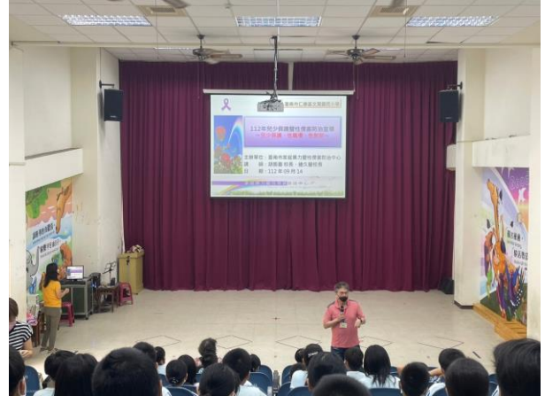
家防中心性平暨兒少保護宣導