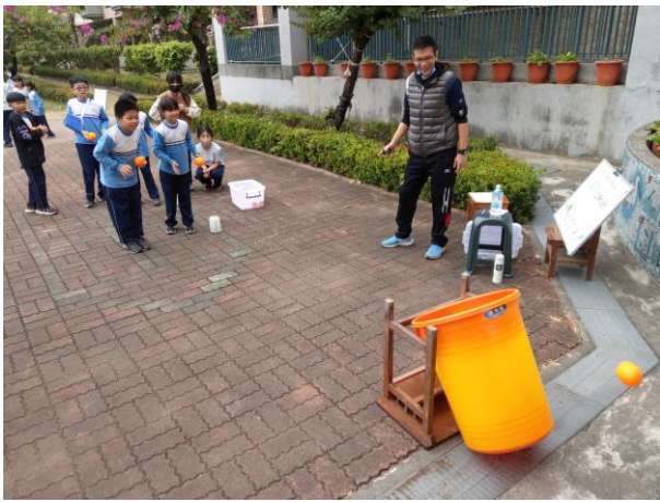
舉辦混齡闖關活動，以大帶小的方式 並由老師擔任關主，全校一起同樂。