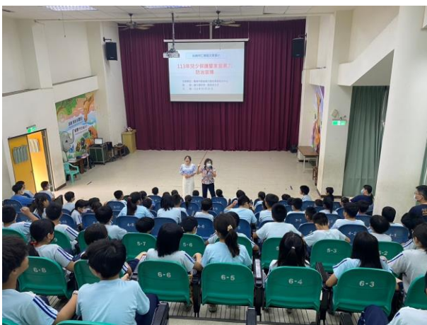
家防中心性平暨兒少保護宣導