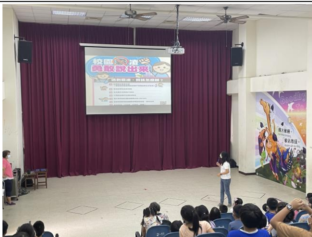
學生朝會時，霸凌防治宣導