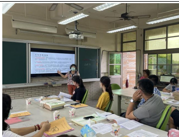
教師會議宣導正向管教策略