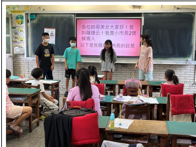
小市長候選人到各班進行政見發表