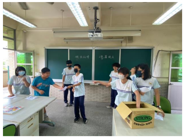
六年級學生擔任選務人員，協助所有小市長選舉活動事宜