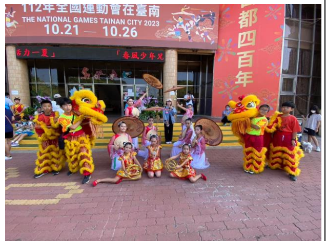
成立各式社團並鼓勵參加比賽讓學生 展現自信