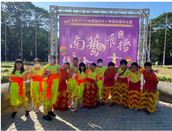
成立各式社團並鼓勵參加比賽讓學生 展現自信