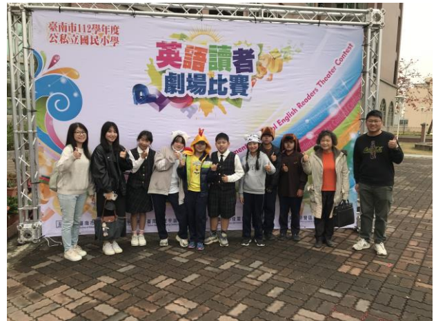
指導學生參加比賽，讓學生展現自信