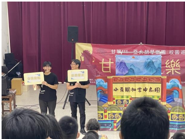
甘箏音樂會暨反霸凌宣導