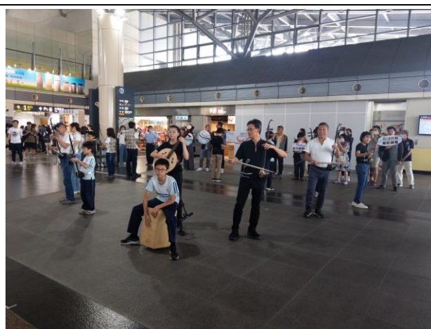
母親節高鐵快閃活動，展現學習成果及自信