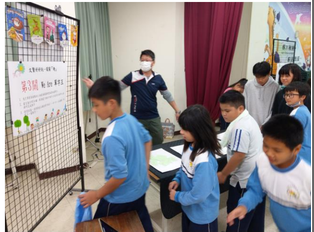
舉辦混齡闖關活動，以大帶小的方式 並由老師擔任關主，全校一起同樂。