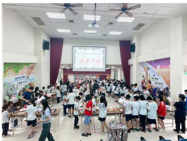
舉辦跳蚤市場活動，將義賣所得捐贈給喜憨兒基金會及流浪動物之家。