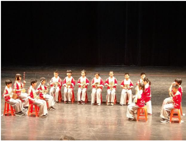
成立各式社團並鼓勵學生參加比賽