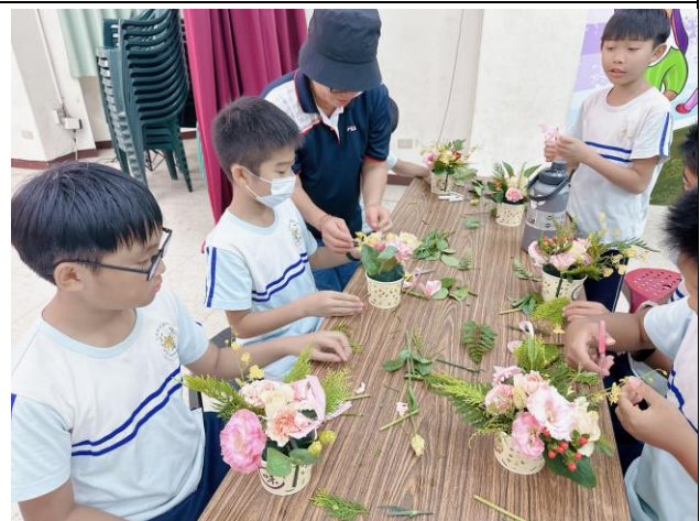
母親節前，全校學生在老師的指導下，每人插一盆花送給照顧自己的人