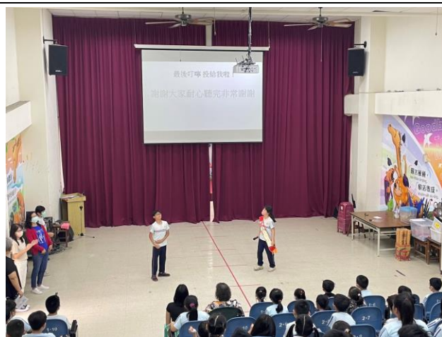
小市長候選人於學生朝會時政見發表