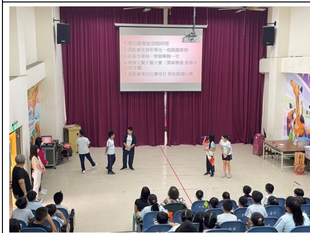
小市長候選人於學生朝會時政見發表