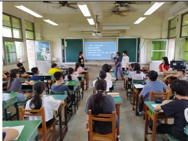
小市長候選人到各班進行政見發表