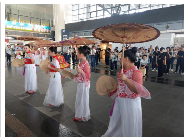
母親節高鐵快閃活動，展現學習成果及自信