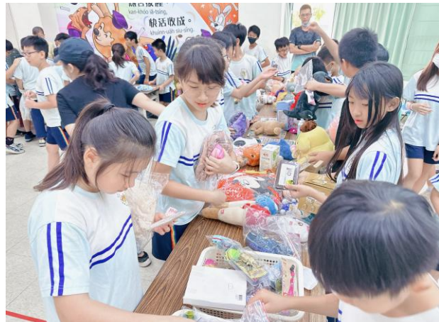
舉辦跳蚤市場活動，將義賣所得捐贈給喜憨兒基金會及流浪動物之家。