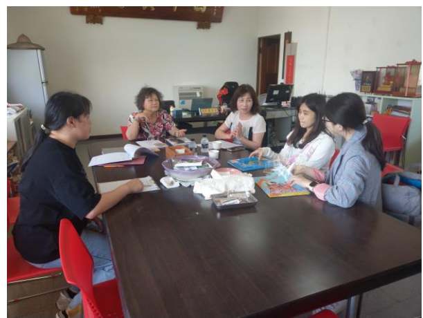
學校申請小團體輔導，輔導訪視