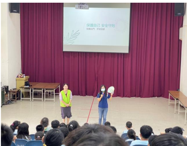
創世基金會交通安全宣導暨募款活動