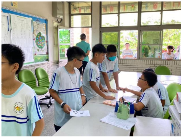
學生投票選出心目中理想的人選