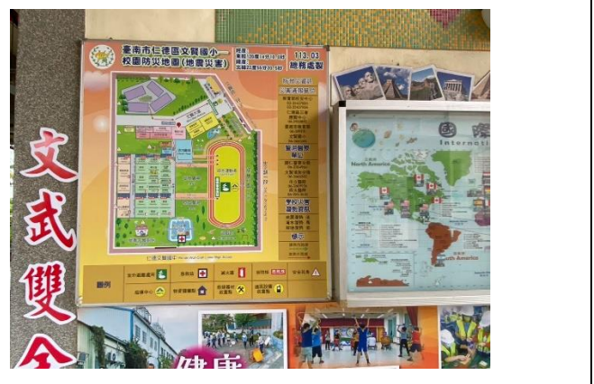
繪置校園安全地圖並張貼