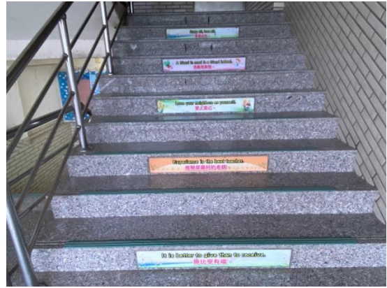
安裝防滑保護貼條