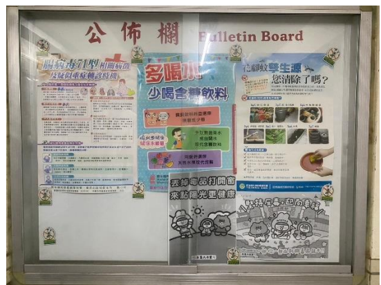
公佈欄張貼反毒文宣