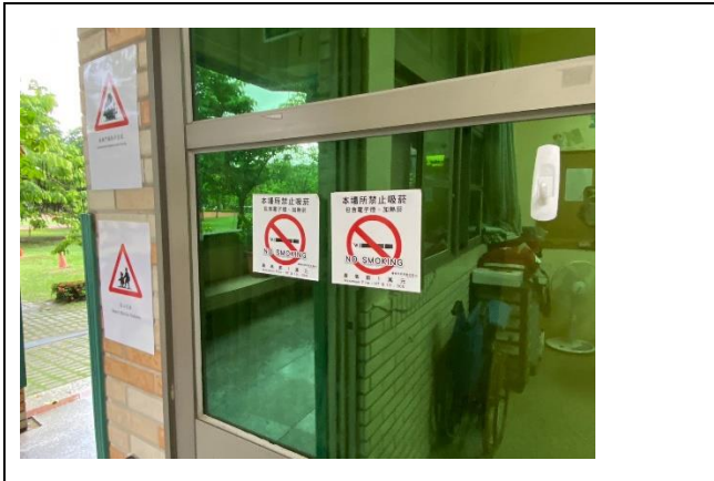
校園張貼禁煙標語