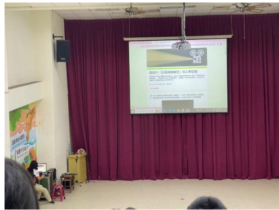
學生朝會時反毒宣導