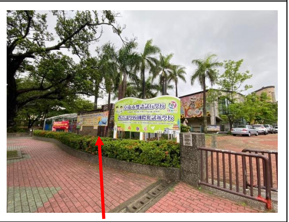
校園張貼禁煙標語