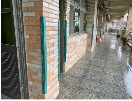
安裝防撞保護貼條