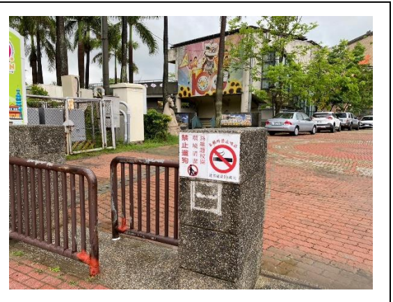
校園張貼禁煙標語