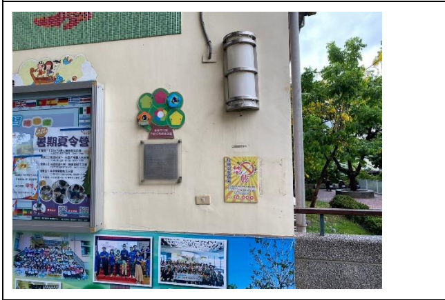
校園張貼禁煙標語