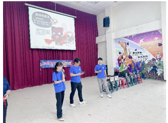
長榮大學社工系反毒宣導