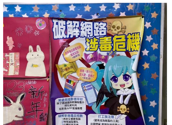
公佈欄張貼反毒文宣