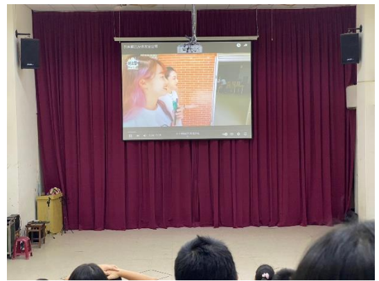
學生朝會時反毒宣導