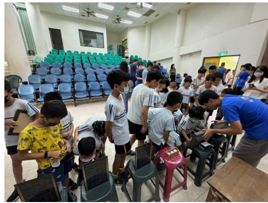
長榮大學社工系反毒宣導