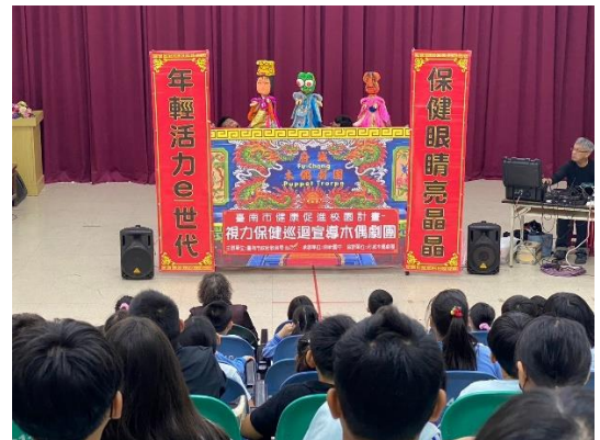
說明：申請視力巡迴偶戲表演。