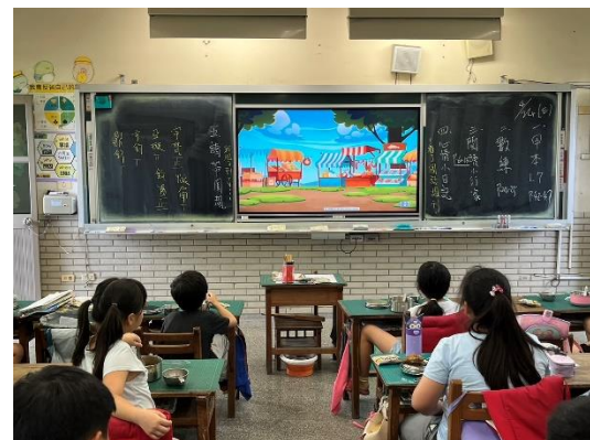
說明：教師推動餐前 5 分鐘