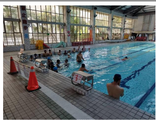
說明：申請教育部專案計畫實施游泳課