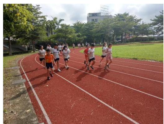
說明：學生朝會後全校大晨跑