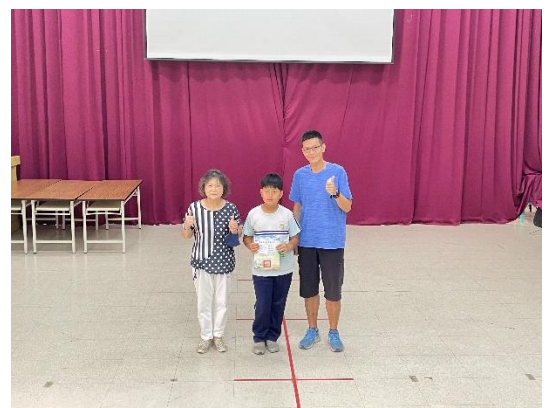
說明：學生利用課餘時間上網自學並參加檢測成績優良，特頒獎鼓勵。