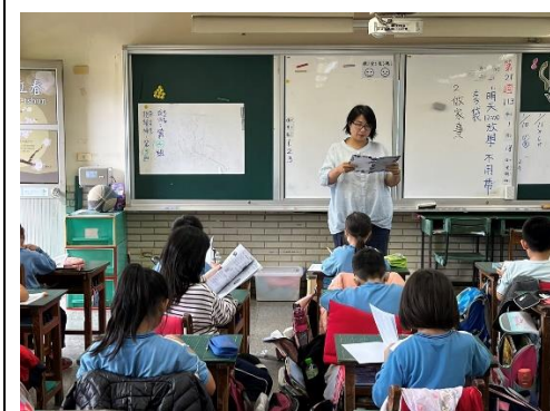
說明：教師推動健康護照