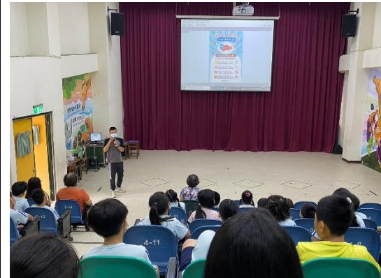
說明：仁德衛生所C肝防治宣導