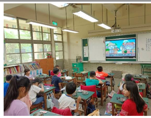
說明：教師推動餐前 5 分鐘