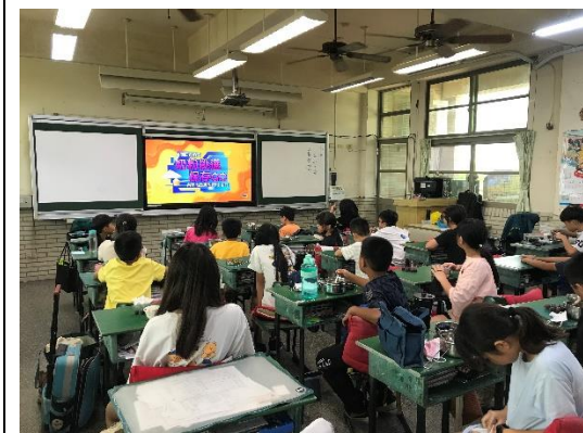
說明：教師推動餐前 5 分鐘