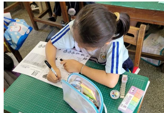
說明：教師推動健康護照