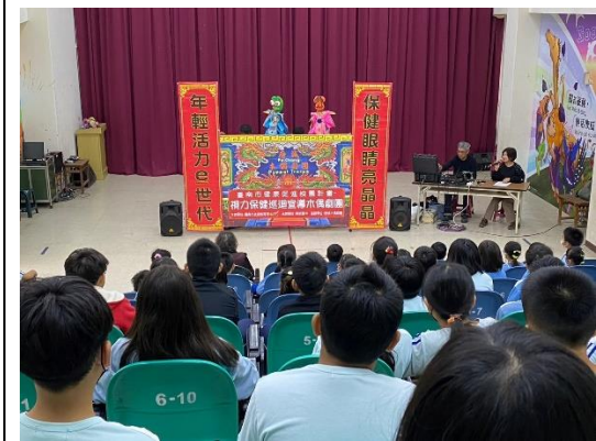
說明：申請視力巡迴偶戲表演。