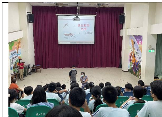
說明：仁德衛生所登革熱防治宣導