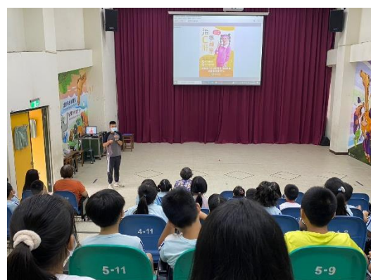
說明：仁德衛生所C肝防治宣導