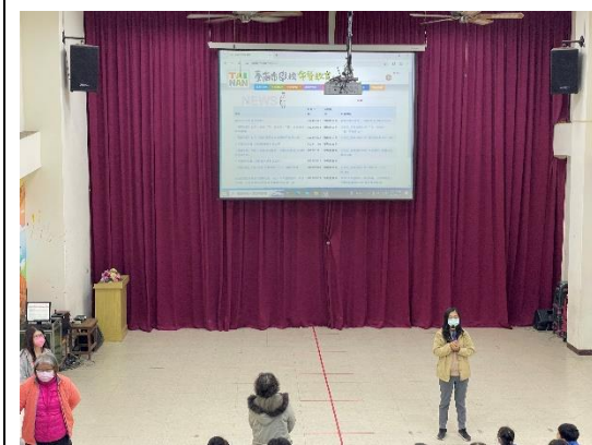
說明：介紹臺南市餐前五分鐘網站，鼓勵學生利用課餘時間上網自學並參加檢測。