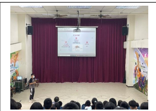
說明：仁德衛生所登革熱防治宣導