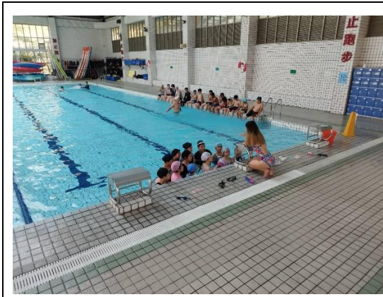
說明：申請教育部專案計畫實施游泳課