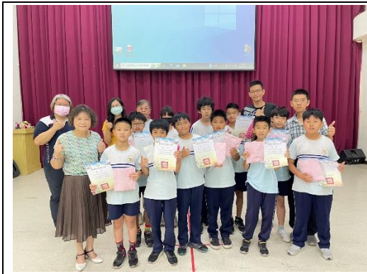
說明：體適能表現優良學生頒獎