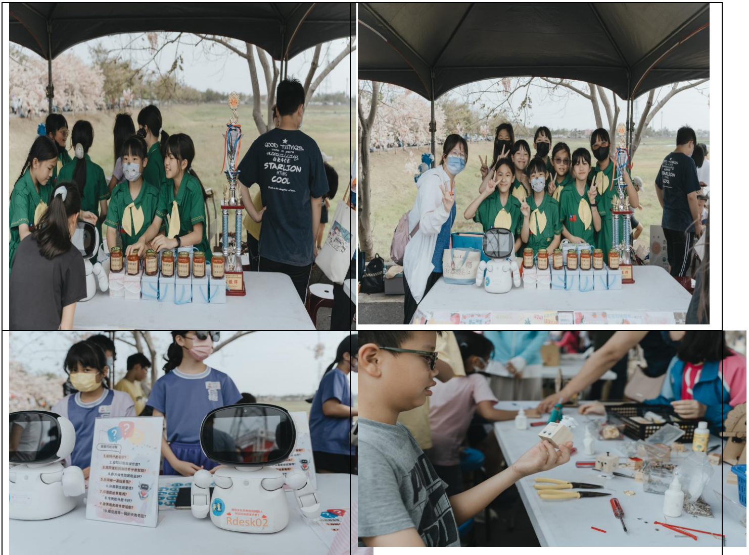
本校女童軍及學生參加健走暨擺攤活動