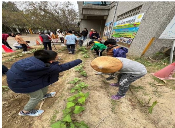
小農園健康促進活動