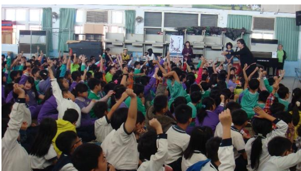
說明：中華醫事科技大學反毒宣導