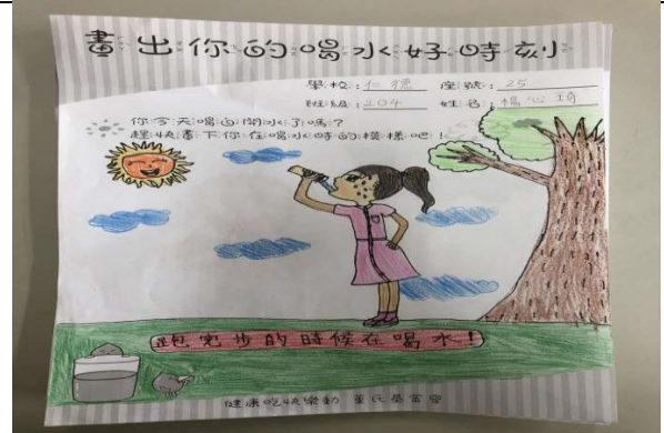
說明：董氏基金會健康宣導-多喝白開水