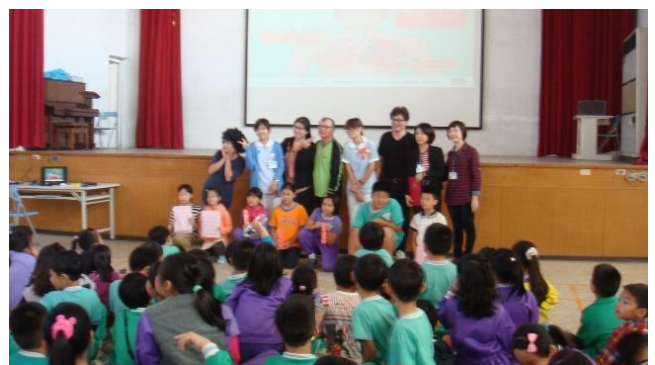
說明：中華醫事科技大學反毒宣導