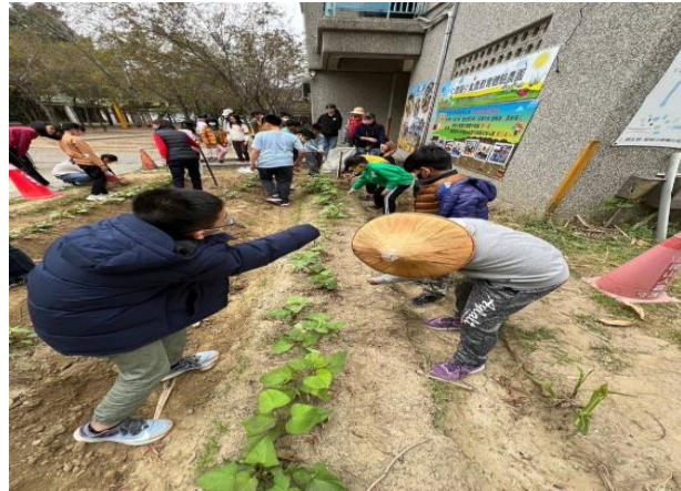
小農園健康促進活動