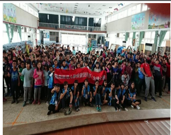
說明：嘉南藥理大學低碳飲食宣導