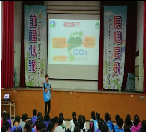
說明：嘉南藥理大學低碳飲食宣導