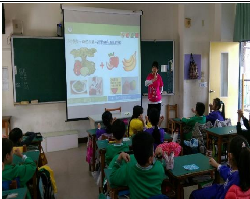
說明：董氏基金會健康飲食宣導-天天五蔬果