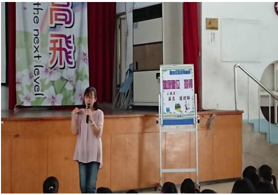
說明：仁德區衛生所健康體位宣導