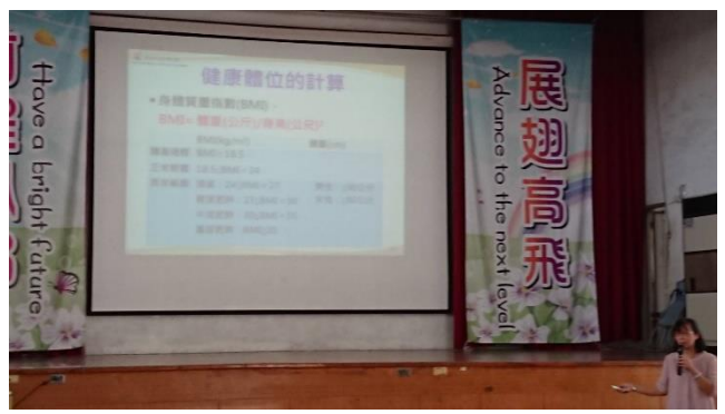
說明：仁德區衛生所健康體位宣導