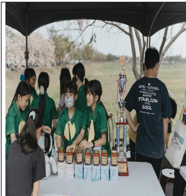
本校女童軍及學生參加健走暨擺攤活動