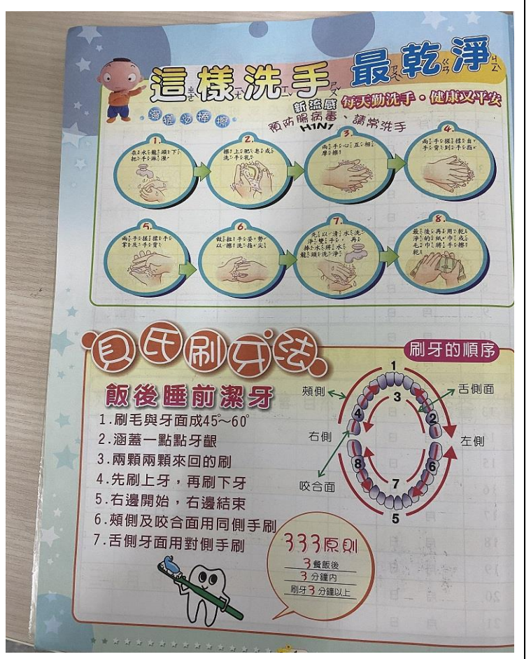
勤洗手及刷牙宣導