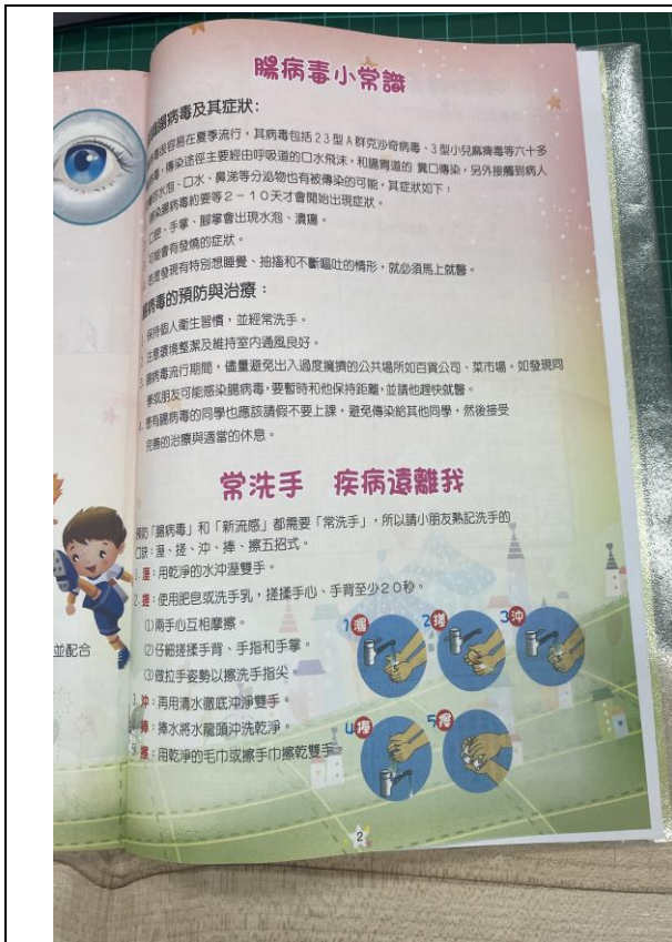
說明：聯絡簿健康資訊