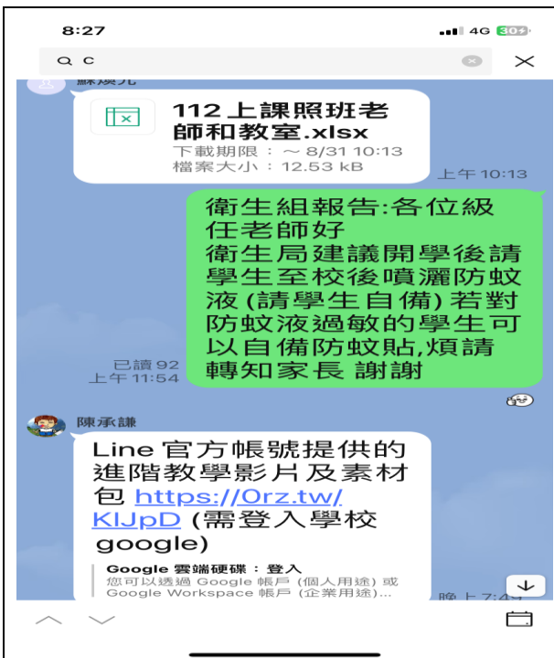
健康資訊於網路社群宣導