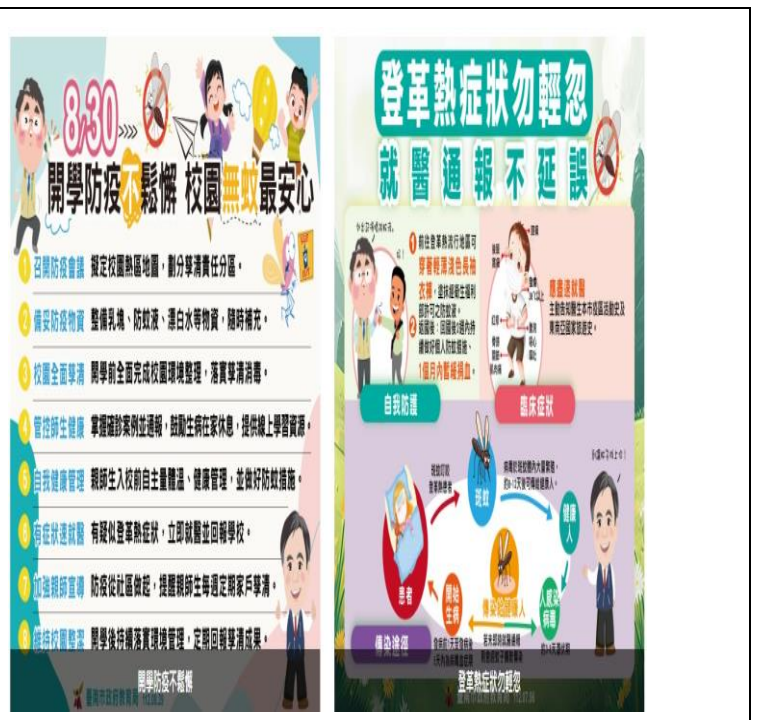
校網建置防治登革熱網站