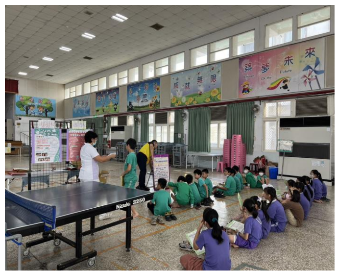
各項健康資訊諮詢服務