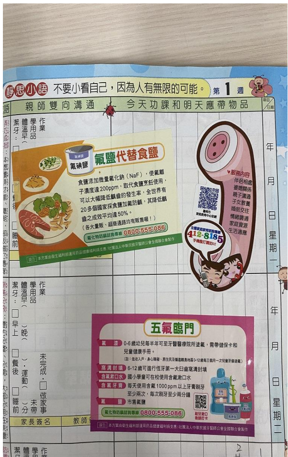
健康飲食宣導貼紙