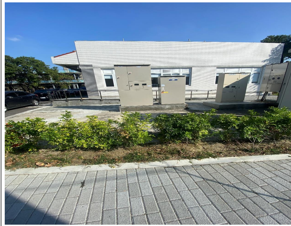
校園好望角開放校園