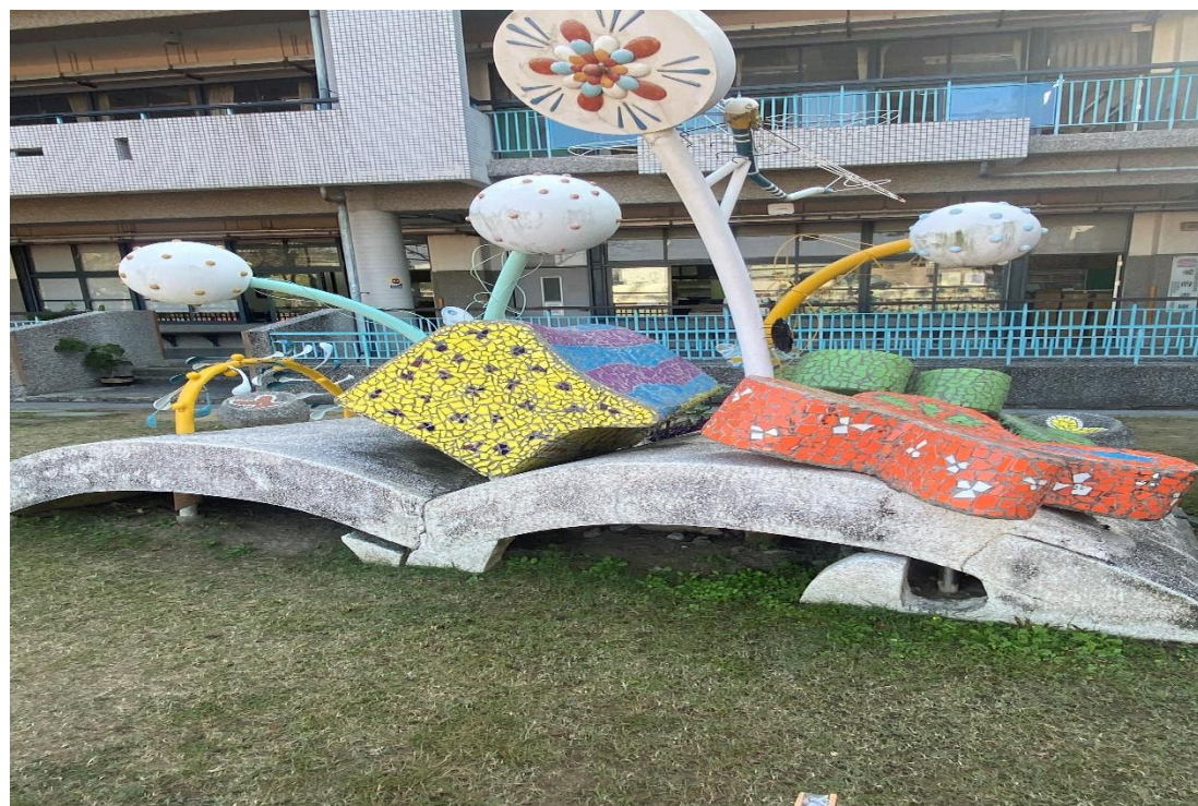
結合標語跟藝術造景的情境建立溫馨氣氛