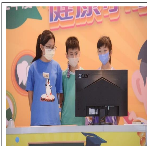
說明:參加健康小學堂比賽