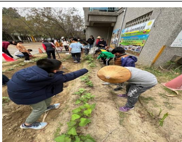
小農園健康促進活動