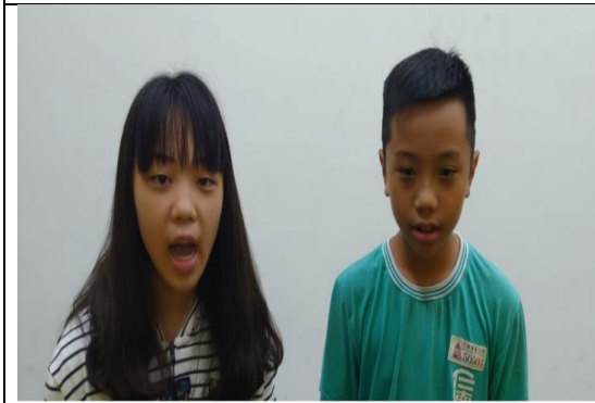
健康促進逗陣行答嘴鼓