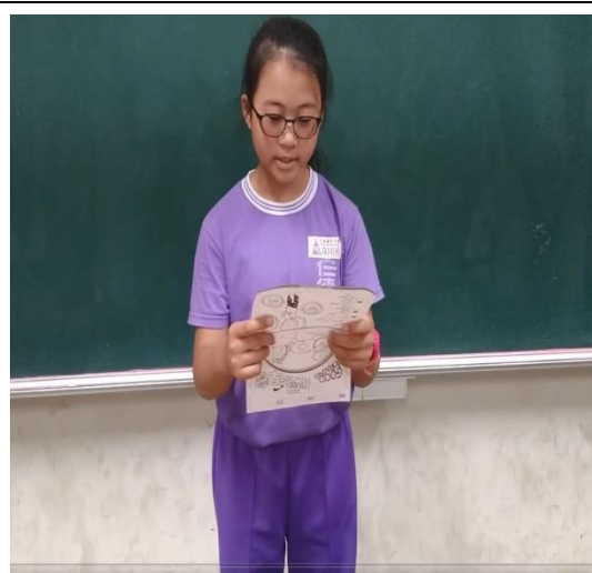
說明: 參加校園健康主播