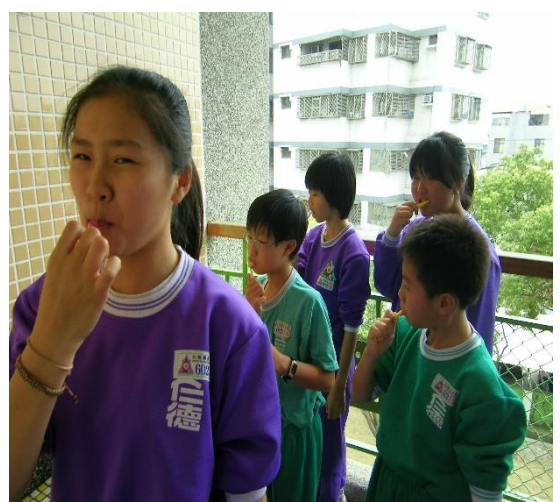
天天力行餐後潔牙