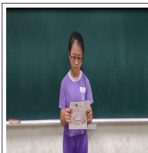
說明:參加校園健康主播