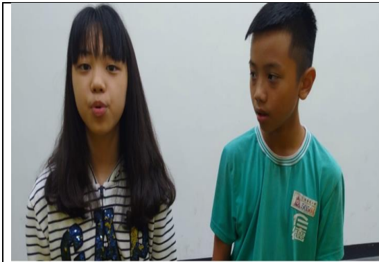
健康促進逗陣行答嘴鼓