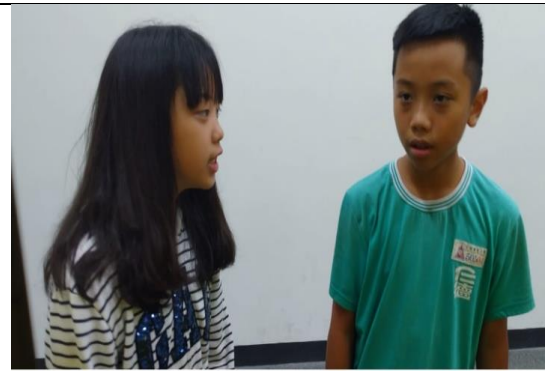
健康促進逗陣行答嘴鼓