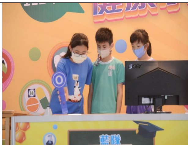
說明:參加健康小學堂比賽