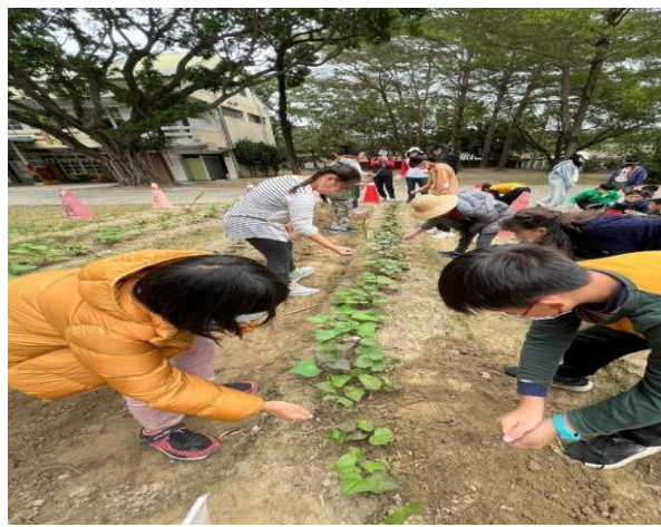
小農園健康促進活動