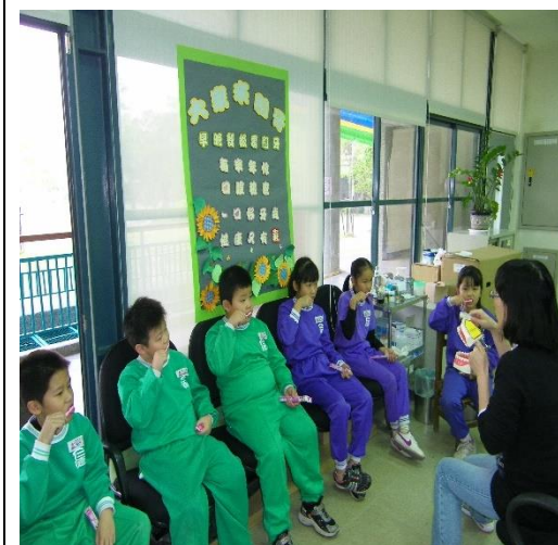
各班潔牙尖兵到健康中心受訓貝氏刷牙法