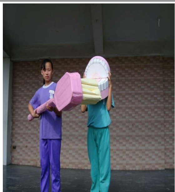
學校朝會示範刷牙要領