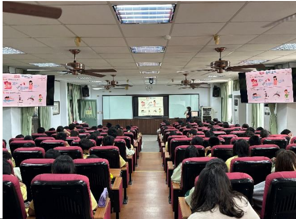
說明：衛生所護理師愛滋病宣導。