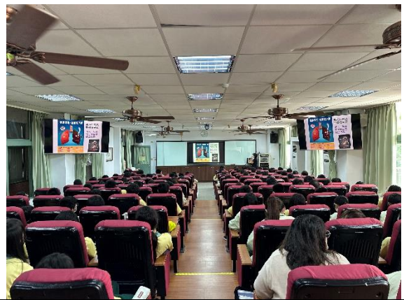
說明：菸害防制宣導。