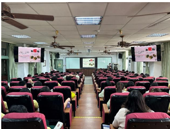
說明：檳榔防制宣導。