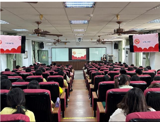
說明：菸檳酒防制宣導。