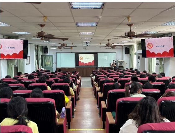
說明：菸檳酒防制宣導。