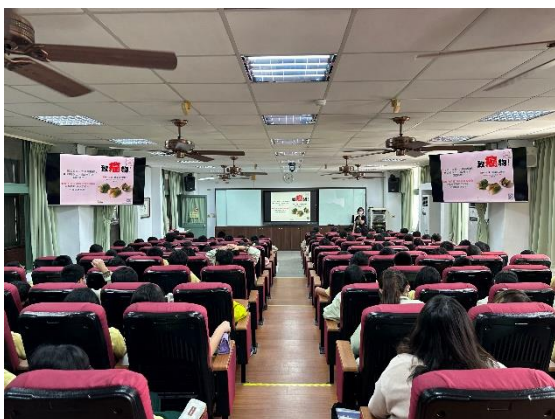
說明：檳榔防制宣導。