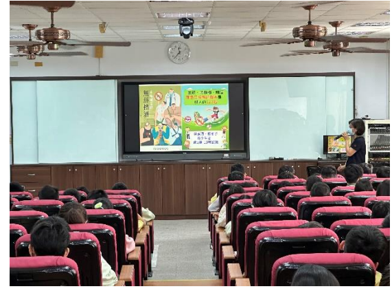
說明：菸檳酒防制宣導。