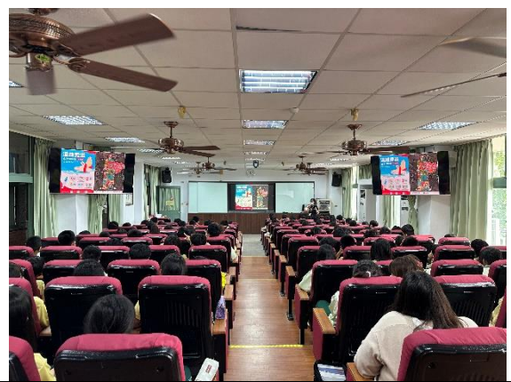
說明：衛生所護理師愛滋病宣導。