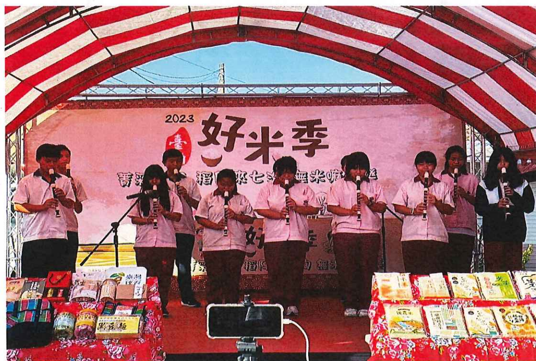
參加區公所好米季活動 直笛演奏表演