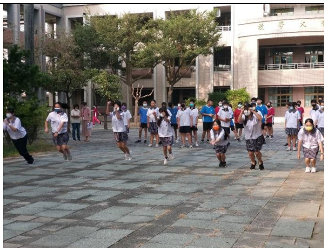
辦理教職員工學生健康體適能健康管理活動(體適能---立定跳)