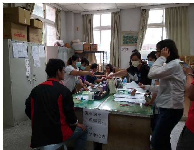
辦理教職員簡易健檢