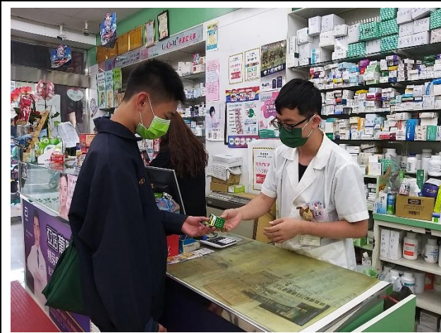
提供教職員工生健康諮詢