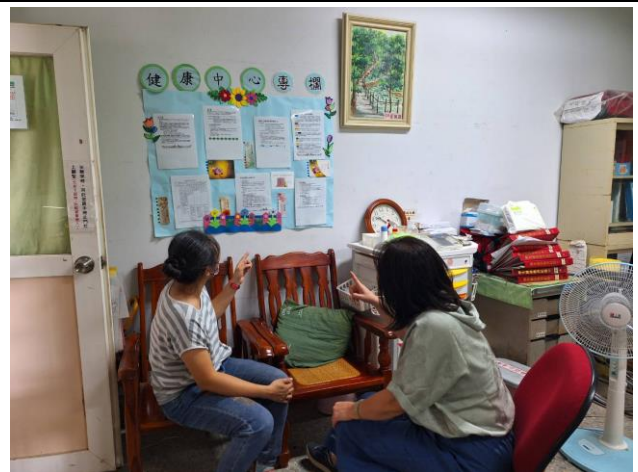
護理師提供教職員工生健康諮詢