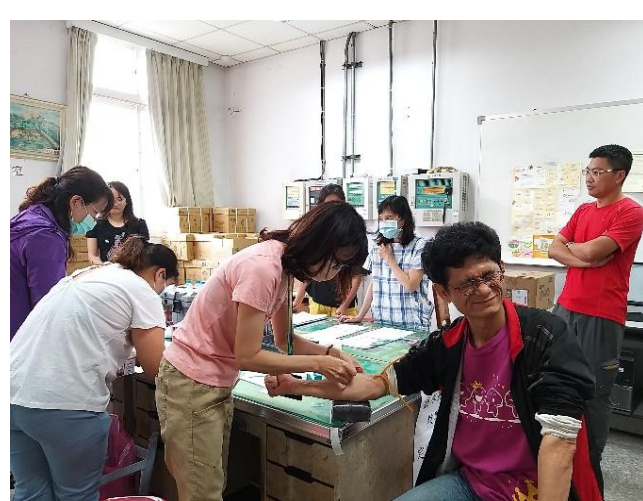
辦理教職員簡易健檢