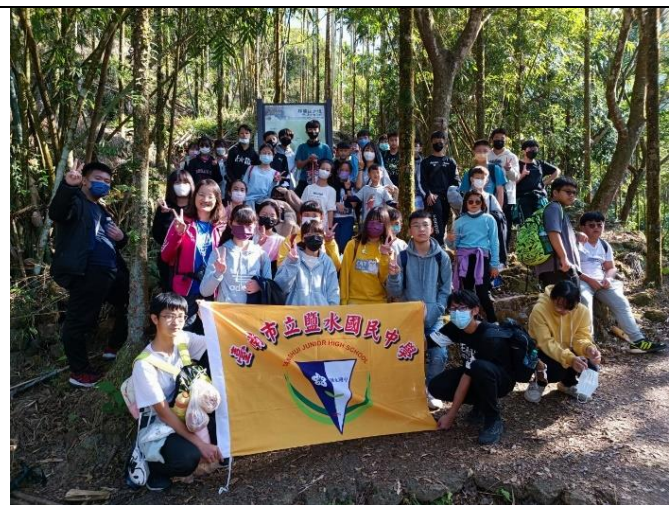
辦理教職員工學生健康體適能健康管理活動(辦理山活動)