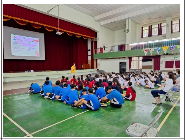
月經平權教育宣導