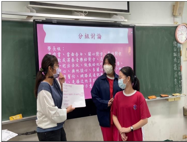
說明：輔導老師進行兩性教育宣導