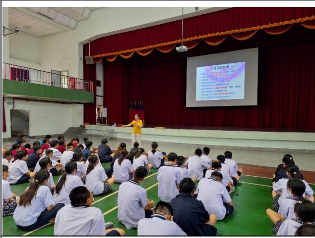
月經平權教育宣導