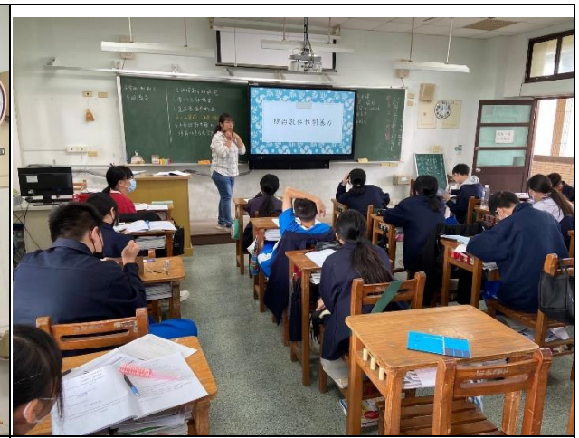
說明：輔導老師進行兩性教育宣導