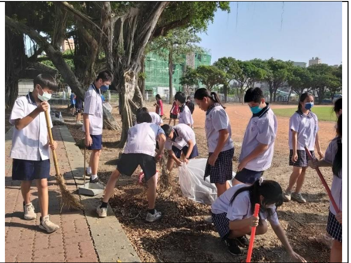
學生參與校園美化綠化工作