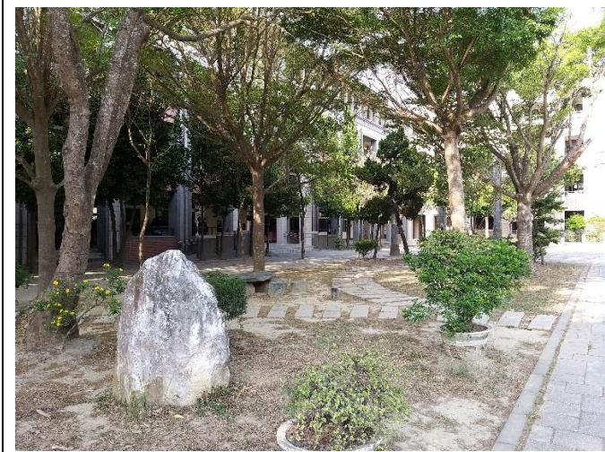
無菸無毒環境營造紀錄