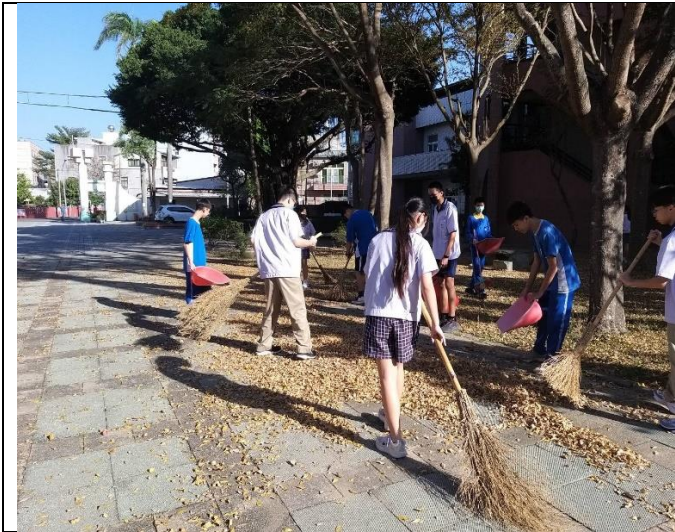
學生參與校園美化綠化工作