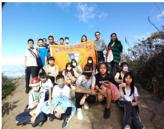
每學期舉辦登山暨淨山活動，校長帶領師長、家長及學生一起參加(關仔嶺---雞籠山)