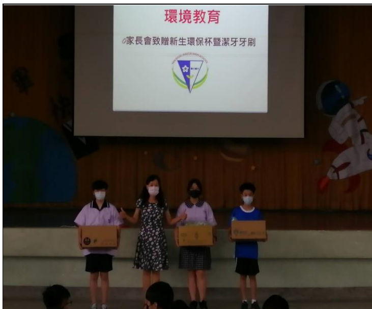
新學期初校長致贈國一新生牙刷及水杯，鼓勵學生多喝白開水，以及餐後潔牙