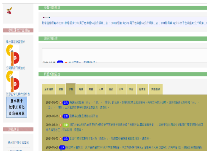
利用學校網站，宣導健康議題