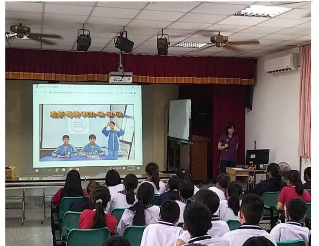
學校護理師定期進行年級性健康宣導講座