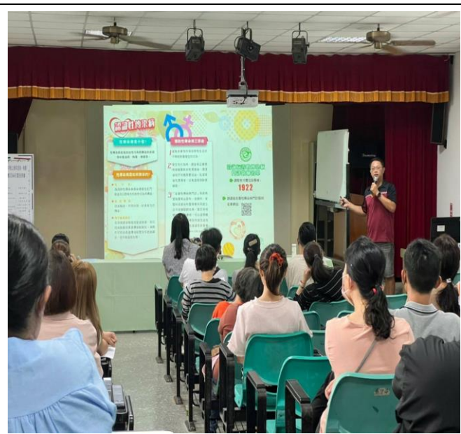
利用班親會，向家長宣導健康議題