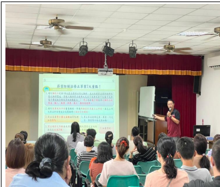
利用班親會，向家長宣導健康議題