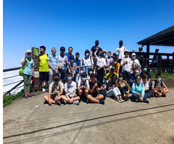
每學期舉辦登山暨淨山活動，校長帶領師長、家長及學生一起參加(二延平步道)