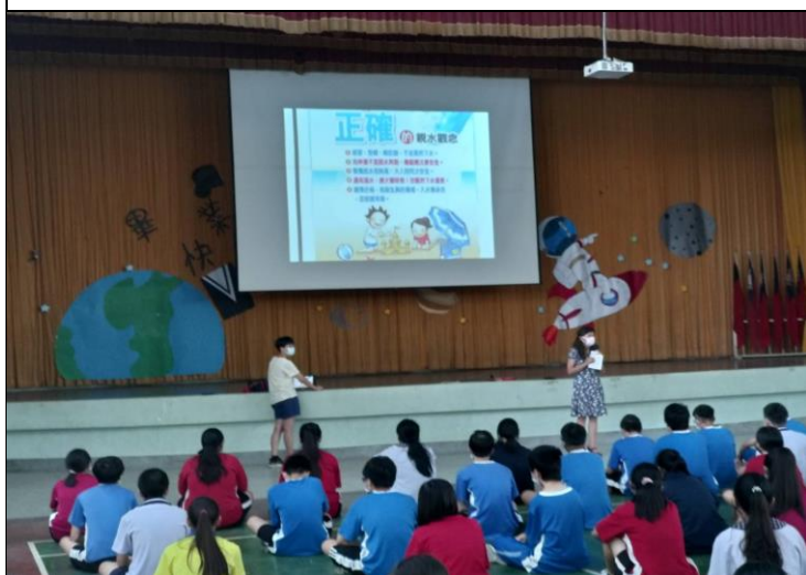
校長利用朝會宣導健康促進議題