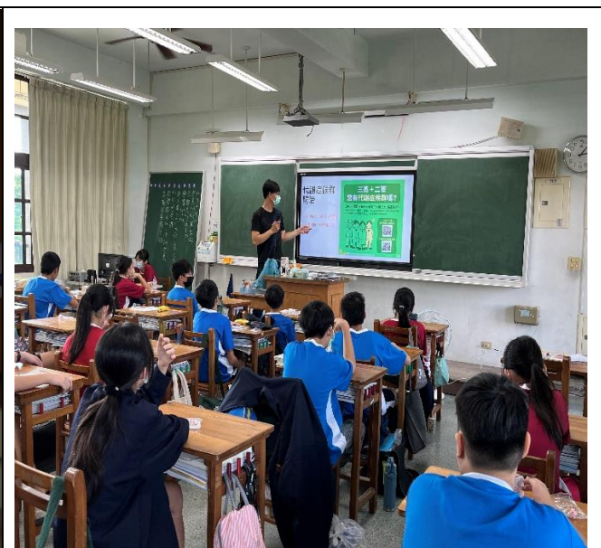
衛生所藥師入班進行健康議題宣導