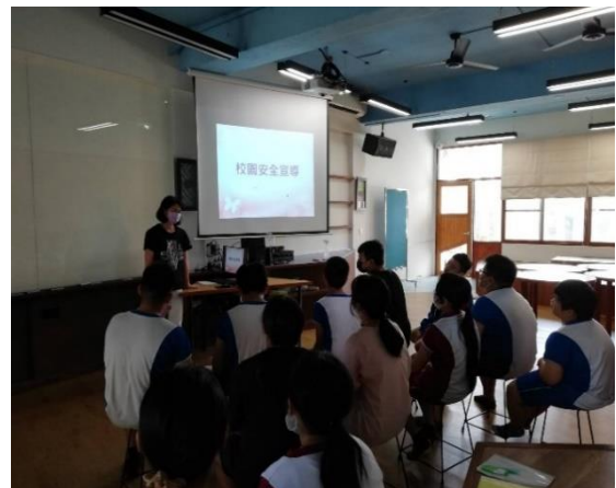
說明：護理師進行校園安全及緊急傷病宣導