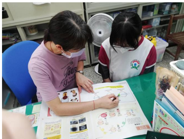
說明：高風險高度近視學生個別衛教視力保健的重要