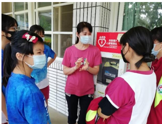
說明：介紹校內 AED 位置及功能，使能應對緊急傷病處置