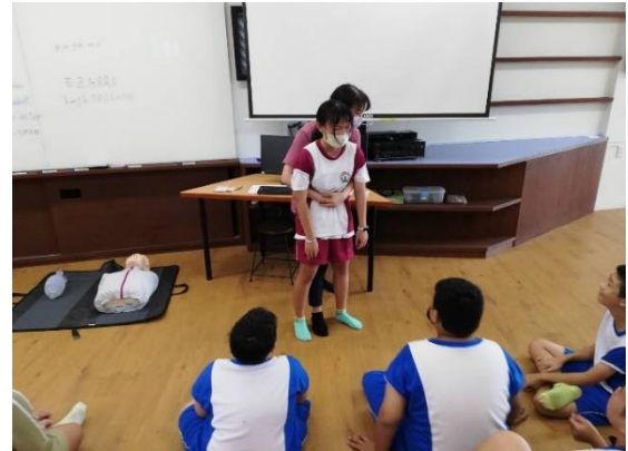
說明：護理師進行異物哽塞實作教學