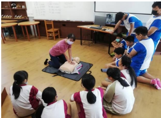
說明：護理師進行 CPR 實作教學