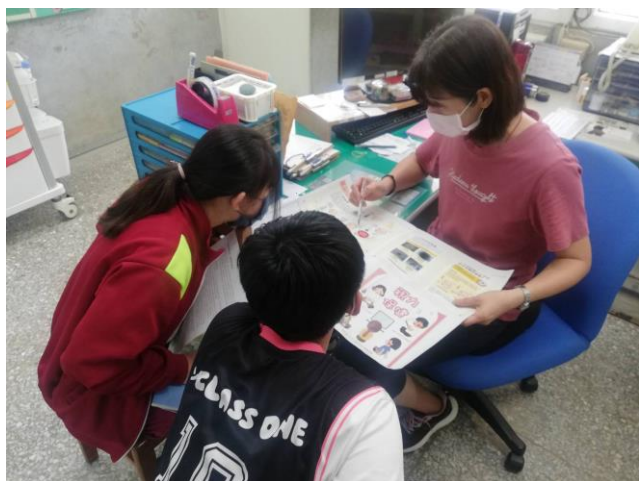
說明：高度近視學生個別衛教視力保健的重要