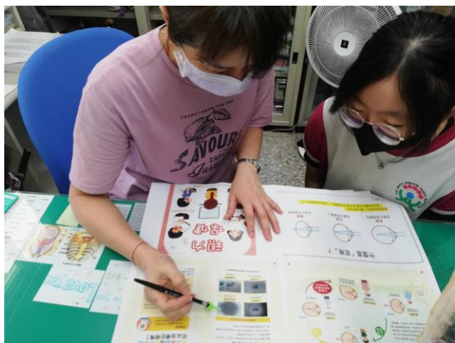
說明：高度近視學生個別衛教視力保健的重要