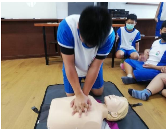
說明：學生 CPR 回覆示教