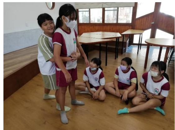
說明：學生異物哽塞回覆示教