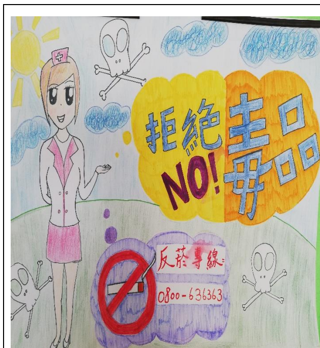
說明：反菸反毒作品~1