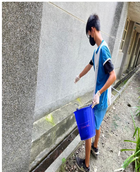
說明：防治登革熱~於水溝投擲乳塊