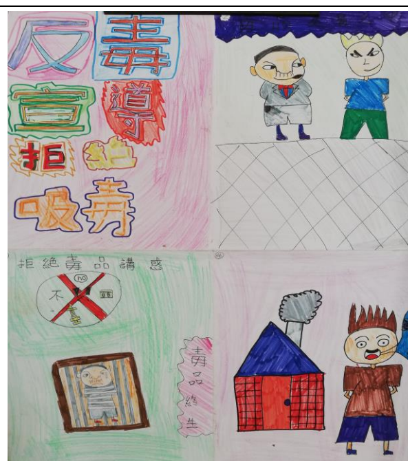
說明：反菸反毒作品~2