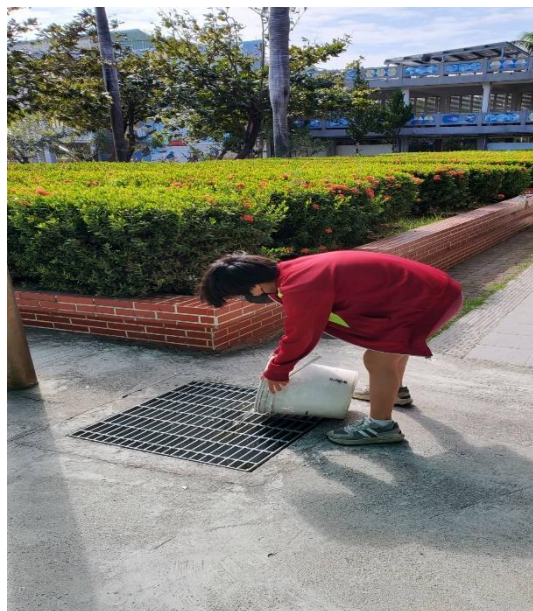
說明：防治登革熱~清除積水容器