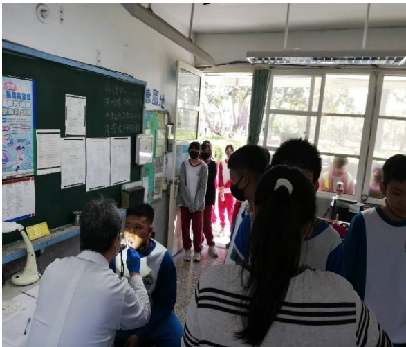
臺南市立北門國口中腔巡迴醫療檢查結果統計表