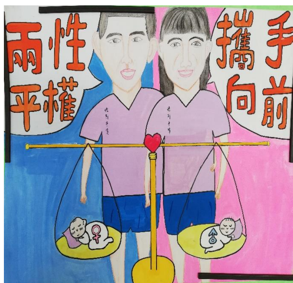
說明：兩性平權作品