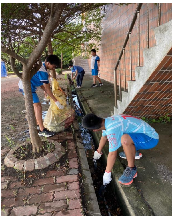
說明：防治登革熱~水溝清淤