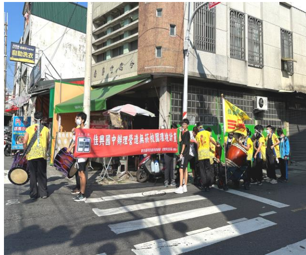
配合在地廟宇活動向社區居民宣導菸酒檳防制觀念以維護身體健康