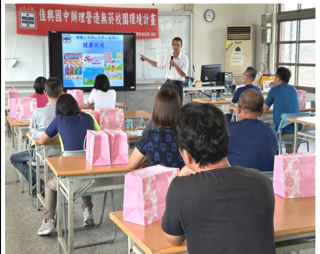
結合親職教育辦理家長菸酒檳防制課程