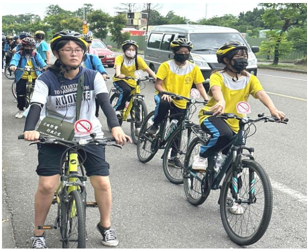
辦理菸酒檳危害防制宣導之單車騎乘社區巡禮活動