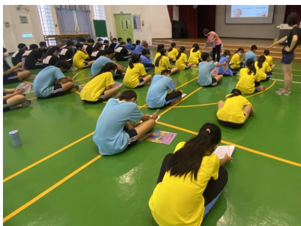
填寫健康識能問卷-前測