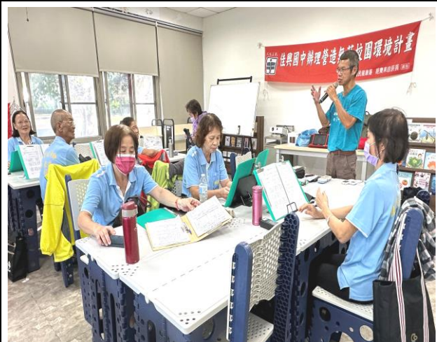
結合樂齡課程向社區民眾宣導菸酒檳防制