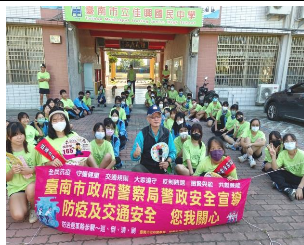
辦理健康體適能反毒拒菸社區路跑活動前向師生宣導菸害防制的重要性