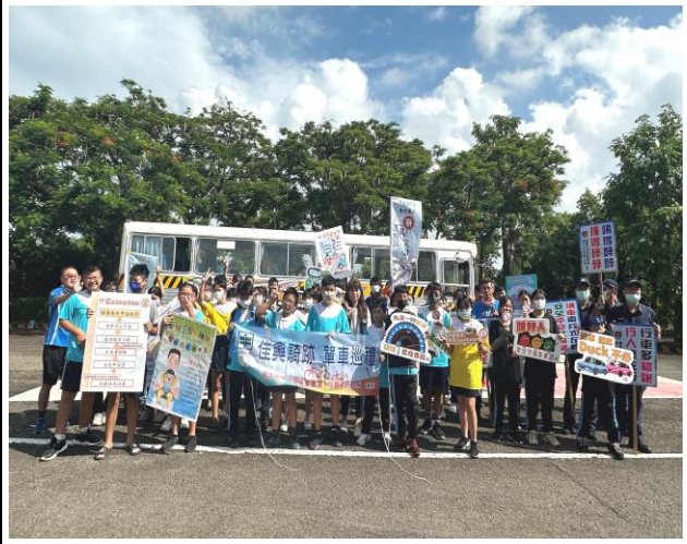
辦理菸酒檳危害防制宣導之單車騎乘社區巡禮活動