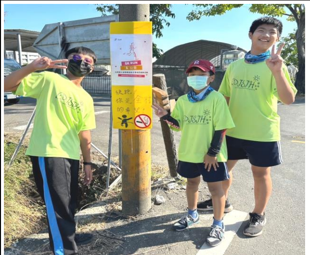
辦理健康體適能反毒拒菸社區路跑活動