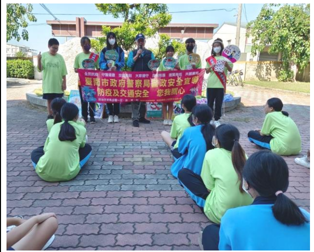
辦理健康體適能反毒拒菸社區路跑活動前向學生宣導菸害防制的重要性