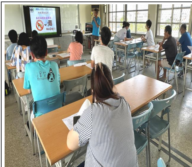
結合校內會議辦理教職員工菸酒檳防制課程宣導講座