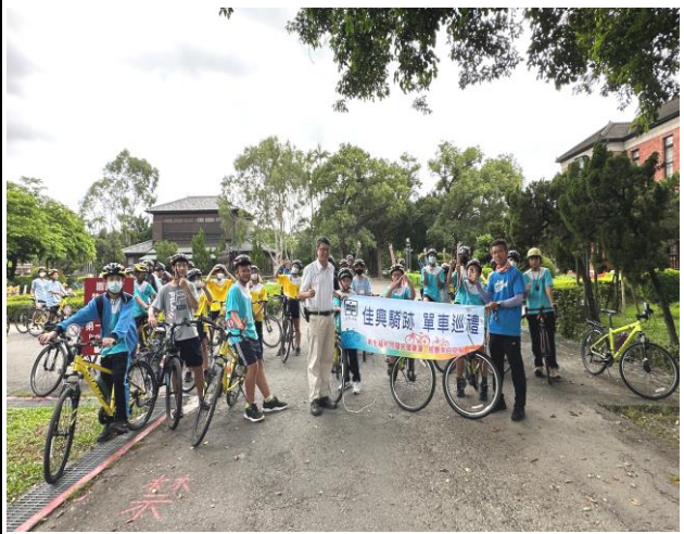
辦理菸酒檳危害防制宣導之單車騎乘社區巡禮活動