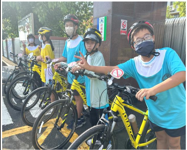
辦理菸酒檳危害防制宣導之單車騎乘社區巡禮活動