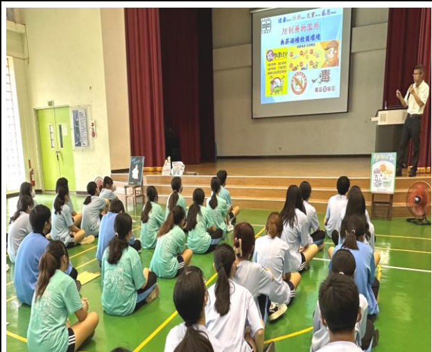
結合校內集會辦理教職員工菸酒檳防制課程宣導講座