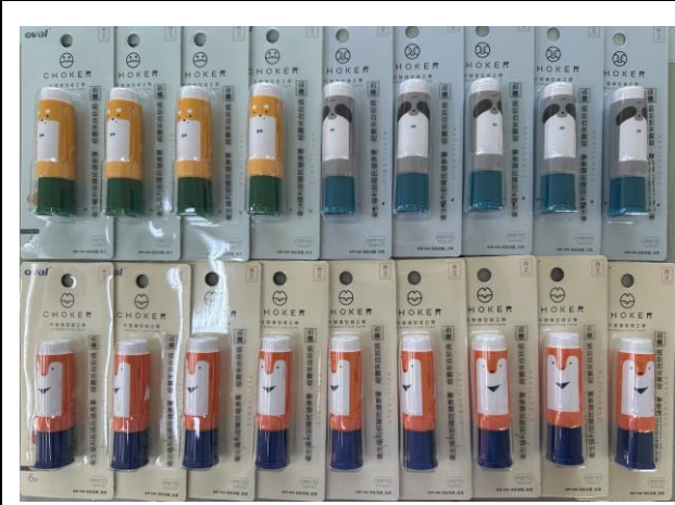
製作宣導品宣導菸害防制的重要性