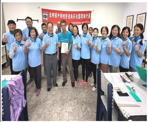
結合樂齡課程向社區民眾宣導菸酒檳防制