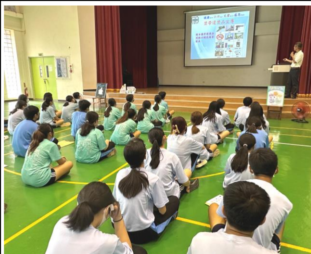
結合校內集會辦理教職員工菸酒檳防制課程宣導講座