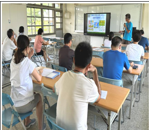
結合校內會議辦理教職員工菸酒檳防制課程宣導講座