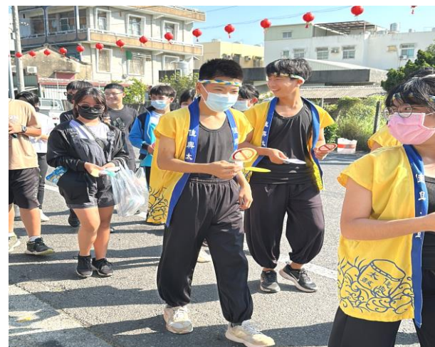
配合在地廟宇活動向社區居民宣導菸酒檳防制觀念以維護身體健康