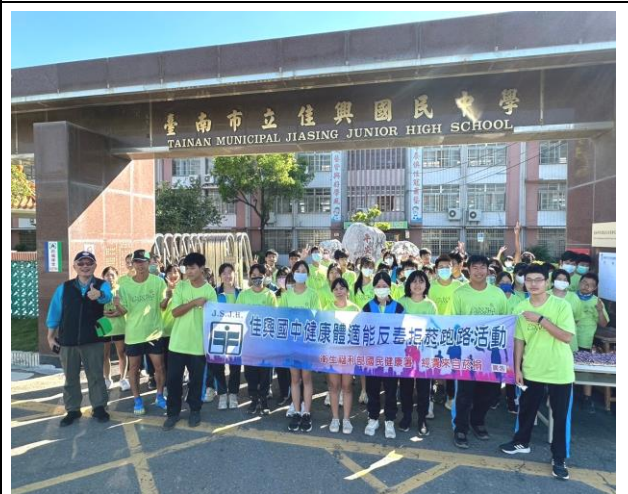
於學習評量後辦理健康體適能反毒拒菸社區路跑活動