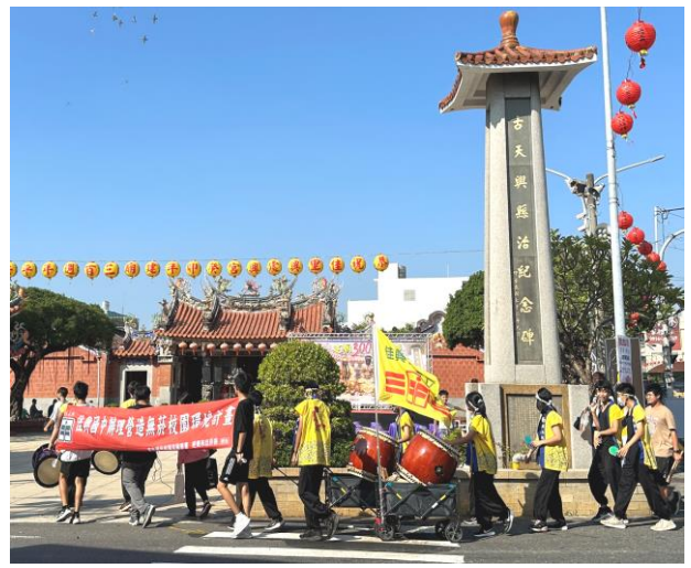
配合在地廟宇活動向社區居民宣導菸酒檳防制觀念以維護身體健康