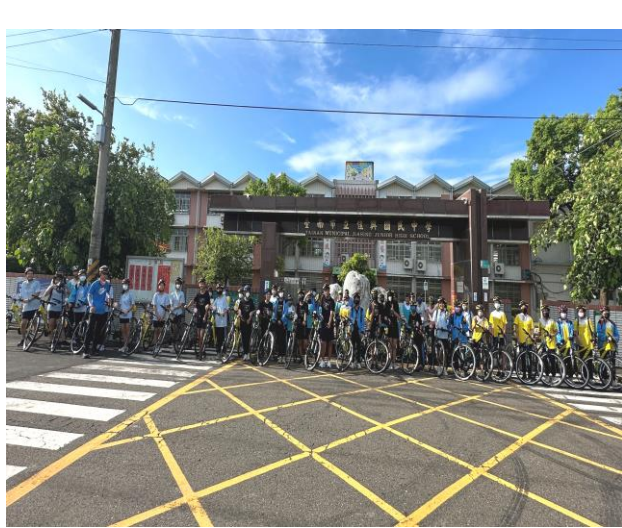
辦理菸酒檳危害防制宣導之單車騎乘社區巡禮活動