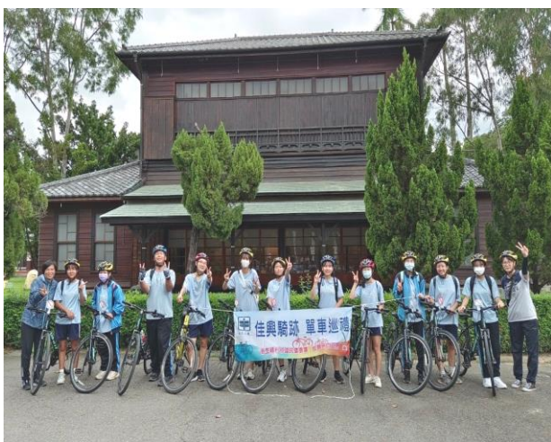
辦理菸酒檳危害防制宣導之單車騎乘社區巡禮活動