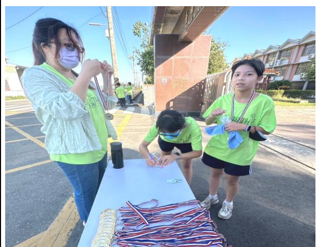
反毒拒菸社區路跑完賽後領取完賽獎牌及紀念方巾等完賽禮