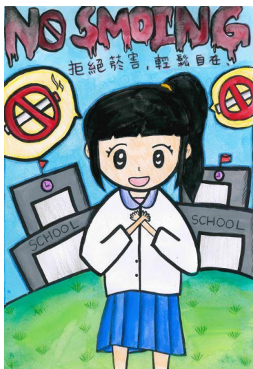
無菸校園禁菸標示設計比賽優選作品