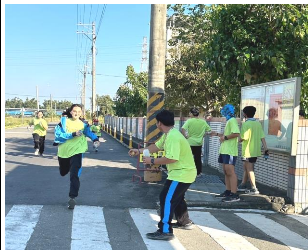
辦理健康體適能反毒拒菸社區路跑活動