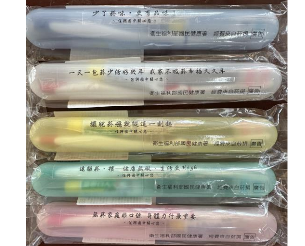
結合健康促進製作宣導品宣導菸害防制的重要性