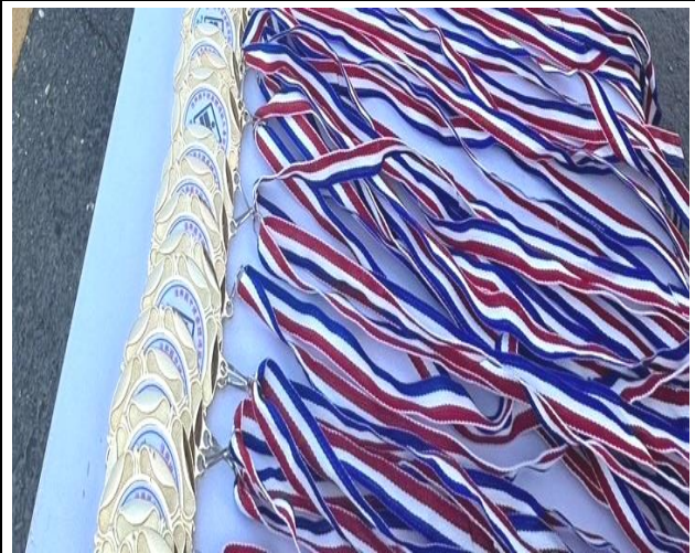
製作健康體適能反毒拒菸社區路跑完賽獎牌宣導菸害防制的重要性