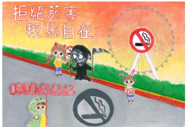
無菸校園禁菸標示設計比賽優選作品