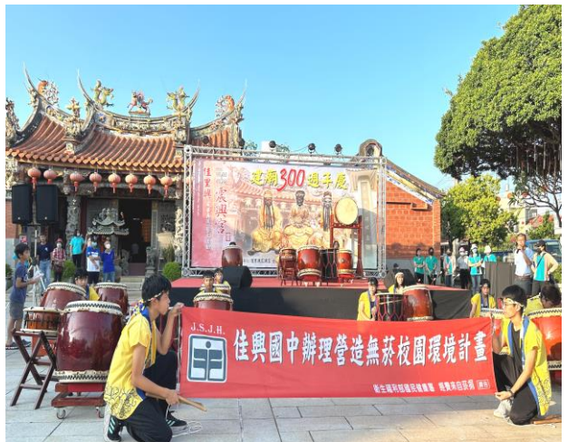
配合在地廟宇活動向社區居民宣導菸酒檳防制觀念以維護身體健康