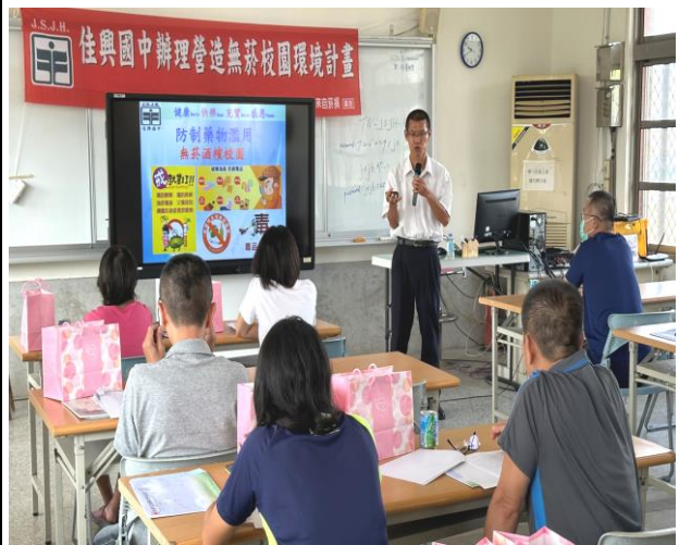
結合親職教育辦理家長菸酒檳防制課程