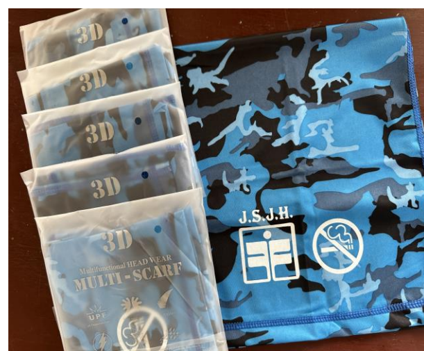
結合單車課程製作宣導品宣導菸害防制的重要性