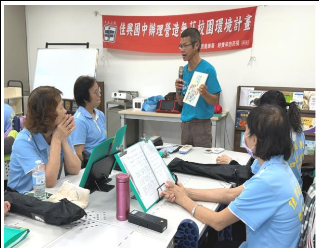
結合樂齡課程向社區民眾宣導菸酒檳防制暨融入新興菸品危害認知