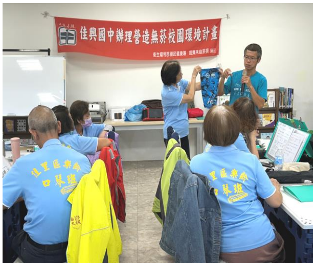
結合樂齡課程向社區民眾宣導菸酒檳防制