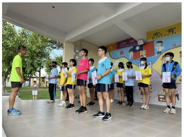
利用集會時間頒發無菸校園禁菸標示設計比賽優選學生獎狀