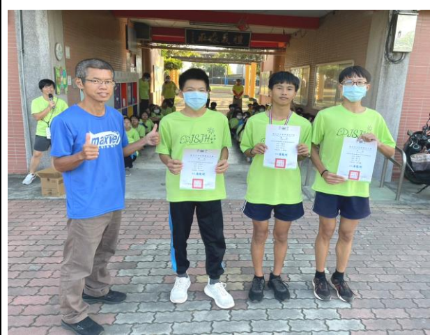
反毒拒菸社區路跑後進行優勝同學頒獎並分享健康身心靈的重要