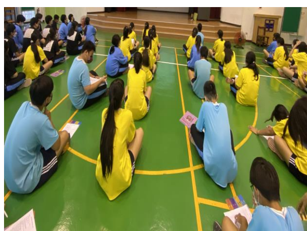
填寫健康識能問卷-後測