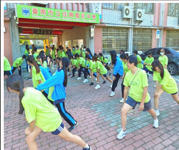
健康體適能反毒拒菸社區路跑活動前帶領師生進行暖身操避免運動傷害