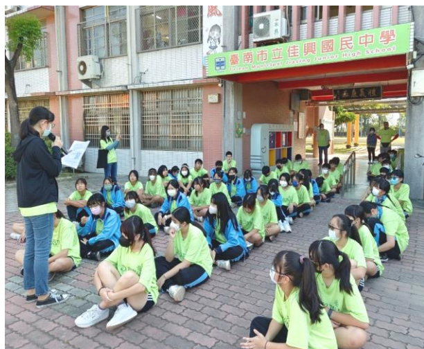
辦理健康體適能反毒拒菸社區路跑活動前向學生說明注意事項