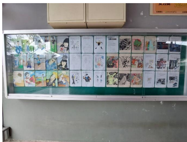
說明：學校牆面藝術布置