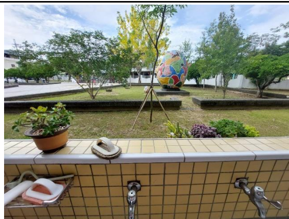
說明：走廊綠化美化