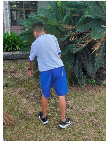
說明：學校環境整理美化