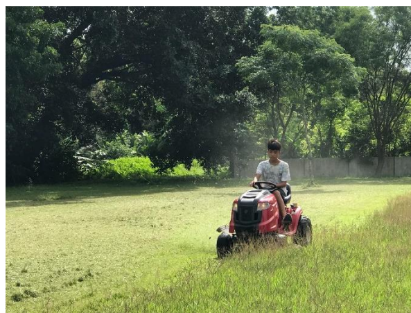
說明：校園環境整理綠美化