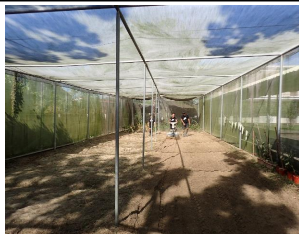
說明：開心農場整理美化