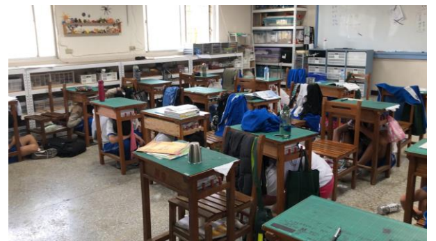
說明：教職員指導全校地震演練室內掩蔽