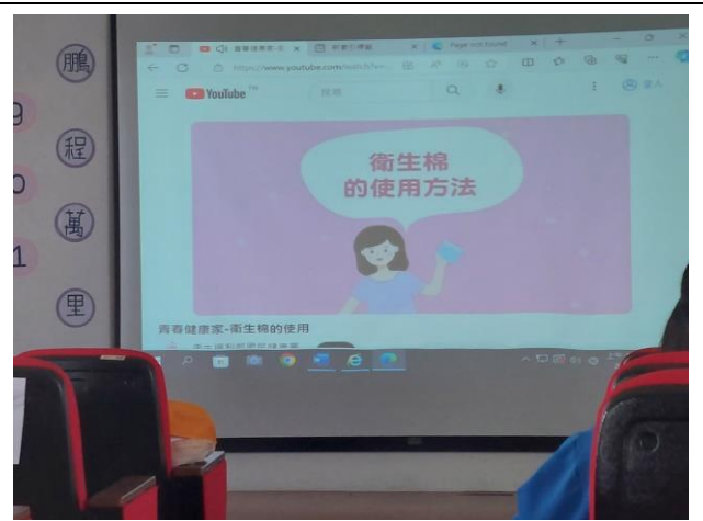
說明：護理師進行月經教育