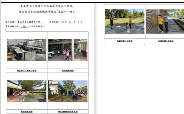
說明：地震演練成果檔(地震+外人入侵)