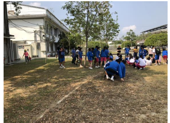
說明：地震防災演習安全教育