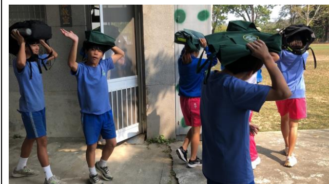
說明：教職員引導全校地震防災演習安全教育